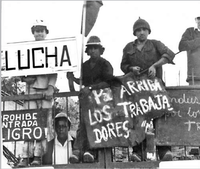
“Los partidos y movimientos integrantes del Comité Coordinador de la Unidad Popular librarán la batalla presidencial...”