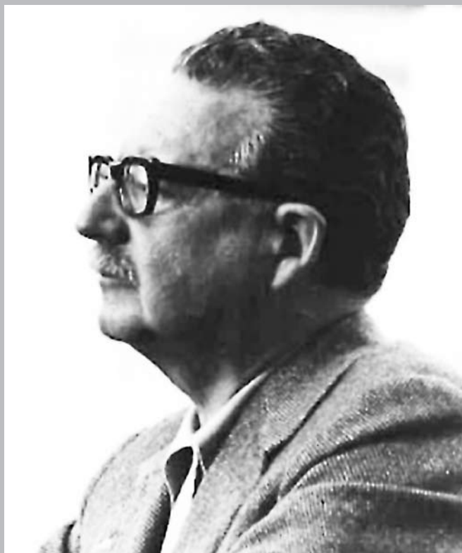
Salvador Allende a la edad de 56 años asume la presidencia de Chile como el primer mandatario marxista democráticamente electo.