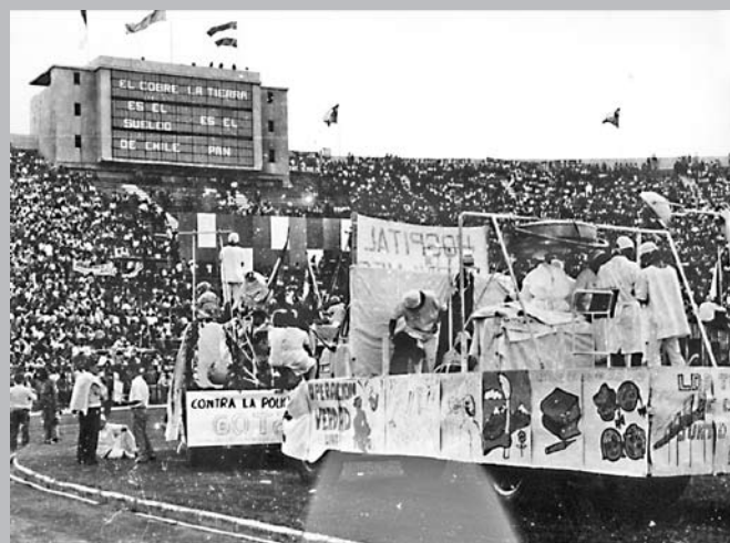
“¡Trabajadores de mi patria!: Tengo fe en Chile y en su destino”.