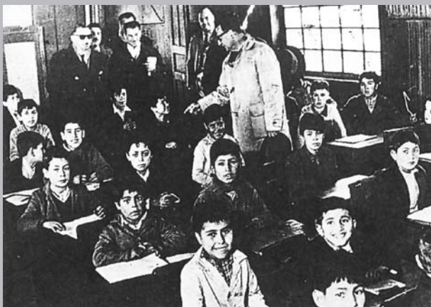
Una medida del Gobierno popular fue: “Matrícula completamente gratuita, libros, cuadernos y útiles escolares sin costo para todos los niños de la enseñanza básica”.