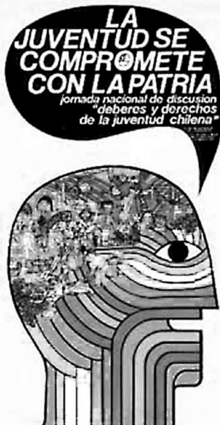
Promovió un gran debate nacional entre padres, madres, maestros, alumnos y trabajadores de la educación.

En el mundo contemporáneo, no sólo los países como el nuestro, en vías de desarrollo, han sufrido y sufren la penetración del capital foráneo; no sólo somos países productores de materias primas que vendemos barato y compramos caro; somos países que estamos sufriendo una nueva agresión; es aquella que implica vender o no vender tecnología, que representa para los países que la tienen aún mayores ventajas que las que directamente alcanzan cuando invierten sus capitales en los países como el nuestro, en el pleno camino de la producción.