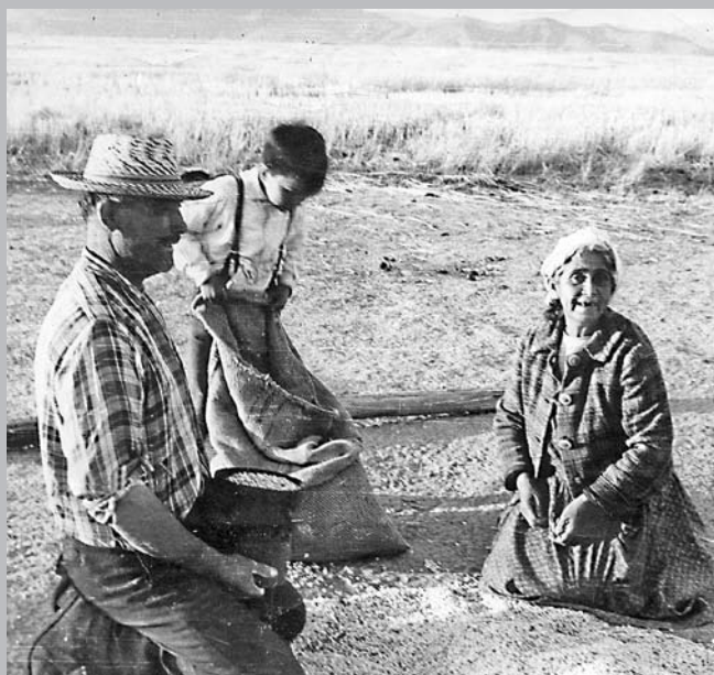
Con la Reforma Agraria logró expropiar más de dos millones de hectáreas para entregarlas a los campesinos.