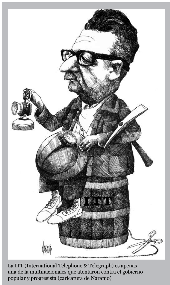
La ITT (International Telephone & Telegraph) es apenas una de las multinacionales que atentaron contra el gobierno popular y progresista (caricatura de Naranjo)