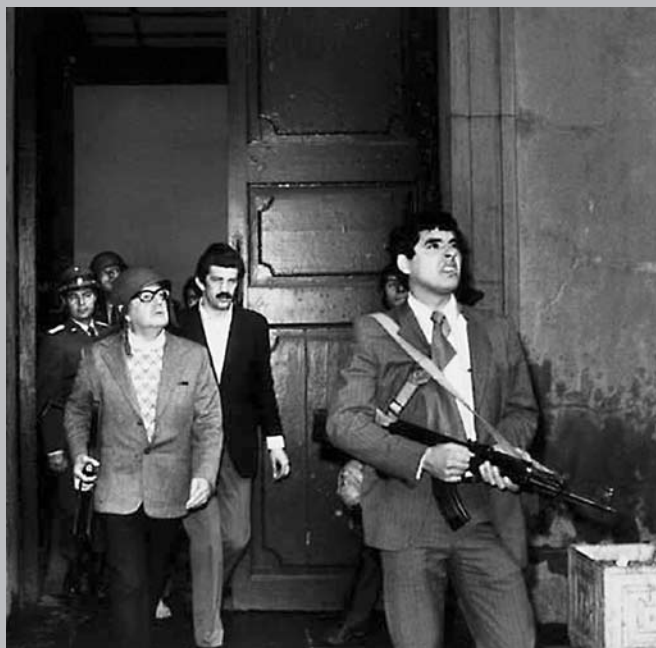
Conocido como “el hombre de la paz”, Allende defendió con su vida sus ideales políticos y sociales.