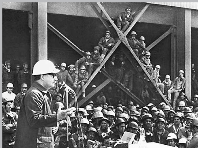
Allende explicaba a los trabajadores cómo los monopolios norteamericanos, controlan el cobre, hierro, salitre y el comercio exterior.