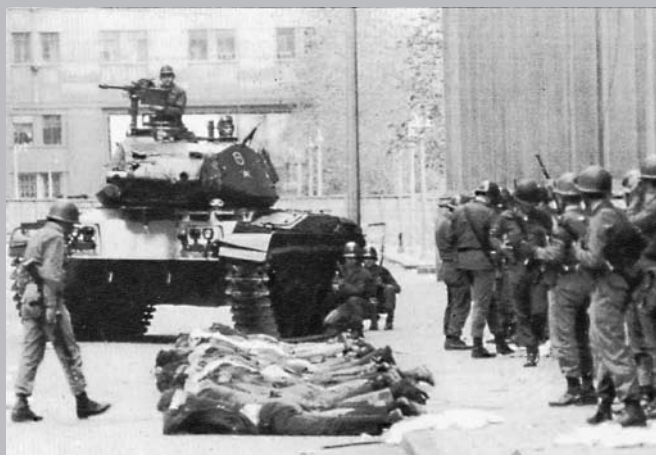
El imperialismo con todo su poderío intervencionista atacó, corrompió, humilló y eliminó el proyecto socialista chileno.