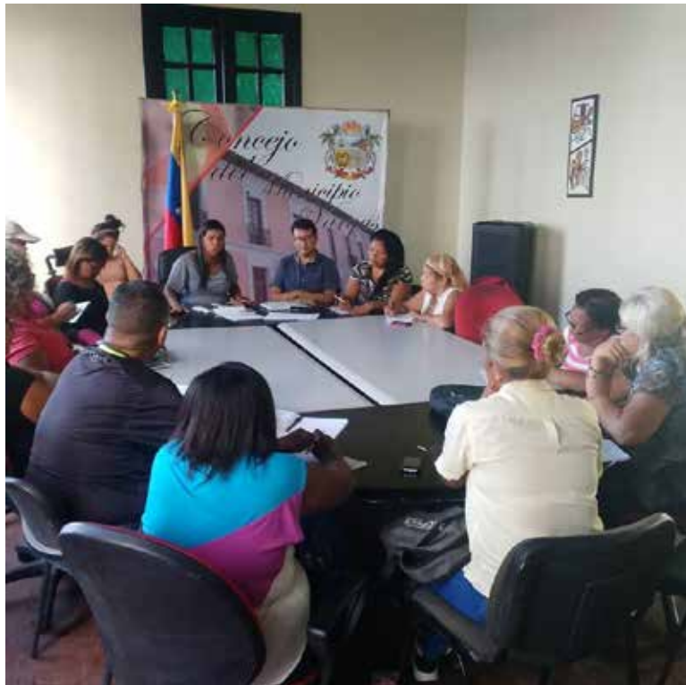
Reunión de Concejales del Concejo del Municipio Bolivariano de Vargas en la presentación del anteproyecto de Ordenanza para la Transferencia al Poder Popular de la Gestión y Administración Comunitaria de Servicios, Bienes y Atribuciones del Municipio.

na y un trabajo tesonero de los actuales encargados 32 funcionarios disfrutaran de sus beneficios con sueldo y además la oferta de asignarles trabajos voluntarios de apoyo, lo mismo que la depuración de una nómina a veces toxica. La solidaridad con pueblos hermanos produce proclamas públicas como en los casos de Bolivia, Argentina, Colombia y Chile que mostraron a las claras la determinación y adhesión con espíritu clasista y latinoamericano. Fijar la posición frente a las ofensivas de los EUA y la des-