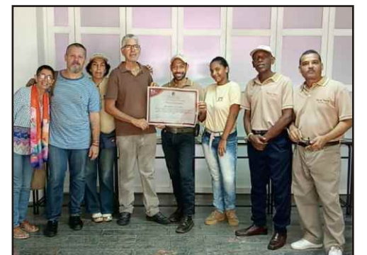
Parte del equipo