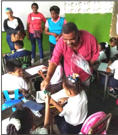
Entrega del Chocoalim a los estudiantes