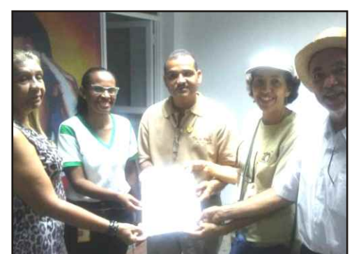
Reconocimiento por parte del equipo Kfunga a TereTere