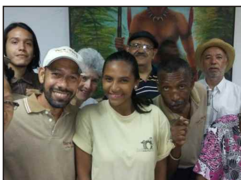
Kfunga y TereTere unidos