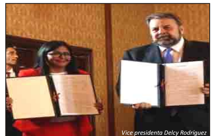
Vice presidenta Delcy Rodríguez