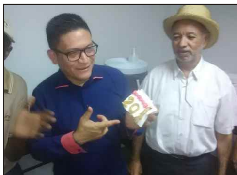
Alcalde Hugo Martínez