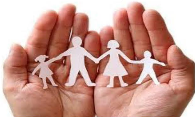
La familia, base fundamental de la sociedad

las personas, hay quienes ni siquiera visitan, envían mensajes de texto o realizan al menos una llamada a la semana, pero cuando las personas ya no están lamentan lo que no hicieron, suponen y se preguntan qué hubiera pasado si hubieses actuado a tiempo. La realidad es que no todos actúan a tiempo, y sigues transitando por la vida creyendo que tus familiares serán eternos y lo dejas para después. Es por ello, que te invito a decir a quien amas que los amas, a que comen juntos, a obsequiar una historia, a mirar la televisión, a compartir al menos un café... Porque si la familia lo es todo, deberías comenzar hacerles saber a tiempo que con defectos o no siempre querrás que lo sepan, que tú estás para ellos en persona o en la distancia, sin interés, porque el reloj no se detiene y el tiempo es ahora. No esperes el último aliento, porque mientras el corazón tenga latidos tienes la oportunidad de decir las cosas a tiempo.