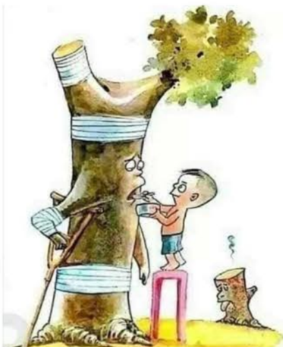
El medio ambiente te necesita

La Amazonia es la selva tropical más grande del mundo. Se considera un punto clave de biodiversidad, con muchas especies únicas de plantas y animales. Esta densa selva absorbe una enorme cantidad del dióxido de carbono del mundo, un gas de efecto invernadero que se cree es el mayor factor del cambio climático, por lo que los científicos dicen que preservar la Amazonia es vital para combatir el calentamiento global.