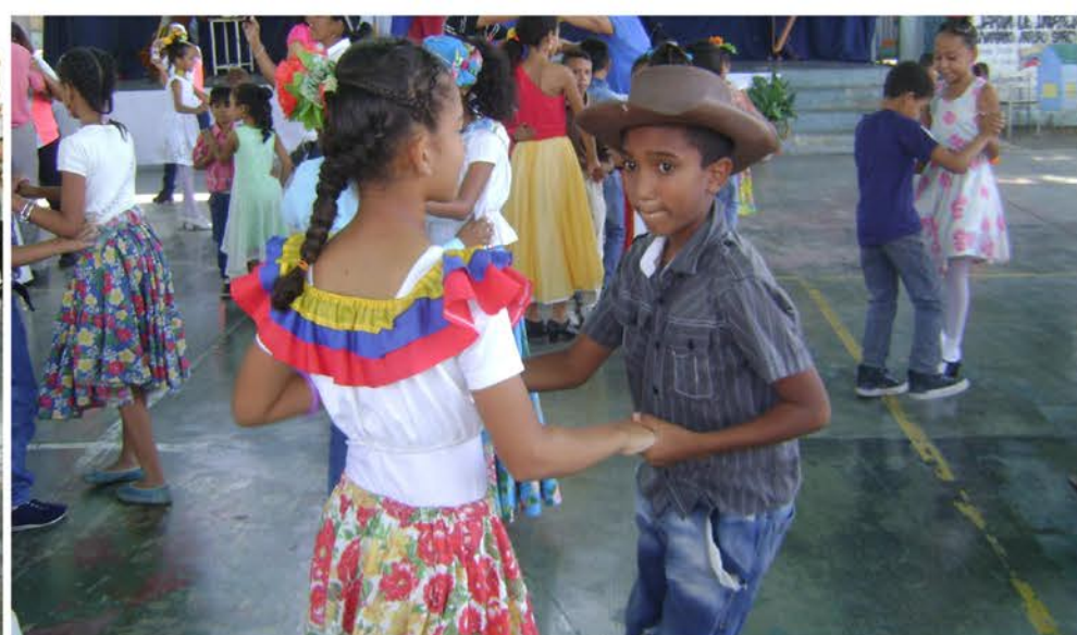
Cultura, Joropo y Patrimonio