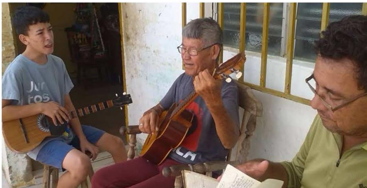
Una generación de cultores en Falcón