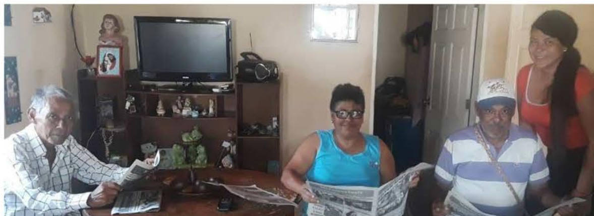
Aire Libre Nirgua