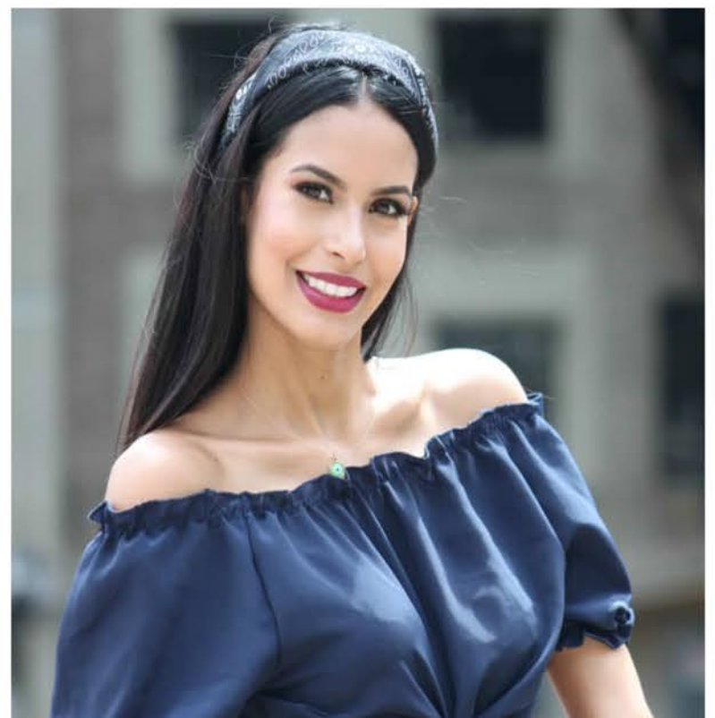
Jóven Ingeniero y Modelo Profesional

da, emprendedora, erradicada en la inteligencia, todo esto describirá su belleza integral. Hernández agradece a su familia por siempre poner un granito de arena para lograr sus metas, en especial a su mamá pilar fundamental en todos los pasos que ha emprendido, al igual que a sus hermanos por creer en su potencial. Se caracteriza por ser humilde, finaliza con expresar "Nunca hay que perder la esencia porque eso es lo que te llevara a cualquier lugar a brillar".