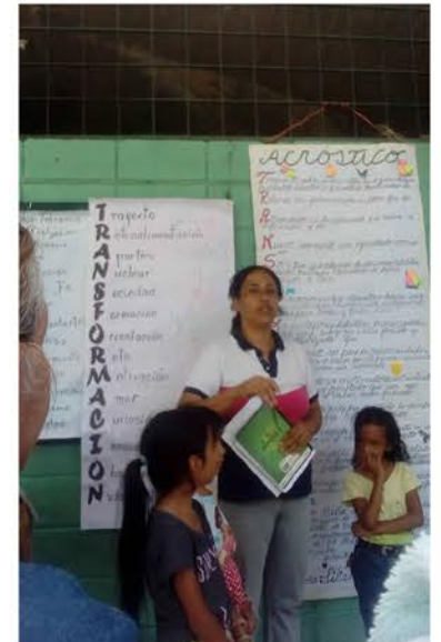
Docente explicando la transformación educativa

lisis de pensamientos de la pedagogía del amor, el ejemplo y la curiosidad. Donde presentaron una dramatización en la cual fue representado el efecto metamorfosis en las mariposas, semejando la transformación de los participantes y asesoras de los PNFA, tomando en cuenta el lema "Desaprender para aprender es el camino".