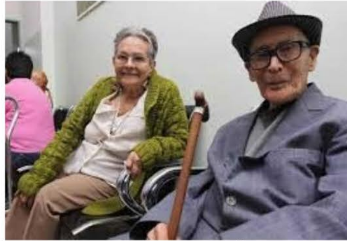
Experiencia y sabiduría

Muchas veces he escuchado decir a personas de la tercera edad ¡Creen que nunca llegaran a viejos!, y es por eso que quiero dedicar estas palabras a todos aquellos adultos mayores que tienen la dicha de estar en esa edad, los cuales merecen un buen trato, no ser desplazados, ni creerlos pocos útiles, porque por el contrario están llenos de conocimientos, muchos desde lo empíri-