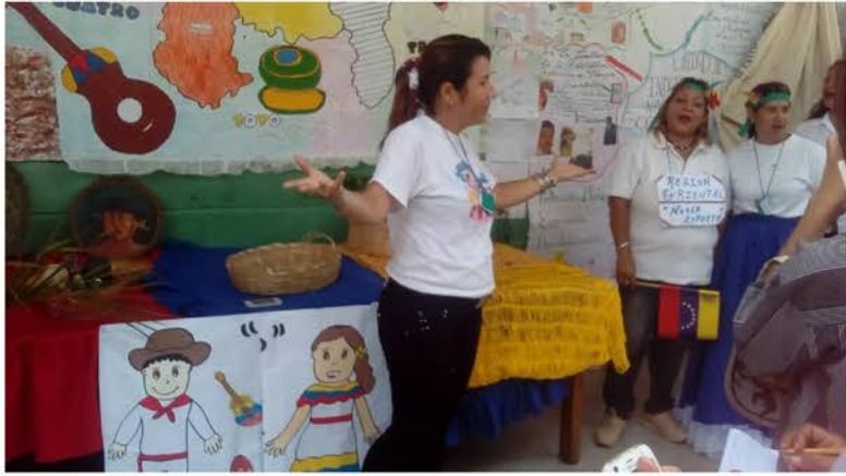
Asesores del Programa de Formación

Un grupo de docentes forman parte de los Programas Nacionales de educación inicial que