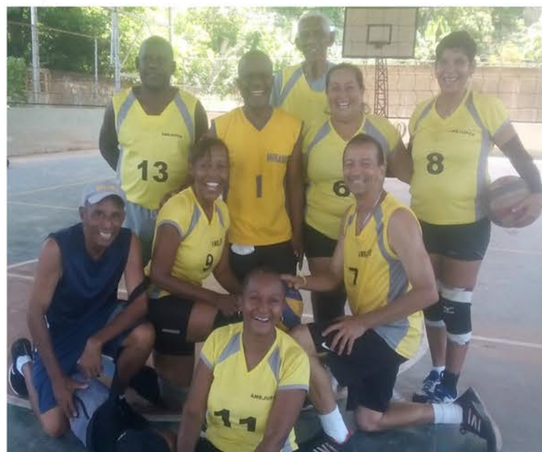
Muchos atletas se dieron cita en el encuentro

las delegaciones fueron ensamblajes 2 o 3 bailes de acuerdo a su región y sus cultura popular de su Estado.