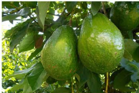
Agosto época de Aguacate

RECETA GUASACACA DE AGUACATE CASERA. Divina salsa venezolana. Ingredientes: 1 aguacate maduro, 1 rama cebollino, 3 dientes de ajo, Perejil, Cilantro, Pimentón verde, Sal al gusto, 2 cucharadas grandes de mayonesa, 1 poco de aceite vegetal, de ser necesario un poco de agua. PASOS PARA LA PREPARACIÓN. Pelar y picar el aguacate y colocar en la licuadora junto con todos los demás ingredientes incluyendo la mayonesa y el aceite y licuarlo. Si se ve muy espeso agregar un poquito de agua solo para ayudar a aliviar el espesor, mas esta salsa debe quedar espesa. Colocar sal al gusto y envasar en cualquier frasco de vidrio con tapa y mantener refrigerado.