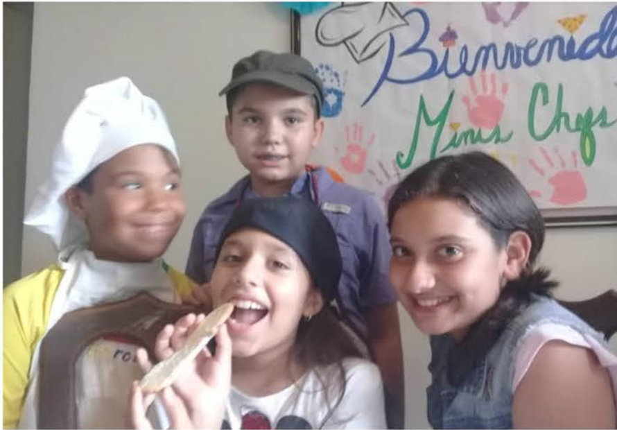
Minis Chef en Carabobo

Ahora en temporadas de vacaciones una de las alternativas de entretenimiento y diversión para los niños y niñas es aprender desde la cocina como mini chef, entre dulces y aperitivos sencillos, haciendo uso de implementos con la supervisión y la orientación de expertos. Esta experiencia fue llevada a cabo en distintos Estados del país, haciendo referencia en esta oportunidad al Estado Aragua en la comunidad 12 de Octubre y Carabobo, específicamente en el sector La Granja, donde se ob-