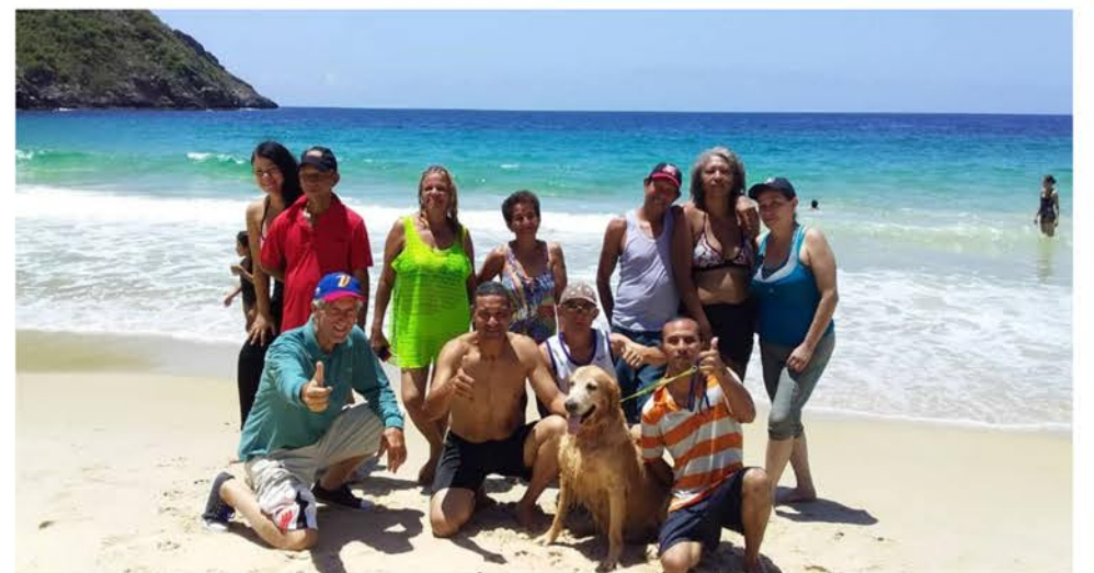
Hermoso paisaje en Cata Ocumare de la Costa—Aragua

su vez compartieron con trabajadores de economía informal entre ellos artesanos y vendedores de chocolate artesanal, quienes cuidan de los espacios, y tratan de manera muy cordial al turista.