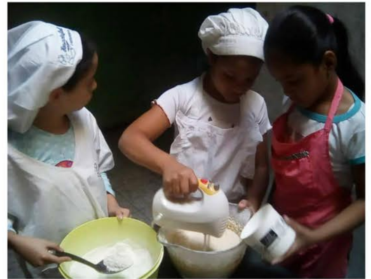
Minis Chef en Aragua

Ahora en temporadas de vacaciones una de las alternativas de entretenimiento y diversión para los niños y niñas es aprender desde la cocina como mini chef, entre dulces y aperitivos sencillos, haciendo uso de implementos con la supervisión y la orientación de expertos. Esta experiencia fue llevada a cabo en distintos Estados del país, haciendo referencia en esta oportunidad al Estado Aragua en la comunidad 12 de Octubre y Carabobo, específicamente en el sector La Granja, donde se ob-