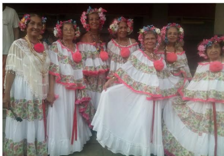
Hicieron presencia las actividades Culturales

Los juegos invitacionales de docentes jubilados y pensionados se realizan todos los años en el mes de julio y agosto, esta vez se dieron cita en Carúpano 2019 del Estado Sucre, donde se presentaron 66 delegaciones de profe-