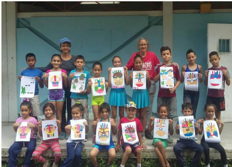
Waraitos y Waraitas mostrando sus producciones artísticas