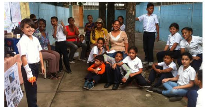
La educación al aire libre puede mejorar su aprendizaje

neuronas. El 40% de la estructura que desarrolla el cerebro en los primeros años, depende del entorno ambiental en el que se desenvuelve el niño. A lo largo de solo siete días, el cerebro es capaz de cambiar con la adquisición de nuevos conocimientos.