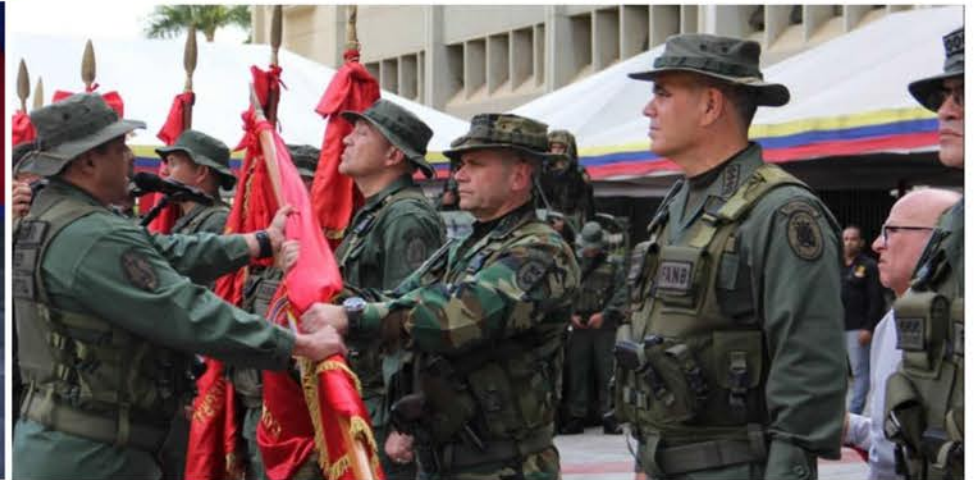
Acto de Transmisión de mando de las Regiones Estratégicas de Defensa Integral, presidido por el General en Jefe Vladimir Padrino López, Ministro del Poder Popular para la Defensa, en compañía del Almirante en Jefe Remigio Ceballos Ichaso, Comandante Estratégico Operacional de la FANB

El Patio de Honor del Ministerio del Poder Popular para la Defensa, fue el escenario donde se llevó a cabo el Acto de Transmisión de mando de las Regiones Estratégicas de Defensa Integral, presidido por el General en Jefe Vladimir Padrino López, Vicepresidente Sectorial de Soberanía Política, Seguridad y Paz y Ministro del Poder Popular para la Defensa, en compañía del Almirante en Jefe Remigio Ceballos Ichaso, Comandante Estratégico Operacional de la FANB, el Estado Mayor Superior de la FANB, y demás personali-