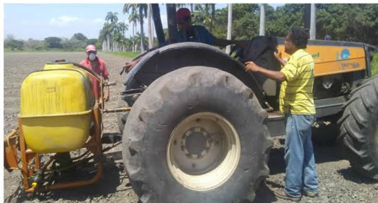
La Milicia Bolivariana presente en el Plan de Siembra

A través de un convenio entre el INIA, CENIAP y la Milicia Nacional Bolivariana elevarán producción de semillas de distintos rubros estratégicos para dar cumplimiento al Plan de la Patria y su gran objetivo histórico dedicado a la soberanía alimentaria,