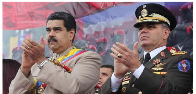
El Presidente designó nuevos Jefes de ZODI