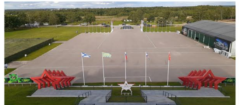
Todo listo para el encuentro deportivo

finen los 12 países que participarán en las carreras de la semifinales de las cuales se seleccionarán 4 equipos para la etapa final.