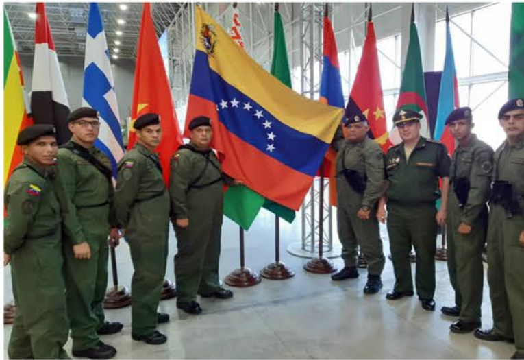
La ZODI Aragua integra la representación Venezolana

El equipo que representará a Venezuela en los 5 Juegos Internacionales Militares en la modalidad de Biatlon de Tanques 2019 ya se encuentra en Rusia en el Parque el Patriota polígono de tiro Alabino y esta integrado por 19 Tanquista de la Patria de Bolívar y Chávez, los cuales participarán en la competencia de Carrera Individual y Carrera de