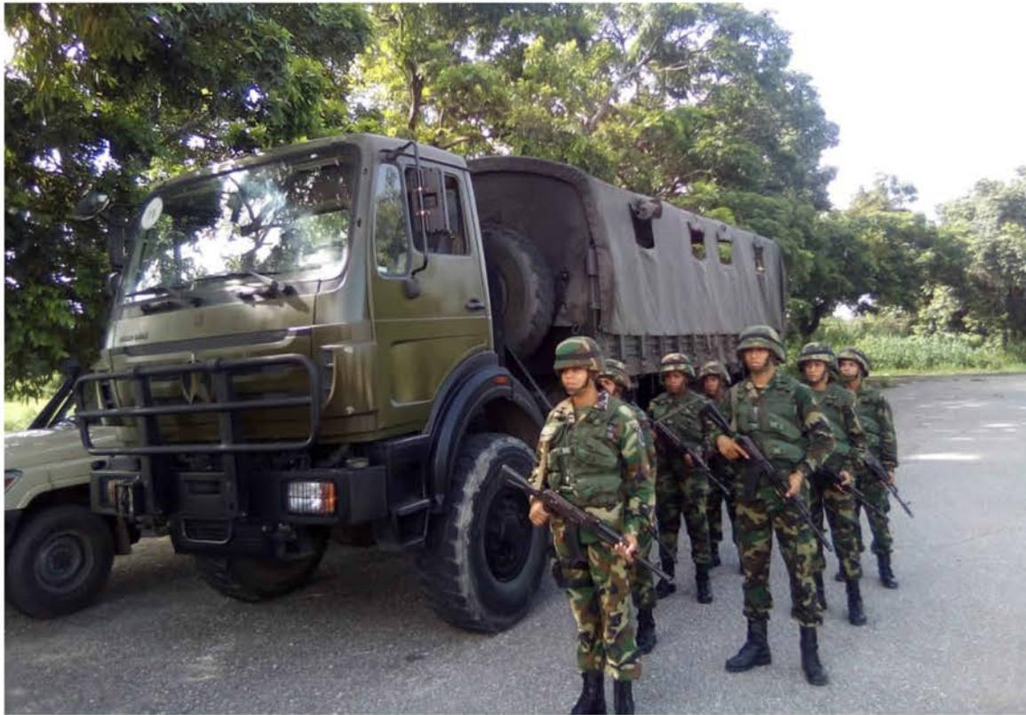
Unidades de Reacción Rápida...Siempre listos

La Zona Operativa de Defensa Integral Aragua, comprometida con la seguridad y resguardo del pueblo aragüeño, activa diariamente a todas las unidades militares, con hombres y mujeres en-