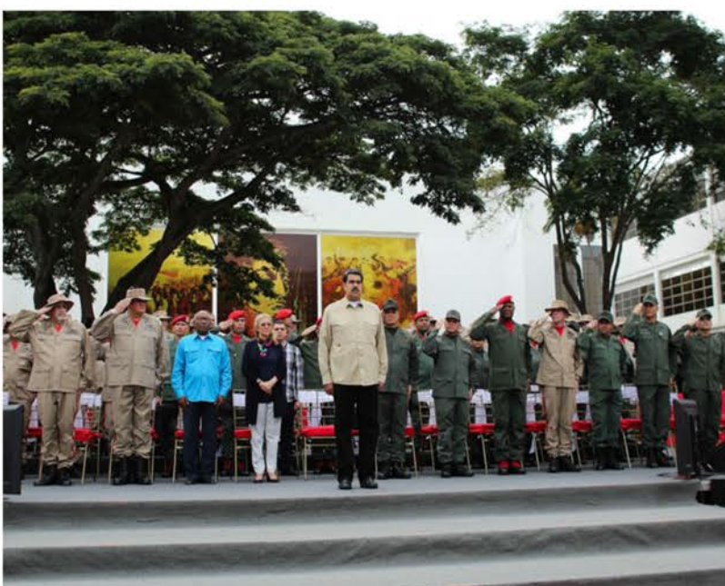
El Presidente Nicolás Maduro Moros C/J de la FANB durante el acto de ascenso de la Milicia Bolivariana

"Más del 80 por ciento de los venezolanos y venezolanas rechazan el llamado a una intervención militar sobre nuestro país", sostuvo el presidente constitucional de la República, Nicolás Maduro Moros, al referirse a diversos estudios de opinión pública que expresan "la unión del pueblo de Venezuela en defensa a la soberanía, autodeterminación al carácter sagrado de Venezuela a la paz". Durante la graduación y acto de ascenso de la Milicia Bolivariana, celebrada en la Academia Militar, en Fuerte Tiuna el Jefe de Estado señaló que "recientemente la asamblea en desacato hizo un acto en una plaza pública y anunciaron