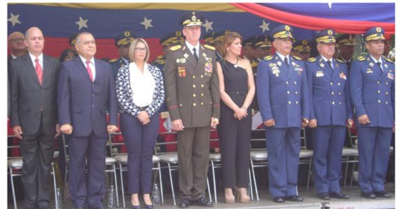
Autoridades Civiles y Militares presentes en el acto

da y partida, pero no podrán con un pueblo unido y fortalecido, y a pesar del ataque al sistema eléctrico no pudieron con nosotros, ya que hay patriotas comprometidos y sabemos quién está detrás de todo esto, pero estamos de pie, acompañando a nuestro comandante en jefe Nicolás Maduro".