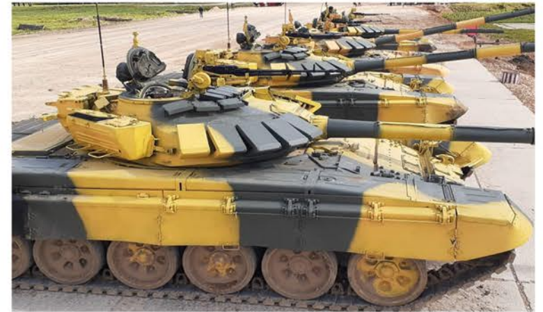
Ya en el terreno esperando la señal de inicio

En esta competencia internacional participarán 24 equipos de 24 países (incluso la Federación de Rusia), que representan a Europa, Asia, África y América Latina entre los que se destacan Kazajstán, China, Irán, Bielorrusia, República Bolivariana de Venezuela, República de Angola, Armenia, Azerbaiyán, Zimbabue, India, Irán, Kazajstán, Siria, Kirguistán, China, Laos, Mongolia, Nicaragua, Serbia, Tayikistán, Uganda, Cuba y Rusia. La "Carrera individual" se celebrarán en el día de la inauguración de los juegos - 03 de Agosto y concluirá el concurso con la final de las 4 mejores tripulaciones y se celebrará el 17 de Agosto. En el concurso participarán 75 tripulaciones de tanques, tres de cada país,