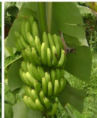
Como parte del Plan de siembra la ZODI Aragua da un paso al frente