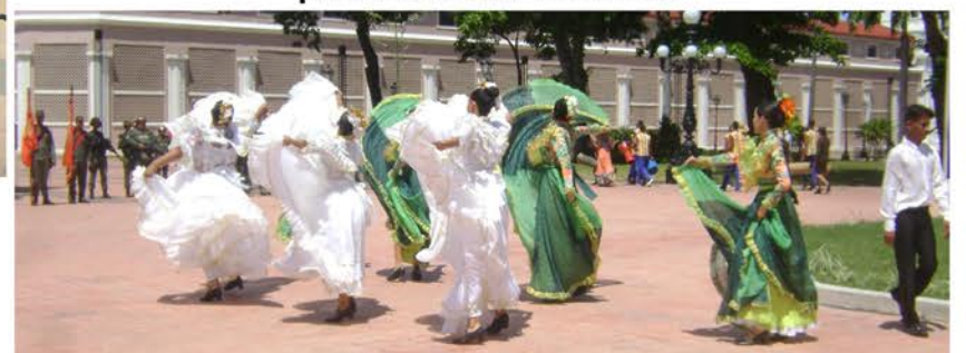
Un acto cultural por todo lo alto disfrutó el público asistente