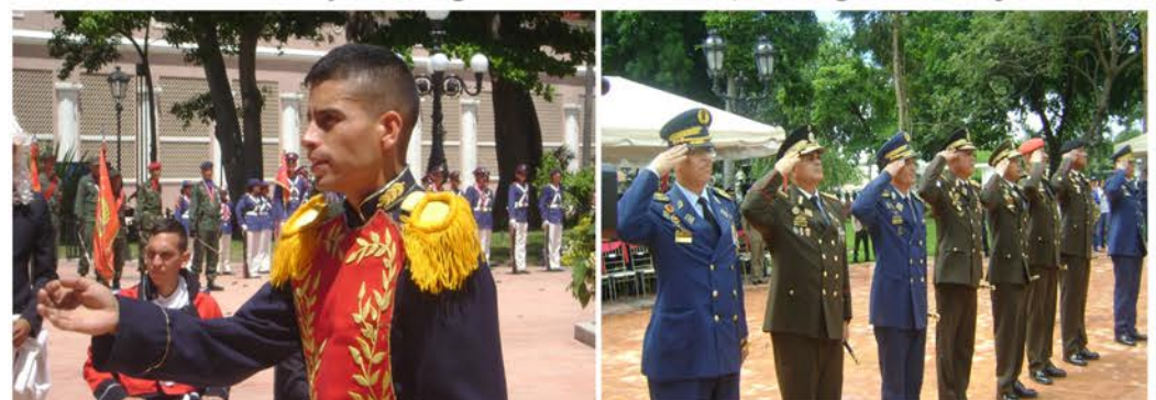
208 años de la firma del Acta de la Independencia