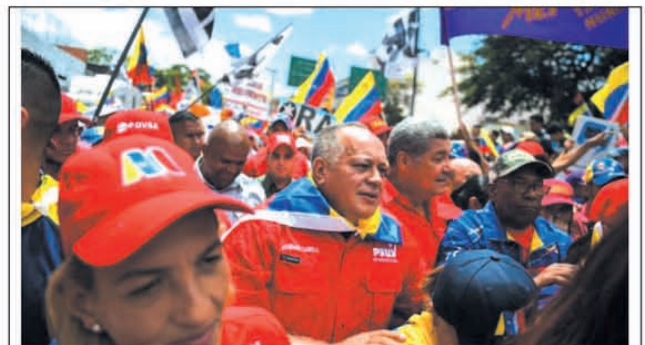
El presidente de la Asamblea Nacional Constituyente de Venezuela, Diosdado Cabello, en la multitudinaria marcha realizada en Caracas, el 10 de agosto de 2019, en contra de la última medida de Trump, quien ordenó un embargo total a Venezuela.