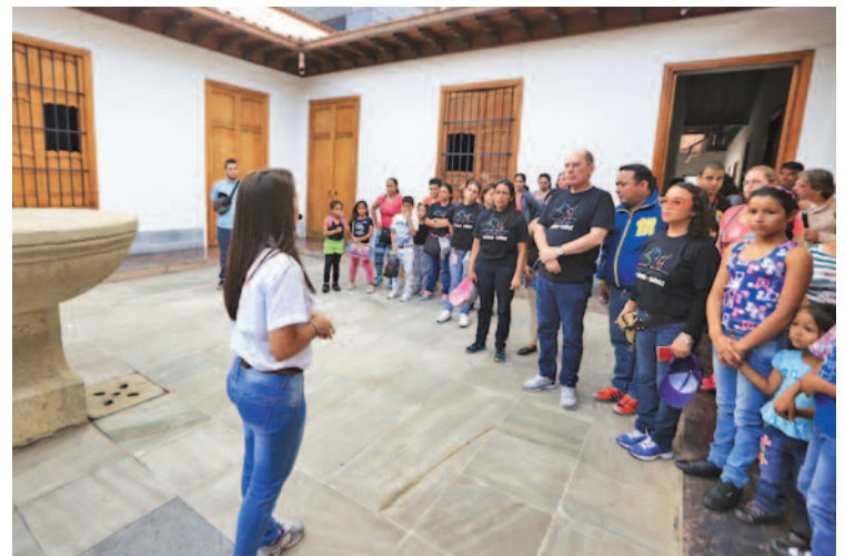
Casa de Bolívar