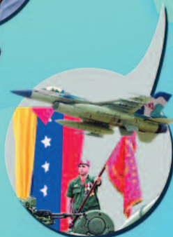
SEGURIDAD Y DEFENSA