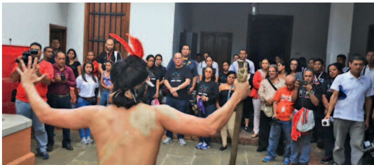
La verdadera historia de la conquista