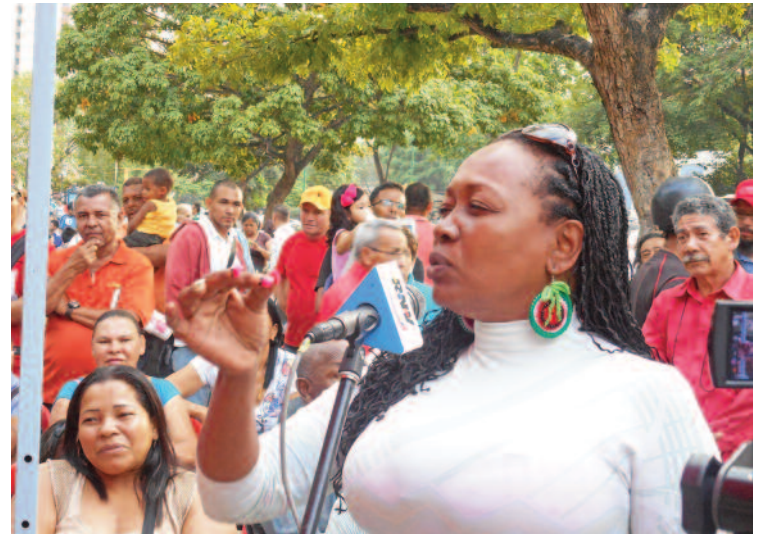
Los consejos comunales participaron