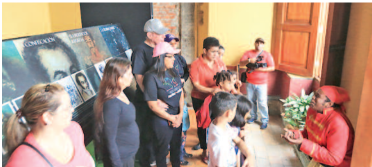
Los negros lucharon por la independencia