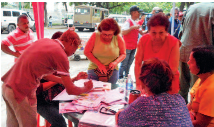
Firmas por la paz