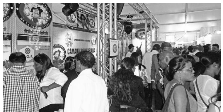
Gran afluencia los 3 días de feria