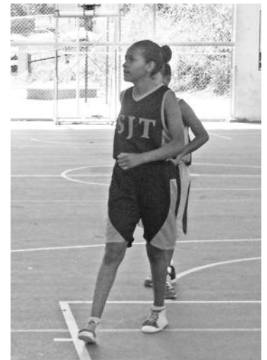
La formación de las niñas también es parte de la escuela Mundo Deportivo