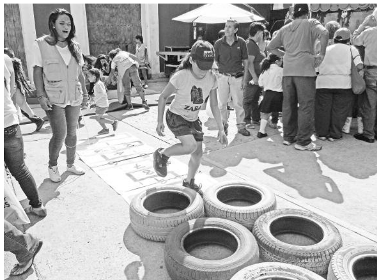
Los niños disfrutaron de juegos didácticos

Expo Caracas reunió a más de 170 productores con la participación de diferentes bandas musicales, entre quienes destacan la Billos Caracas Boys, Los adolescentes y grupos del folclor nacional. La expo Caracas 2015 se realiza entre el 29 al 01 de noviembre.