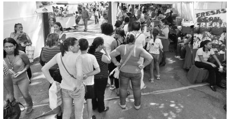
La Plaza El Venezolano muy concurrida