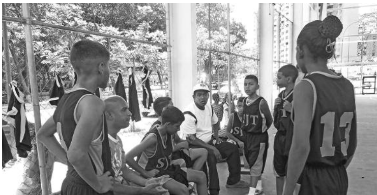
Los coordinadores comunitarios participan en la enseñanza de los infantiles