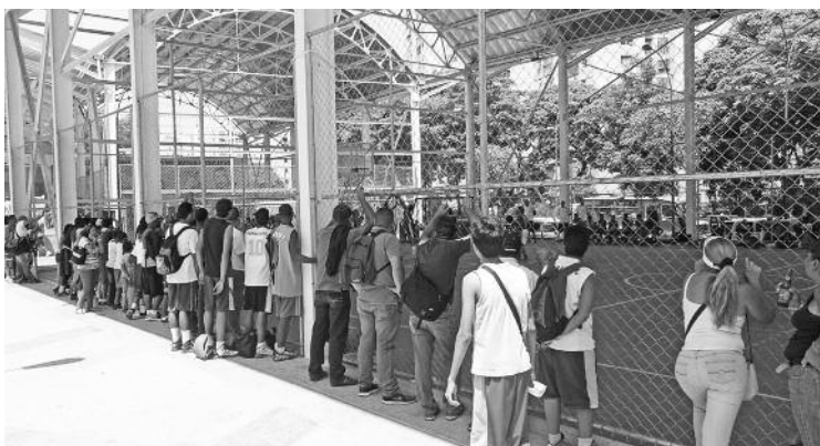
Los vecinos disfrutaron de las competencias deportivas