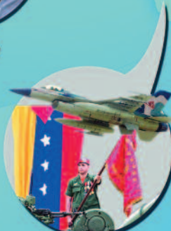
SEGURIDAD Y DEFENSA