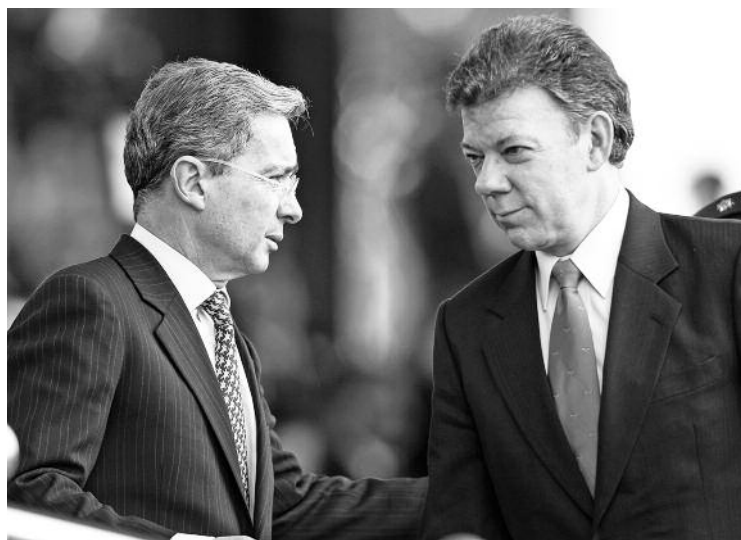
Santos y Uribe, caimanes de un mismo pozo