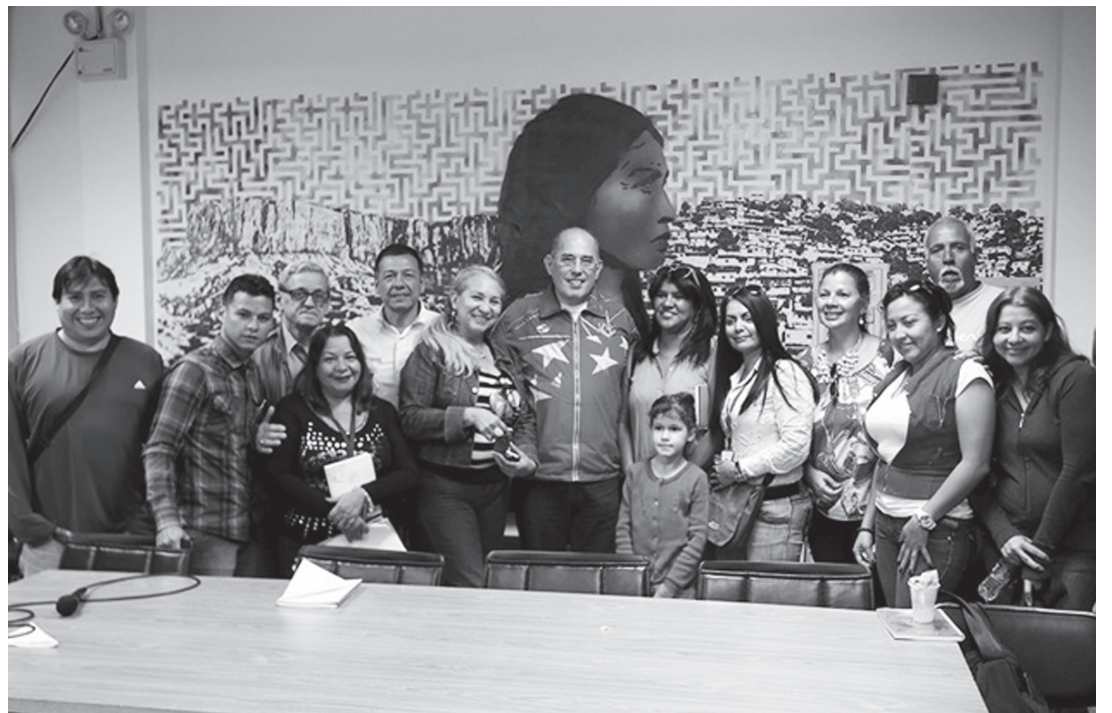
Medios alternativos y comunitarios de la Gran Caracas se reunieron con el Jefe de Gobierno del Distrito Capital

dadera posición socialista, que los medios alternativos y comunitarios (MAC) somos la comunidad y el pueblo comunicador por tanto, sabemos, sentimos y vivimos día a día, las colas para comprar alimentos y demás bienes de primera necesidad, repudiamos el bachaqueo, y estamos en capacidad de hablarle al pueblo la verdad así como estamos preparados para dar la batalla comunicacional. Las reuniones proseguirán con miras a consolidar un Plan de Acción para combatir desde nuestras trincheras la nefasta Guerra económica y todas las Guerras que ha instaurado la derecha nacional e internacional.