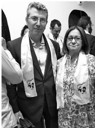
La Ministra Desirée Santos Amaral y embajador del Líbano

El pasado 14 de agosto, se realizó el acto de conmemoración de la victoria del 14 de agosto de 2006 del pueblo del Líbano sobre la agresión israelí-estadounidense, en la llamada Guerra de los 33 días.