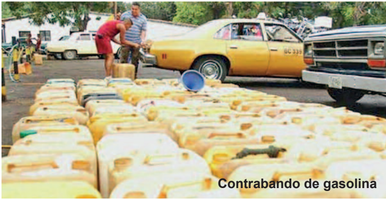
Contrabando de gasolina