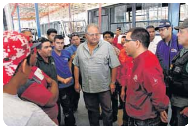
Encuentro del vicepresidente, Jorge Arreaza, con empresarios y trabajadores en Táchira