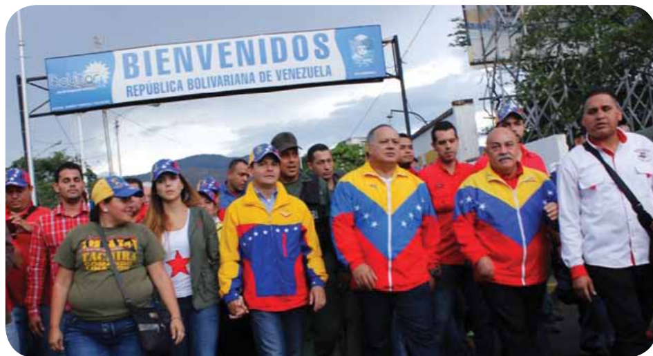
Recorrido de diputados de la AN y el gobernador del Táchira en el puente internacional en la frontera colombo-venezolana