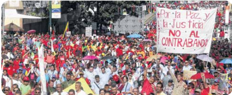
El pueblo venezolano pide paz, justicia y rechaza el cotrabando de productos en las zonas fronterizas

La orquestación de una guerra mediática internacional contra el Gobierno Bolivariano no se hizo esperar en estas circunstancias. Los medios de comunicación de distintos países (Colombia, EEUU, España, entre otros) se hicieron eco de una sistematización de comunicados internacionales para empañar la imagen del Ejecutivo nacional y preparar el escenario (la opinión pública y los ánimos) para un ataque posterior contra Venezuela, mediante las sanciones que esperarían que se logren.