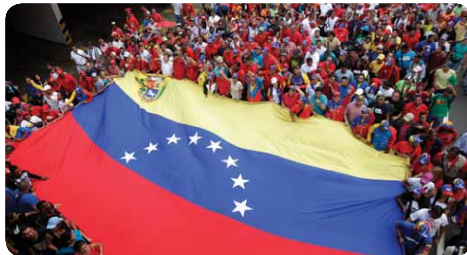
El 28 de agosto de 2015 una marcha multitudinaria celebrada en Caracas dio apoyo a las medidas de cierre temporal de la frontera tomadas por el Ejecutivo Nacional