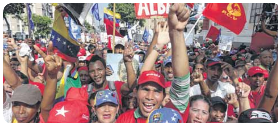
El presidente Nicolás Maduro ratificó ante el pueblo las políticas de saneamiento y orden necesarias en la frontera colombo-venezolana, el 28 de agosto de 2015