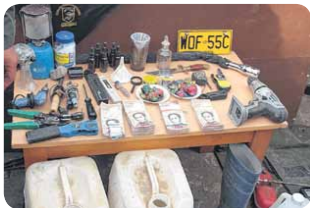
En las OLP especiales realizadas en Táchira, se incautaron materiales de uso paramilitar

En declaraciones recientes, el mandatario venezolano, Nicolás Maduro, sentenció: "Se le ha planteado al Gobierno de Colombia que hasta tanto no controle y prohíba la circulación y la venta de los productos venezolanos sacados por los contrabandistas, no voy a abrir esa frontera, y aquí lo ratifico, no y no. ¡Ya basta! ¡Fuera el paramilitarismo colombiano de Venezuela!"