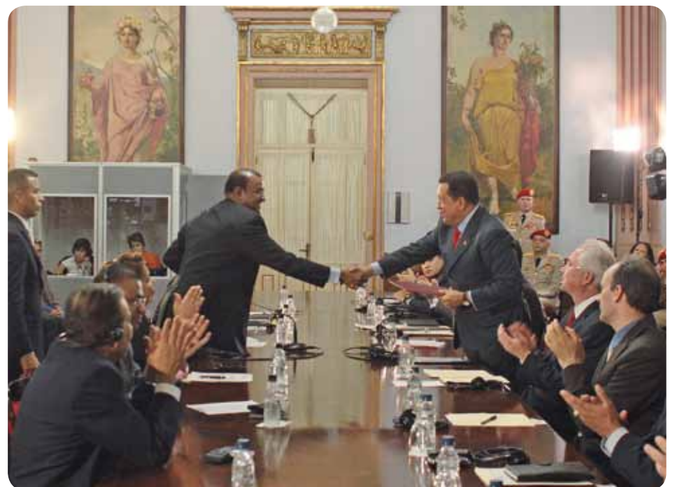
Chávez fortaleció las relaciones con Guyana a través de acuerdos de cooperación, como Petrocaribe

inició nuevamente el camino de las negociaciones para el arreglo práctico de dicha controversia territorial pendiente, para que se resuelva de forma amistosa y pacífica.