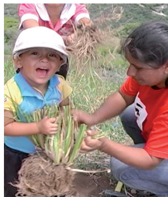
De Vuelta al Conuco