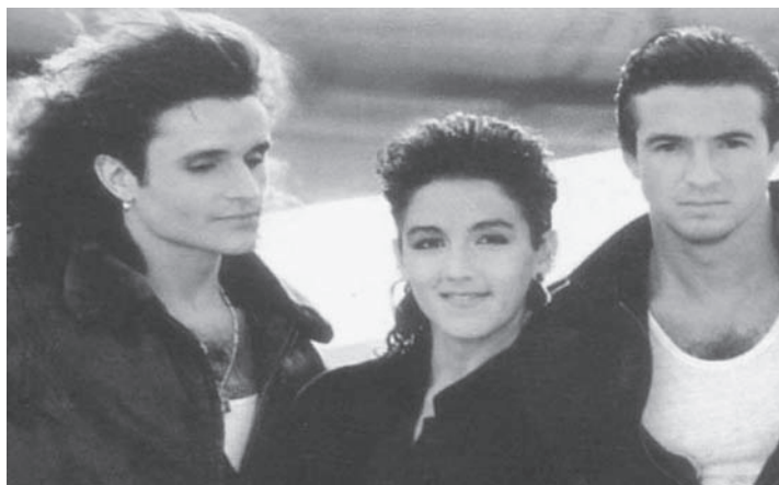
MUJER CONTRA MUJER DE MECANO

"Yo no soy esa que tú te imaginas una señorita tranquila y sencilla que un día abandonas y siempre perdona esa niña sí, no, esa no soy yo. Yo no soy esa que tú te creías la paloma blanca que le baila al agua que ríe por nada diciendo sí a todo esa niña sí..no.. esa no soy yo".