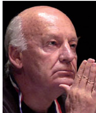
Eduardo Galeano y las mujeres