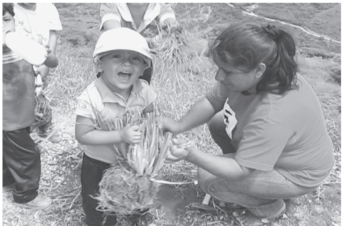
Miles de manos plantando un árbol pueden salvar al planeta

Surgida a finales del siglo XX, la praxis del Ecosocialismo es una respuesta democrática, ideológica y conservacionista, que ataca la gran impunidad ambiental que se padece en todo el Mundo, debido al canibalismo corporativo que NO se cansa de irrumpir, explotar y rentabilizar toda la nobleza de la Pachamama, a cambio de recibir toda la sangre del dinero ecocida. De allí, que se busca replantear la interacción del Hombre con el Medio, pues debe existir un marco de responsabilidad social entre los gobiernos, los organismos públicos, privados y la ciudadanía. Así, es posible crear estrategias mancomunadas que generen fuentes de empleo y mejoren la calidad de vida en las personas, quienes operan como agentes de cambio dentro de sus comunidades. (carlosfermin123@hotmail.com-http://ekologia.com.ar/)