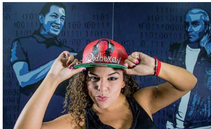
Rodbexa Poleo Circuito 3 del Distrito Capital Parroquias San Bernardino, El Recreo, San José, Candelaria, San Agustín y San Pedro