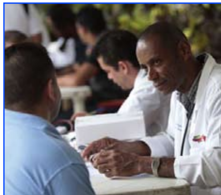
Caracas, 18 Abr.

Médicos Integrales Comunitarios (MIC) y Médicos Generales Integrales (MGI) participaron este sábado en el Primer Encuentro Nacional de Medicina Integral, donde discutieron sobre aspectos relacionados con el fortalecimiento de la conciencia médica revolucionaria.