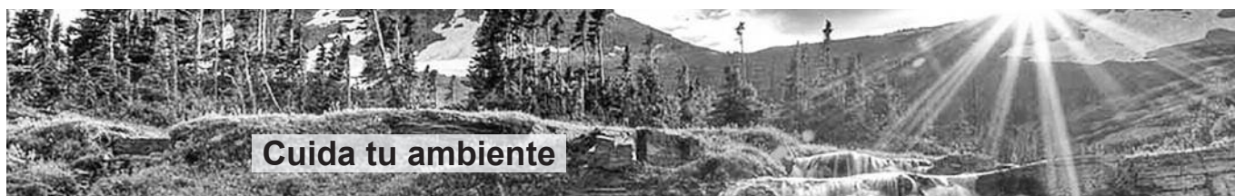
Cuida tu ambiente