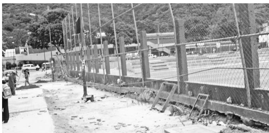
Se mejorara la protección del campo deportivo