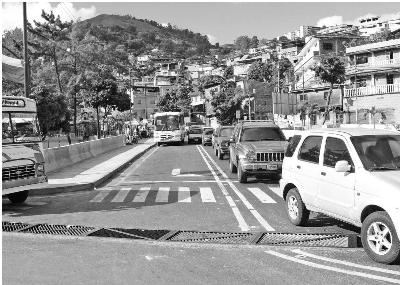
Puente La Sosa solución vial P 4-5