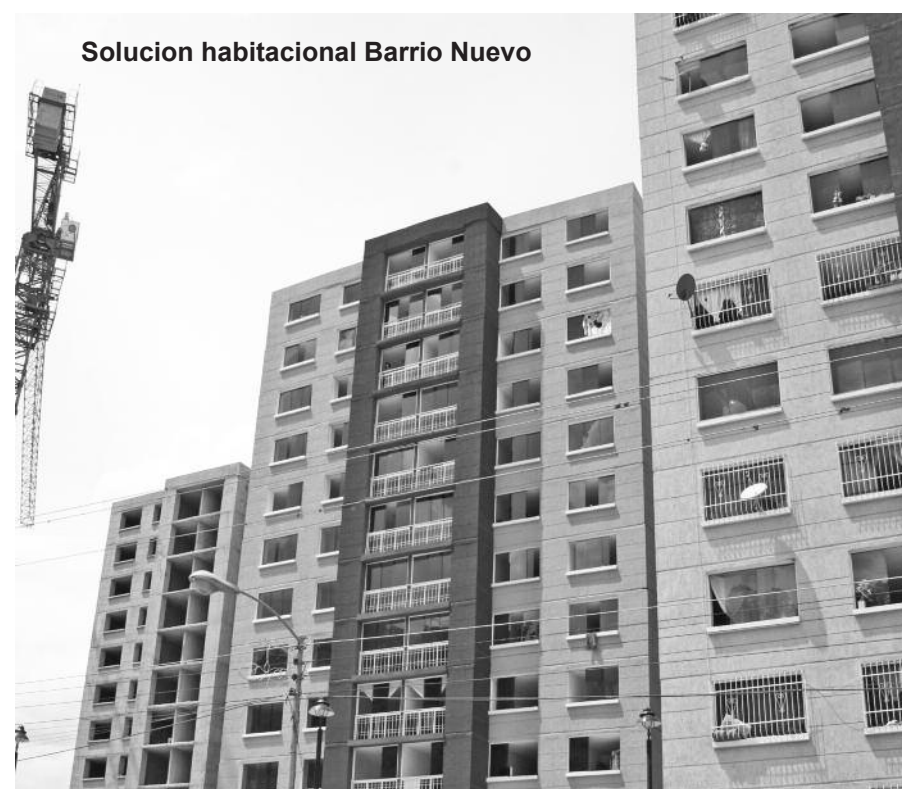
Solucion habitacional Barrio Nuevo