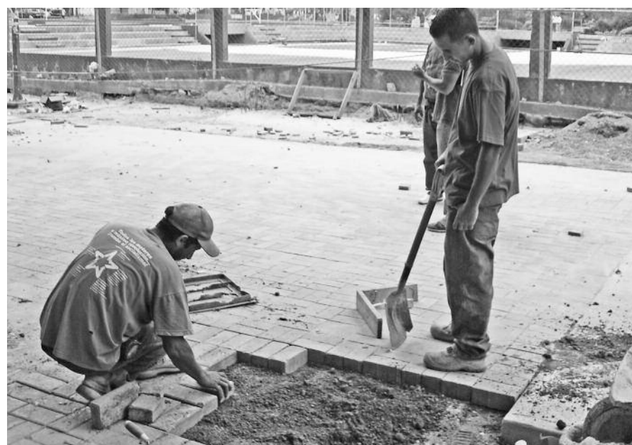
Colocación de adoquines