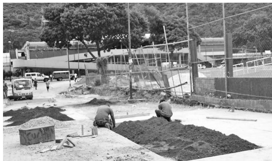
Vaciado de concreto