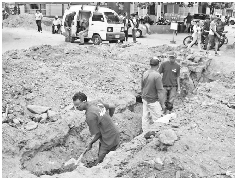
Texto y foto Yetsi Villalonga