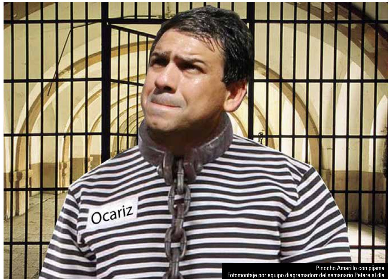
Pinocho Amarillo con pijama