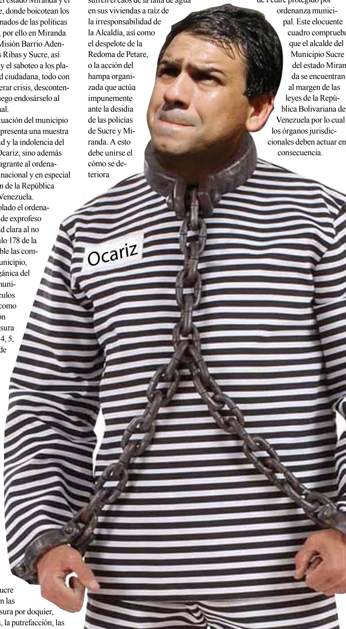
Pinocho Amarillo con pijama Fotomontaje por equipo diagramador del semanario Petare al día

progresivamente el casco histórico de Petare protegido por ordenanza municipal. Este elocuente cuadro comprueba que el alcalde del Municipio Sucre del estado Miranda se encuentran al margen de las leyes de la República Bolivariana de Venezuela por lo cual los órganos jurisdiccionales deben actuar en consecuencia.