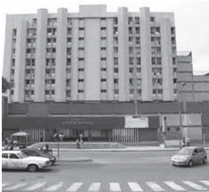
Panorámica del Hospital Victorino Santaella

La Fisiatría o Medicina Física y Rehabilitación es la especialidad que se encarga del tratamiento y seguimiento de personas con enfermedades del sistema esquelético, muscular y neurológico, que produzcan dolor o limitación funcional.