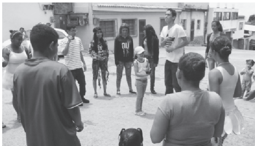
Los recreadores en plena actividad con la comunidad

El Día del niño y la instalación de un Mercal, son las más destacadas