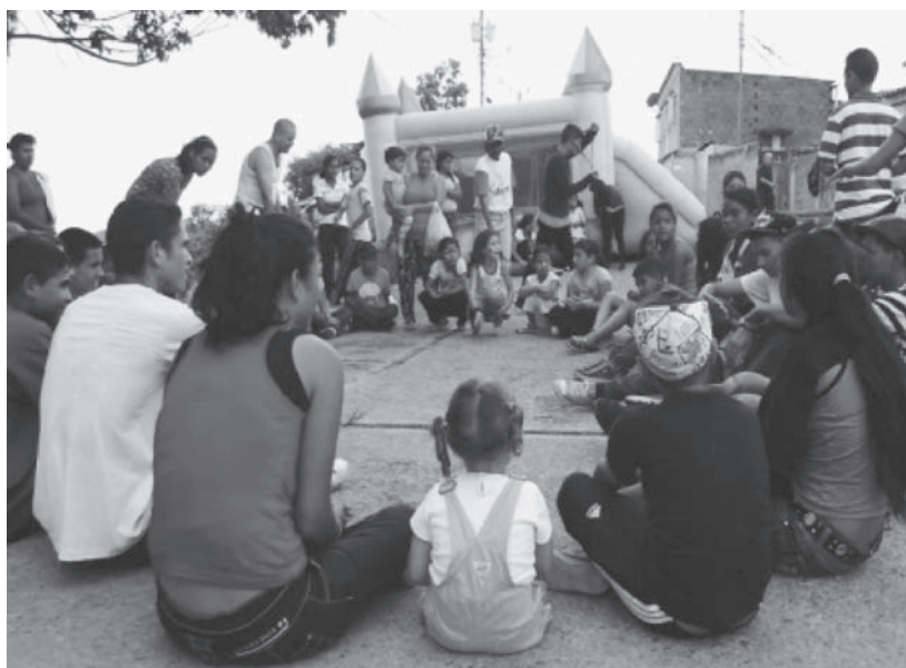
Las yincanas y el colchón fueron las atracciones del día

La comunidad hacen llegar un especial agradecimiento a las personas que colaboraron