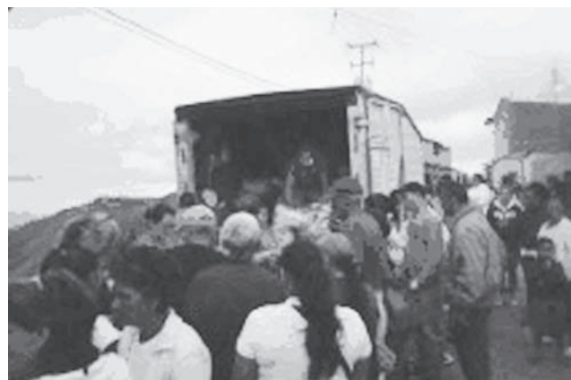
Más de media tonelada de alimentos fue expendida en la actividad