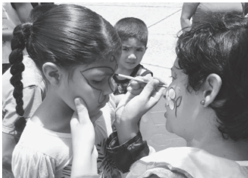
Los más pequeños disfrutaron de sus pintas caritas