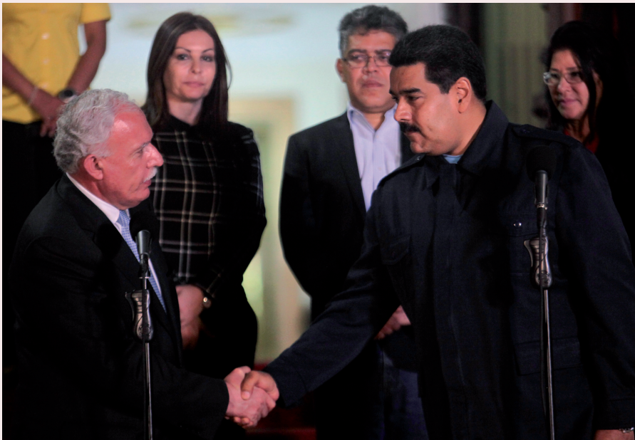
Riad al Malki, ministro de Relaciones Exteriores palestino durante su visita a Venezuela

“El imperio mostrará en las próximas décadas su rostro más tremendo y llegará a cometer dentro de su escalada de destrucción y muerte, errores que terminarán por sepultarlo”. Así lo sentenciaba en una de sus tantas alocuciones, fundamentales para la batalla de ideas, el comandante Fidel Castro en 2003. Como siempre, Fidel no se ha equivocado en la ferocidad imperialista. Basta recordar todo lo ocurrido en los últimos años en Irak, Afganistán y