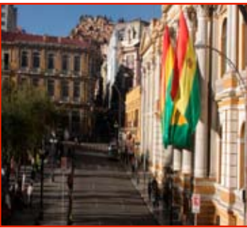
Caracas, 31 May.