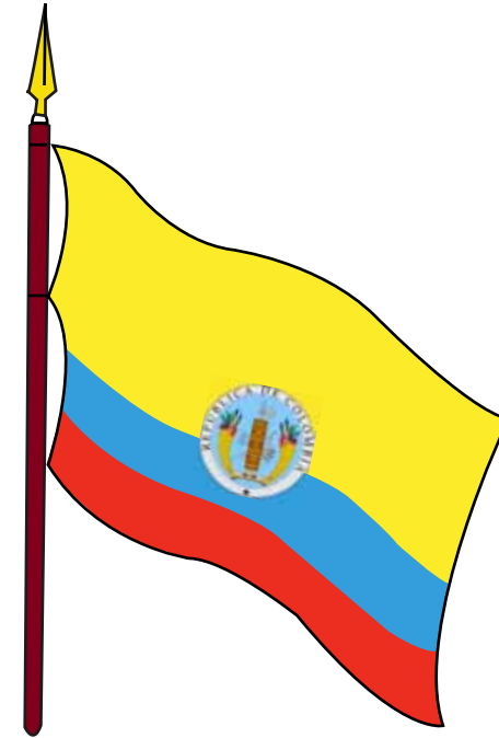
BANDERA DE LA REPÚBLICA DE COLOMBIA