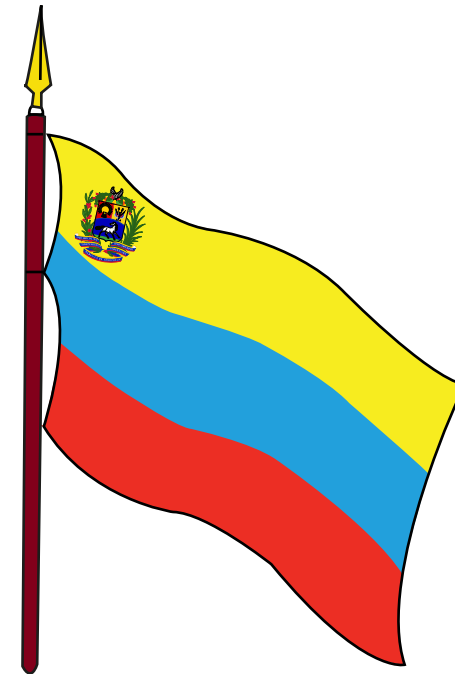
BANDERA DE FRANJAS IGUALES

Con la aparición de esta bandera, engalanando las alboradas de la República, surgen dos nuevos elementos: por primera vez las tres franjas presentan el mismo diámetro y, además, hace su aparición el escudo de armas, muy similar al actual.