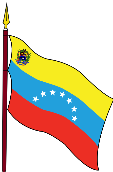
BANDERA NACIONAL ACTUAL 15 DE JULIO DE 1930