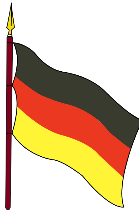
BANDERA DE MIRANDA PROYECTO DEL EJÉRCITO COLUMBIANO 1800

Presenta tres franjas paralelas e iguales, con los colores negro, encarnado y amarillo, los cuales representan las razas de negros, pardos e indios, sobre cuya igualdad habría de estructurarse el ejército del Generalísimo.