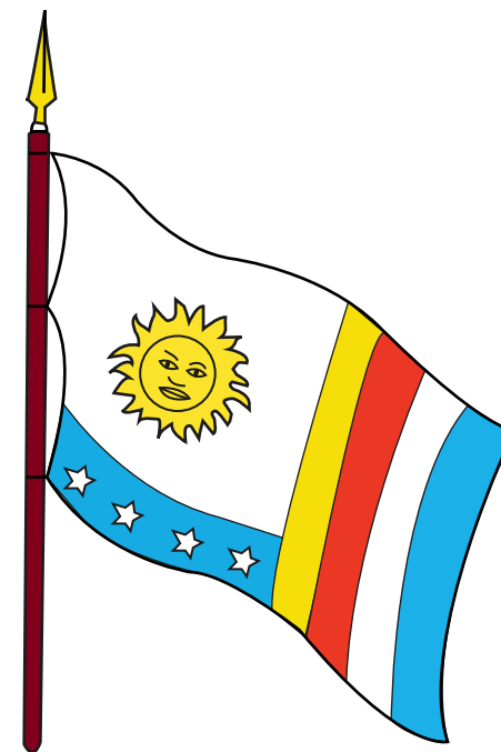
BANDERA DE GUAL Y ESPAÑA

Y las cuatro franjas verticales de color amarillo, rojo, blanco y azul representan la unión de las razas de indios, negros, blancos y pardos, y los fines políticos del Movimiento: Igualdad, Libertad, Propiedad y Seguridad.