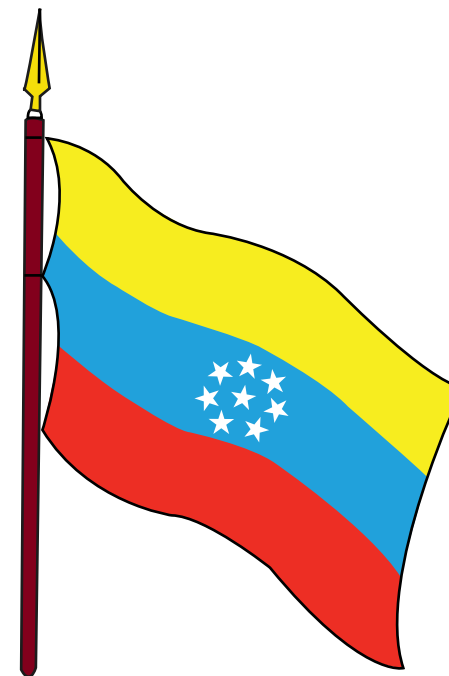
BANDERA DECRETADA POR EL GENERAL JUAN CRISÓSTOMO FALCÓN 29 DE JULIO DE 1863

Es importante destacar el cambio en el color de las estrellas, originalmente azules y ahora blancas, por la simple lógica del efecto artístico del contraste.