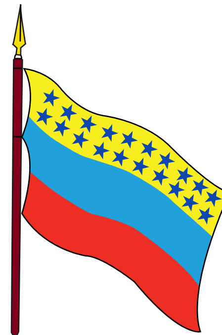
BANDERA DE LA FEDERACIÓN BARINAS, JUNIO 1859