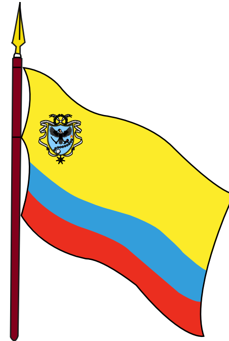
BANDERA DE LA GRAN COLOMBIA 4 DE OCTUBRE DE 1821

El escudo de la Nueva Granada, enmarcado por un cuartel, lleva en su parte superior un cóndor, símbolo de la soberanía, el cual toma con su garra izquierda una granada y con la derecha una espada. Sobre la cabeza del cóndor, una corona de laureles de la cual emergen dos cintas que flanquean el cuartel y se unen en su extremo inferior con la estrella de los libertadores, llevando el lema: Uixit et uincit et amore patriæ . En la parte inferior, una luna llena aparece a la vanguardia de una columna de diez estrellas.