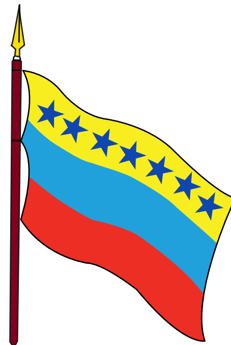
BANDERA DE LA FEDERACIÓN CORO, FEBRERO 1859

Dado en Coro, a 25 de Febrero de 1859, Año 1 de la Federación.