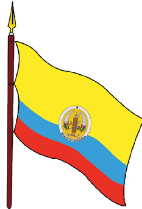
BANDERA DE LA REPÚBLICA DE VENEZUELA

Las cornucopias volteadas parecían entonces anunciar la época que estaba comenzando, con sus tragedias sociales, políticas y económicas, cuyos vientos huracanados marcaron el nacimiento de la República.