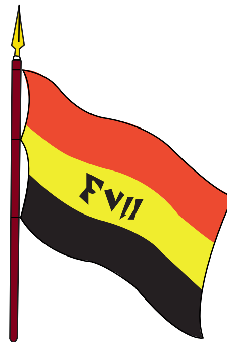
CUCARDA DE LOS REVOLUCIONARIOS

Esta cucarda, convertida posteriormente en bandera, refleja el fin político del momento: la adhesión a la autoridad del rey de España, prisionero para entonces de Napoleón Bonaparte.