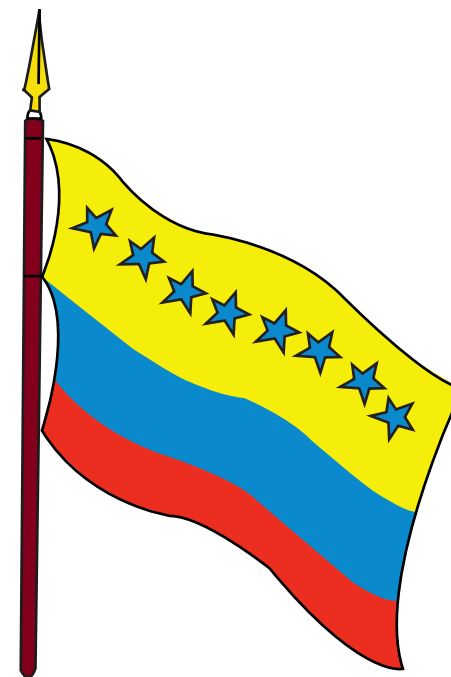
BANDERA DE ANGOSTURA 20 DE NOVIEMBRE DE 1817

Dado, firmado de mi mano, sellado con el sello provisional del Estado y refrendado por el Secretario del Despacho, en el Palacio de Gobierno de la ciudad de Angostura, a 20 de noviembre de 1817 – 7°.