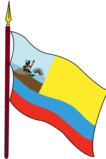
BANDERA DE LA INDIA 1811

La utopía de Colombia la Grande apareció en este pabellón que sería bautizado con sangre en los encarnizados combates de la Primera República.