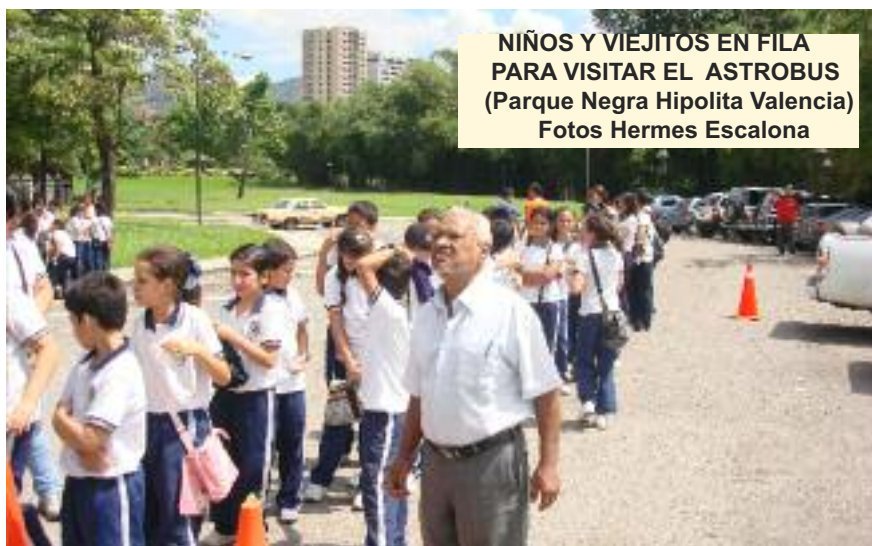
NIÑOS Y VIEJITOS EN FILA PARA VISITAR EL ASTROBUS (Parque Negra Hipólita Valencia)