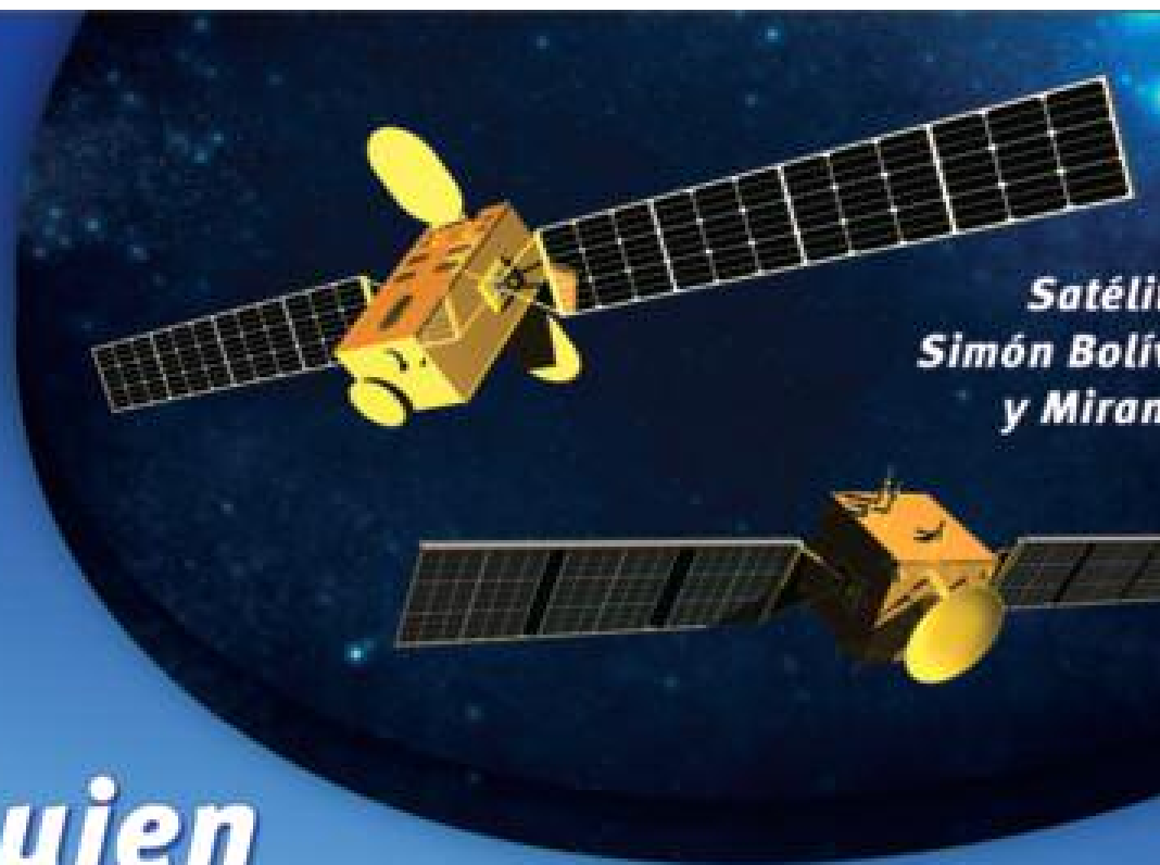
Satélite Simón Bolívar y Miranda