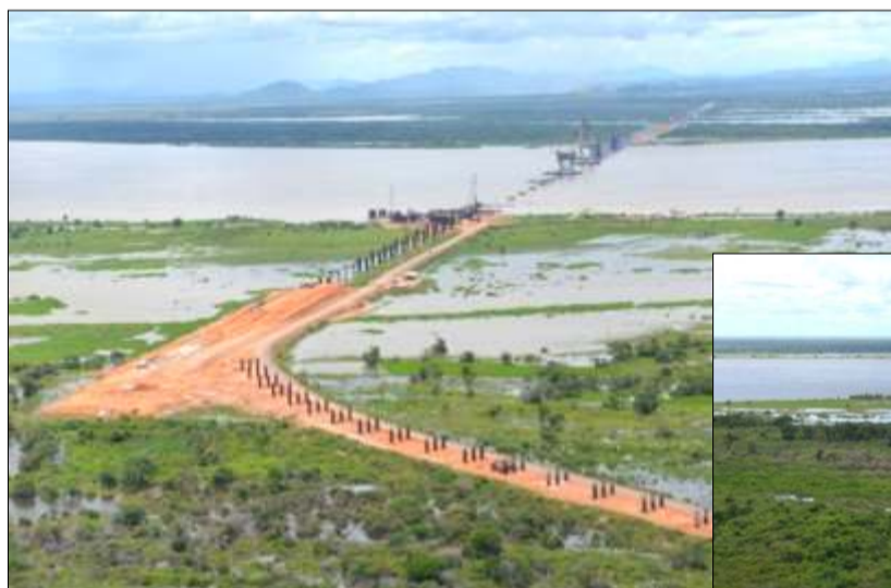
Vista General desde Rampa de Lanzamiento Norte