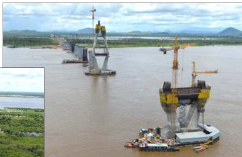
Vista General de Pilas Norte y Sur