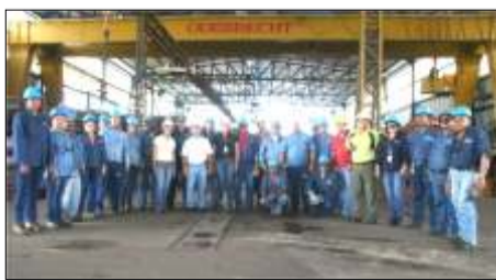
Equipo humano responsable que labora en Taller de Camisa

En estos últimos años del nuevo ciclo de desarrollo de estas dos importantes comunidades, la participación de Odebrecht internacional en la construcción del Tercer Puente ha cambiado la realidad de los habitantes de toda la región suroeste del país. Uno de estos escenarios es el TALLER DE ESTRUCTURAS METÁLICAS, mejor conocido como TALLER DE CAMISA, en donde se han especializado y tecnificado mano de obra netamente corobera y de comunidades aledañas.