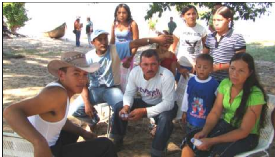
Habitantes de la comunidad de Capuchinos, del estado Bolívar