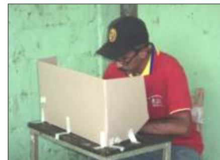
En las votaciones participaron 49 de los 70 miembros activos.

De esta forma, la nueva junta directiva se comprometió a continuar fomentando la cultura en el municipio, fortaleciendo y consolidando las bases de la organización, centrados en la creación de conciencias que contribuyan a la transformación de todas las expresiones culturales, “construyendo un verdadero socialis-