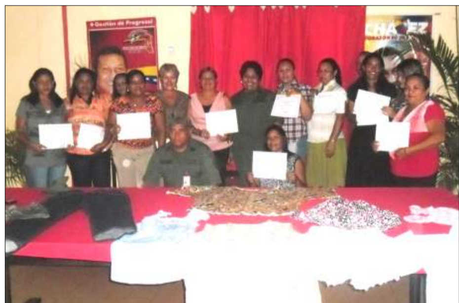
25 mercedenses recibieron certificado de culminación del curso de corte y costura.