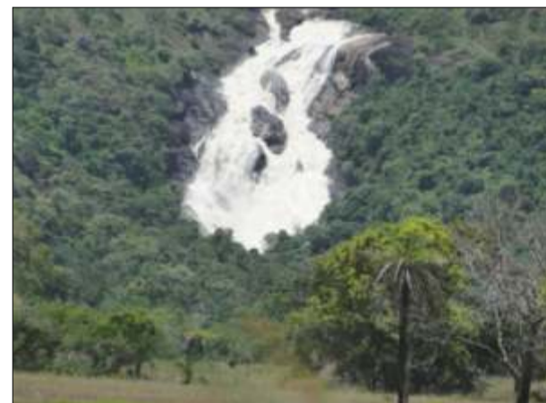
Salto Chaviripa, estado Bolívar

Con el pasar de los años esta leyenda se fue transmitiendo de generación en generación, pasando así al pueblo criollo, que se formó con el encuentro de dos mundos. Chaviripa se convirtió en un paisaje eterno, visualizado por los turistas cuando van a Pijiguaos y Maniapure es una referencia obligada para los viajeros que van hacia el pueblo de la urbana. Chaviripa es historia viva, fue el nombre de