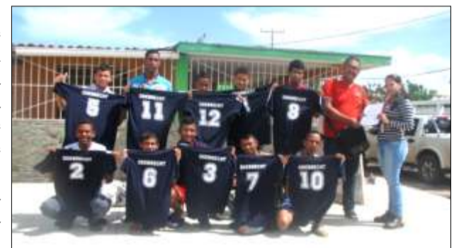
Uniformes de futbol sala otorgados por Odebrecht para los chicos.

Durante el mes de agosto se realizó el aporte de veinticuatro (24) uniformes de fútbol sala con su respectiva dotación, doce (12) para el C.C. la Teja II de Caicara del Orinoco, y doce (12) para el Consejo Comunal de la Urbanización