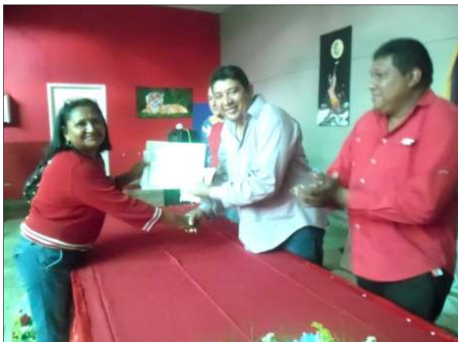
Los vencedores y vencedoras recibieron sus títulos de bachiller de las manos de autoridades municipales, entre ellas el presidente de la Cámara Municipal Elías Zurita.

Los sueños del comandante supremo de la Revolución: Hugo Chávez Frías, continúan cristalizándose en todo el municipio.