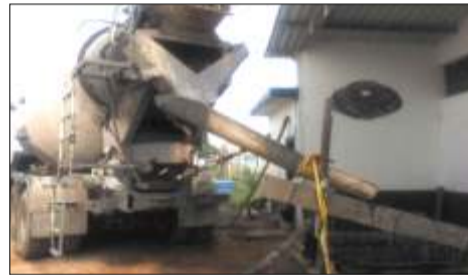
Momentos cuando es vaciado el Concreto para el tanque de agua de la UNEG

La empresa Constructora Norberto Odebrecht a través del departamento de Responsabilidad Social realizó la entrega y donación de concreto para la construcción de un tanque de agua en la Universidad Experimental de Guayana sede Caicara del Orinoco del municipio Cedeño, estado Bolívar.