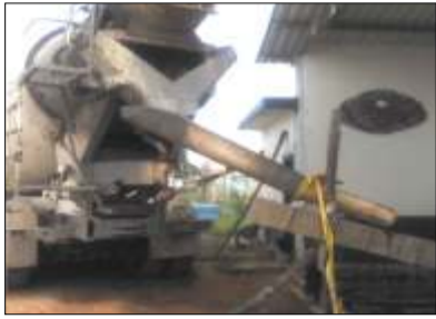
Momentos cuando es vaciado el Concreto para el tanque de agua de la UNEG

Responsabilidad Social Odebrecht donó concreto a Sede de la UNEG de Caicara. /5