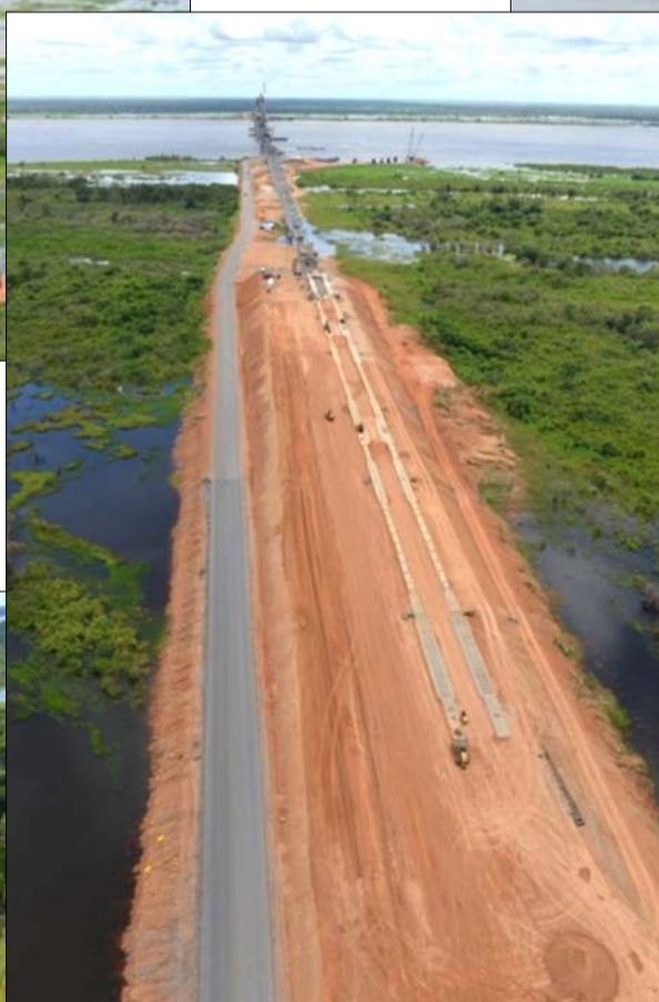
Vista General Rampa de Lanzamiento Sur