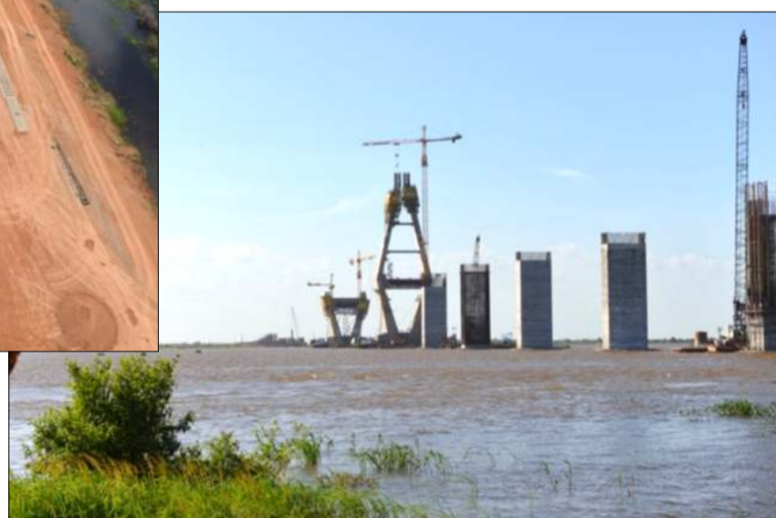
Vista General Pilas en río