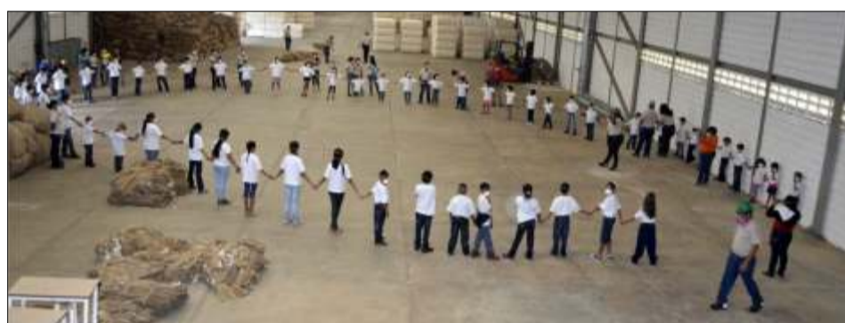
Entretimiento para los pequeños invitados al Plan Vacacional

Este plan vacacional combinó diversión y aprendizaje para los pequeños que se hicieron sentir en cada rincón de la empresa, conocieron el proyecto donde sus padres y madres laboran día a día, y los que hacen posible la continuación del mismo.