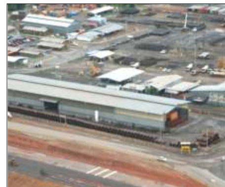
Vista General del Taller donde se fabrican las Camisas.

Uno de los grandes desafíos de esta magnífica obra fue surcar e hincar pilotes en uno de los ríos más caudalosos del mundo, fue a través de un complejo sistema de perforaciones de hasta 90 metros de profundidad, y con un amplio despliegue laboral hombre y máquina se alcanzaron las operaciones de hincado y perforación de pilotes en río. Más allá de los innumerables procesos de elaboración y construcción de las distintas áreas de la obra, están cientos de mujeres y hombres que han materializado y cristalizado sus sueños, su expectativa y calidad de vida, convirtiendo este visionario Proyecto en un Puente de Oportunidades en el corazón de Venezuela, un Proyecto de encuentro entre dos territorios: el Tercer Puente sobre el río Orinoco, con más de 11 kilómetros de modalidad (carretero, ferroviario y fluvial, que contará con dos torres principales atirantadas con de más 135 metros de altura, con una estructura arquitectónica en forma