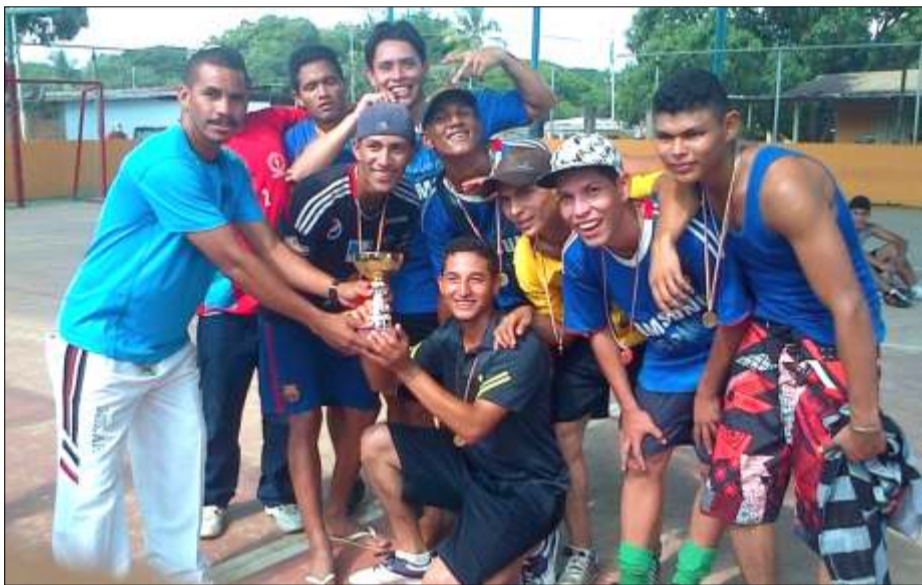
1er lugar en Fútbol Sala, categoría 15-17 años