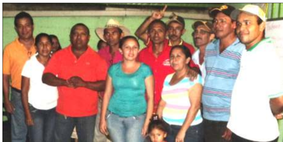
Nueva Junta directiva de la Unión de Folkloristas en el municipio Las Mercedes del Llano

Las votaciones se realizaron democráticamente, en armonía y hermandad, con la participación de 49 de los 70 miembros activos, cumpliendo así con sus estatutos reglamentarios.