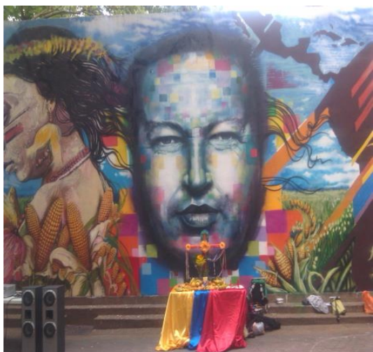
Foto: Cyrana - Mural pintado por estudiantes revolucionarios de Unearte

Con motivo de su nacimiento el 28 de julio, recordando al Comandante Hugo Chávez