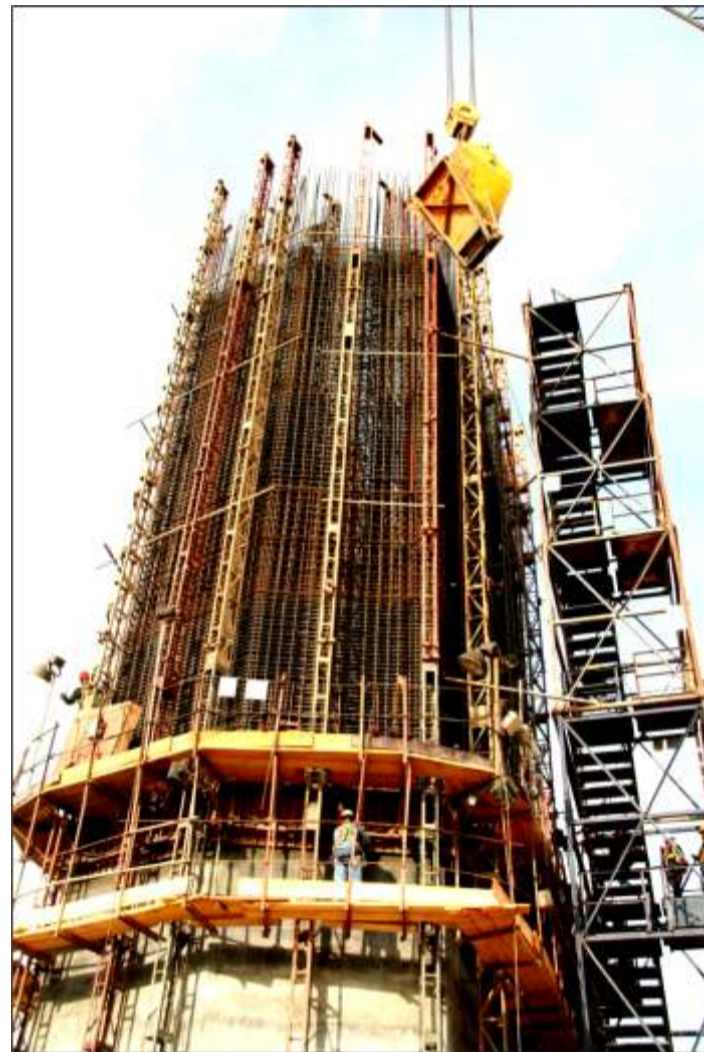
Vista en detalle del vaciado de pilas

Actualmente en la obra Tercer Puente sobre el río Orinoco se ha ejecutado el vaciado de pilas del acceso 2 metálico sur, bifurcación, pilas del río 5 y 8 del lado sur; contabilizando de esta mane-