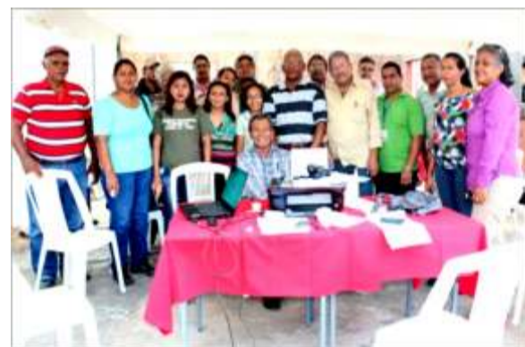
Voceros y voceras de Medios de Comunicación Comunitarios de Amazonas, Bolívar y Guárico, con el apoyo al Manifiesto

Medio Alternativo Digital Blog Mágica FM, Twiteros Revolucionarios de Amazonas, Circuito Patria, Red de Comunicadores Alternativos y demás exponentes de la Comunicación Alternativa y Popular en estos estados, que se suman a suscribir el presente Manifiesto.