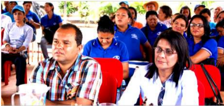
Profesores y cursantes de la Maestría en Educación Mención Desarrollo Comunitario de la UNERG

Esta segunda cita, correspondiente a las Primeras Jornadas de Encuentros Comunitarios “Dr. Pedro Escobar” se desarrolló el pasado 28 abril 2013 en la población de Santa Rita de Manapire. En donde se aplicó en el sector Los Mangos el método etnográfico de parte de estudiantes de Maestría en Educación de la UNERG.