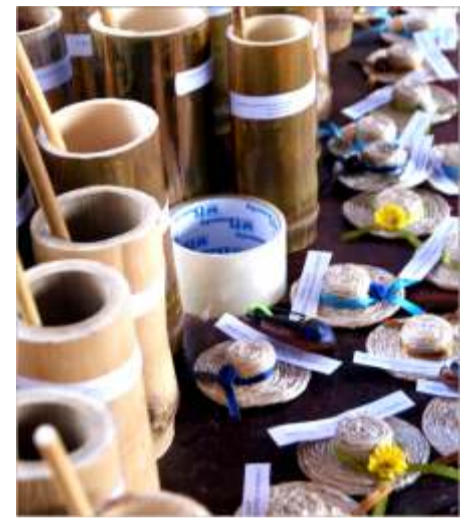
Artesanía propia del sector Los Mangos

Agradecemos a la familia Suárez y la familia Vargas, por su receptividad, permitiéndonos la convivencia en sus hogares, facilitando sus conocimientos para nuestro aprendizaje. También agradecemos a los profesores por las experiencias que vivimos, en la interacción con la comunidad, rompiendo paradigmas en las estrategias de aprendizajes.