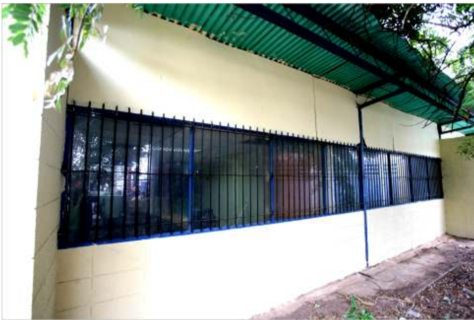
Sustitución de rejas, puertas y techo del Ministerio del Poder Popular Para la Agricultura y Tierras.

En la misma sede funcionan varias oficinas y dependencias de organismos adscritos (FONDAS, INIA, INSAI, CIARA) que también están siendo acondicionadas.