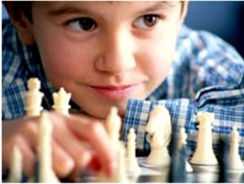
En plena acción preparatoria para estar a la altura en eventos de importancia

Desde el 26 del mes de Enero del 2013 se han realizado los preparativos en cuanto al entrenamiento duro por el equipo ajedrecístico infantil de la población de Cabruta que saldrá el martes 07 del mes de Mayo 2013 para San Juan de los Morros a luchar codo a codo con los talentos de los 15 municipios del estado Guárico que definirá al campeón Estatal 2013, dicho evento cuenta con una plantilla de 100 participantes el cual a demás desig-nará cupos directos a los 5 mejores al campeonato Nacional que se llevará a cabo en Mérida a finales de Año. El equipo estará integrado por: