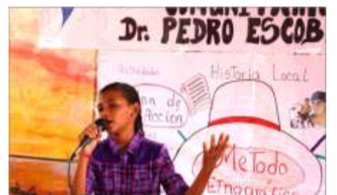
Las niñas y niños mostraron sus valores artísticos