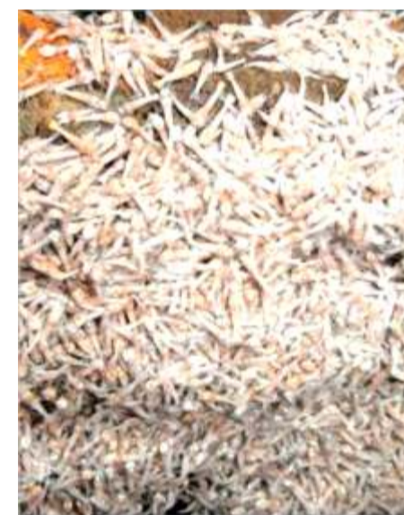
Vida en las fumarolas ardientes de las profundidades del Mar Caribe

Tanto unos como otros están preparando nuevas expediciones que esperan llevar a cabo antes de 2013 con vehículos de control remoto capaces de sumergirse hasta 6.000 metros de profundidad.