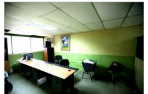
Sede de las dependencias agrícolas en recuperación, en la comunidad de Cabruta estado Guárico.

Como es sabido dichas oficinas se encontraban en franco deterioro y en atención a solicitud del sector agrícola de la comunidad de Cabruta, se logró la recuperación no solo de la infraestructura del Ministerio de Agricultura y Tierras (MAT), sino el Fondo para el Desarrollo Agrario Socialista (FONDAS), Instituto Nacional de Investigaciones Agrícolas (INIA), Instituto Nacional de Sanidad Agrícola Integral (INSAI) y La Fundación de Capacitación e Innovación para Apoyar la Revolución Agraria (CIARA).