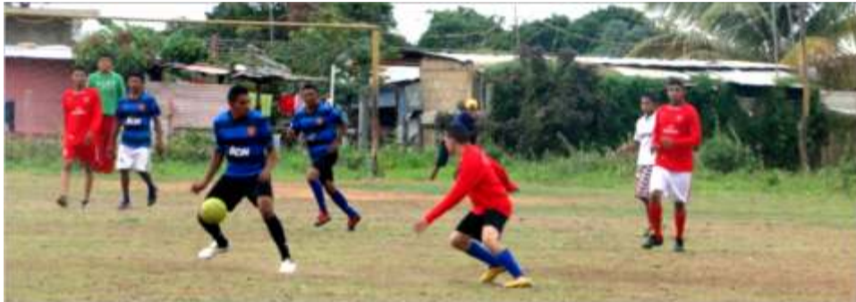
TABLA DE POSICIONES