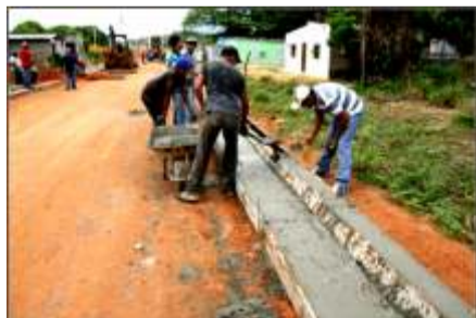
Más de 1000 metros lineales de concreto por parte de la empresa Odebrecht se colocaron en la comunidad de Jusepa.

En un esfuerzo conjunto la empresa Constructora Norberto Odebrecht, los consejos comunales y la Alcaldía del municipio Cedeño, hicieron posible la gestión para la construcción de cunetas y brocales para las principales calles de Jusepa, uno de los sectores más populosos de Caicara del Orinoco.