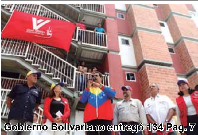
Gobierno Bolivariano entregó 134 Pag. 7