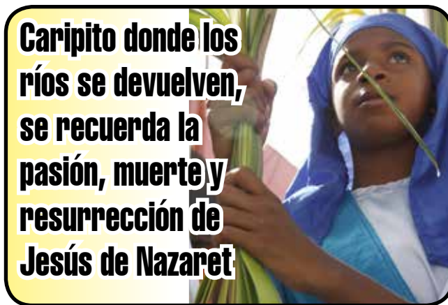
Caripito donde los ríos se devuelven, se recuerda la pasión, muerte y resurrección de Jesús de Nazaret