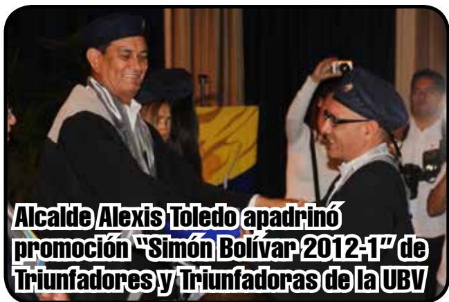
Alcalde Alexis Toledo apadrinó promoción "Simón Bolívar 2012-1" de Triunfadores y Triunfadoras de la UBV