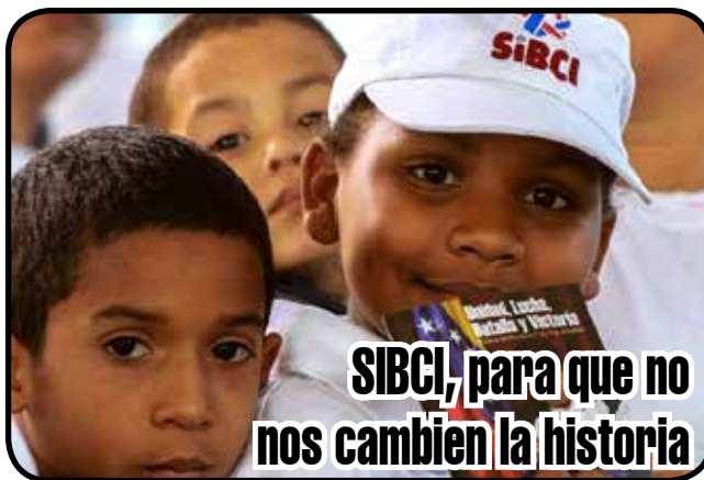
SIBCI, para que no nos cambien la historia