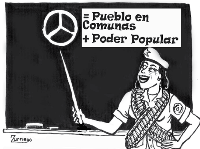
La Escuela para el Fortalecimiento del Poder Popular, reiniciara en breves días su ciclo de formación y orientación a nivel comunitario. Un grupo de mujeres y hombres que son la verdadera expresión del sentir revolucionario en su cátedra y vida personal, estarán tomando el mando ductivo para benéfico de los que sí, adoramos vivir en socialismo.

Es triste, el militante sentido de este proceso, ve como estas acciones y estos funcionarios acaban con el ideal revolucionario y nos ocasiona merma en las elecciones ¿pero será que no hay quien les ponga un parao?