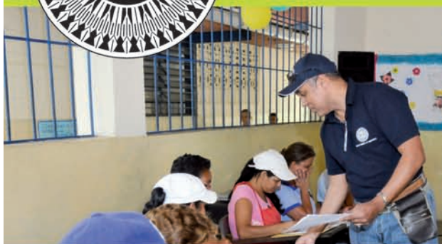
Escuela Básica Nacional El Pardillo, Carayaca, estado Vargas.