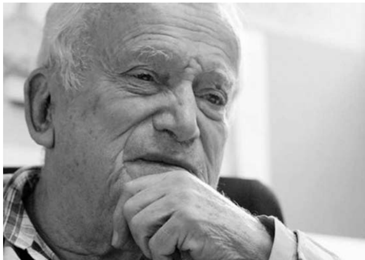
Vivas: “Se le dio el nombre de la Flor de los Cuatro Elementos y fue elaborada con una velocidad extraordinaria” en dos días, reiteró.

El reconocido arquitecto Fruto Vivas, uno de los venezolanos más reconocidos en su área, explicó cómo él y un equipo de más de 70 personas construyeron en menos de dos días la hermosa Flor de los Cuatro Elementos, monumento en el cual reposan los restos del Comandante Hugo Chávez en el Cuartel de la Montaña, Museo Histórico de la Revolución en el 23 de Enero. También construyeron en cuatro días la capilla en el Hospital Militar, donde fueron hechas