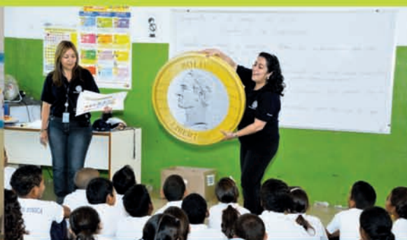
Escuela Nacional de Naiguatá, estado Vargas.