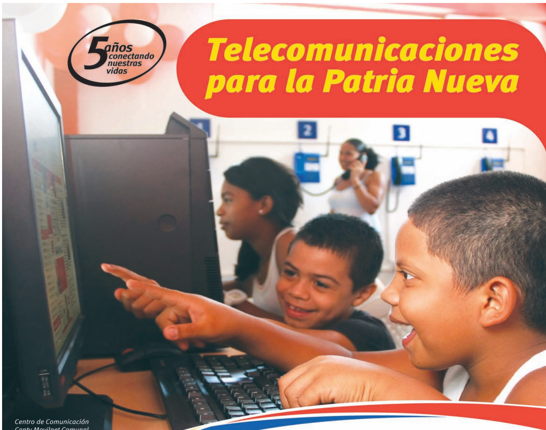
Centro de Comunicación Cantv Movilnet Comunal. Marare - Valles del Tuy.

Ahora en cada rincón de Venezuela, las niñas y niños tienen asegurado el acceso a los servicios de telefonía e Internet, a través de los Centros de Comunicación Cantv Movilnet Comunal, un logro más del Poder Popular.