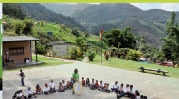
Escuela Ángel Ramón Quintana, sector Yagrumal, El Junco.