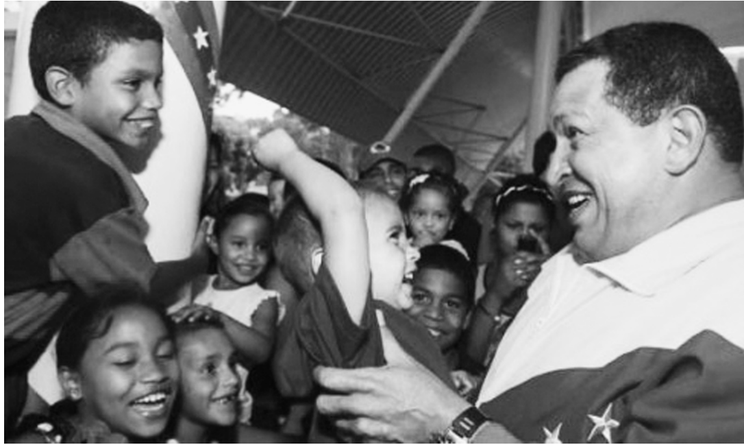
En 14 años fueron muchos las niñas y niños que nacieron y que crecieron escuchándolo, oyendo sus alocuciones y cantando con él.

El cariño del presidente Chávez por Las niñas y niños era innegable: él los cargaba, los besaba, se preocupaba por ellos y por para los pequeños