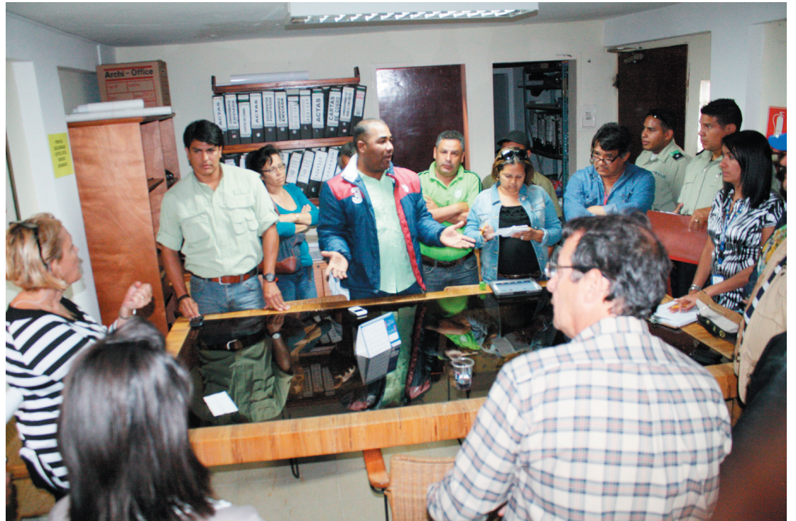
Vecinos exigiendo sus viviendas ante el Clebm