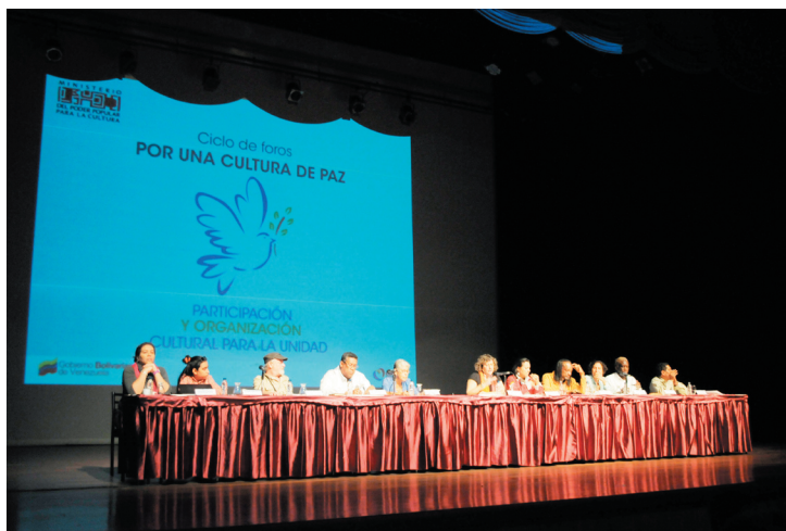
Las propuestas recogidas en los encuentros serán elevadas al Movimiento por la Paz y la Vida

Esta frase bien puede reflejar las conclusiones del debate organizado por el Ministerio del Poder Popular para la Cultura a través de la Fundación Casa del Artista el Instituto de Artes Escénicas y Musicales y la agenda cultural Llégate; al cual