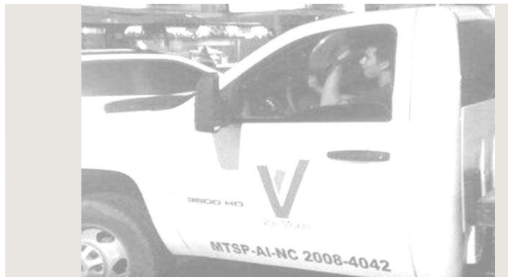
Montado en una camioneta de la GMVV y caceroleando... #findemundo pic.twitter.com/JFjYGLtvZA Estos son los que sabotean al estado

Ahora, no sólo pide la muerte de la rectora del CNE Tibusay Lucena y llama "hijo de puta" al diputado