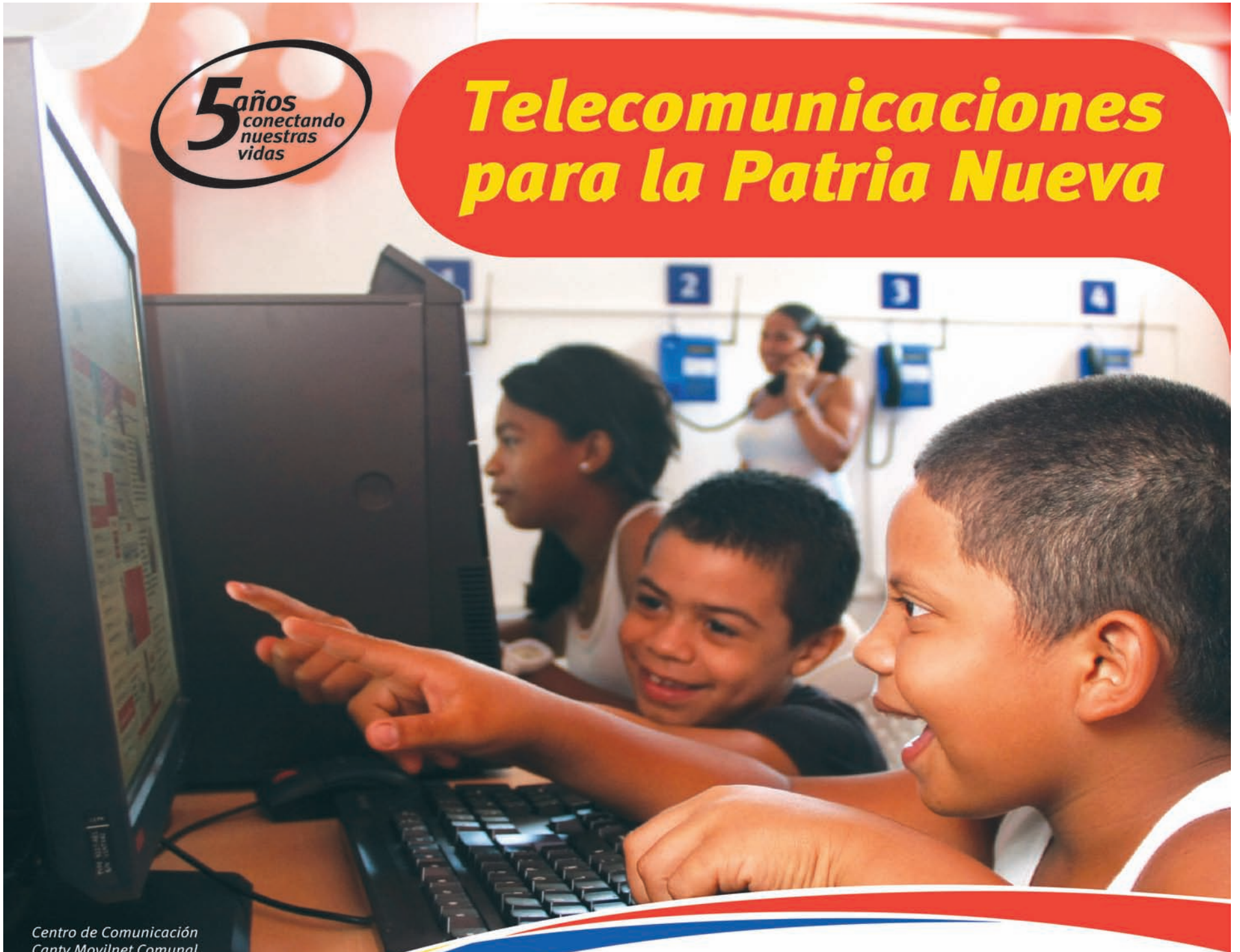
Centro de Comunicación Cantv Movilnet Comunal. Marare - Valles del Tuy.

Ahora en cada rincón de Venezuela, las niñas y niños tienen asegurado el acceso a los servicios de telefonía e Internet, a través de los Centros de Comunicación Cantv Movilnet Comunal, un logro más del Poder Popular.