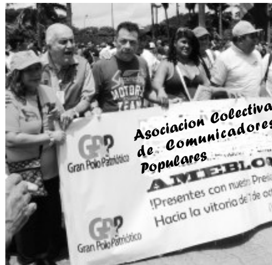
Con el grupo de AMEBLOQ

automáticamente nos abrieron sus puertas permitiéndonos realizar ciertos reportajes. Decidimos ayudar a varias personas de este pueblo para que formaran su periódico, dando talleres y apoyándolos en sus recorridos hasta que realizaran solos sus reportajes.