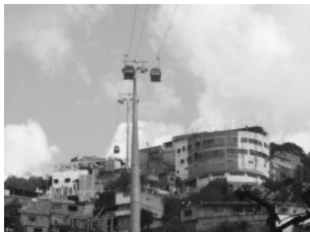
Torres y vagones en Guaicoco

Ya se observan los vagones del Metro Cable de Mariche, que dan esperanza a los ciudadanos de este sector de llegar más temprano a sus hogares, por la reduccion del tiempo en el traslado, desde sus lugares de empleo.