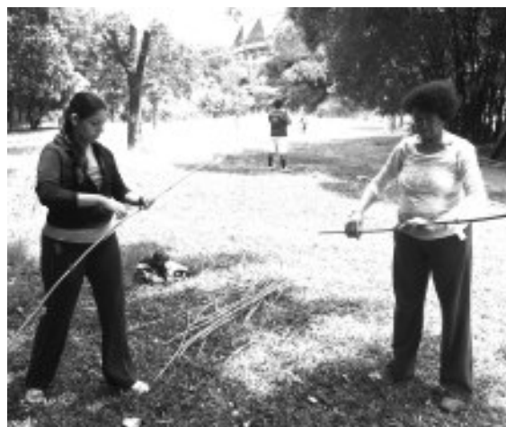
Voceras del C.C Palo Verde con baritas para sus banderas