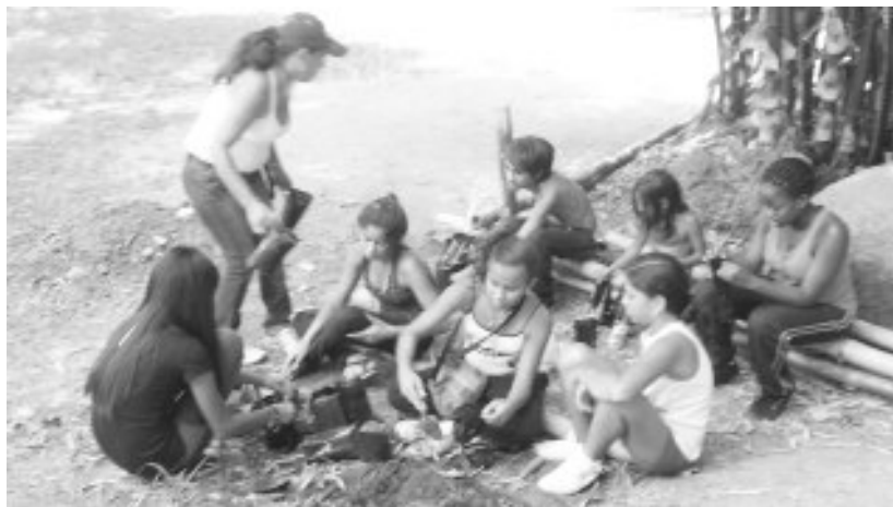
Niñas y niños llenan bolsitas con tierra abonada

Frente ambientalista Urimare, Sala de Batalla Vamos con Todo, consejo comunal bolivariano Palo Verde y el colectivo El Petarazo con su grupo de niñas y niños ambientalista se dieron cita en el parque Galindo para darle una gotita de amor.