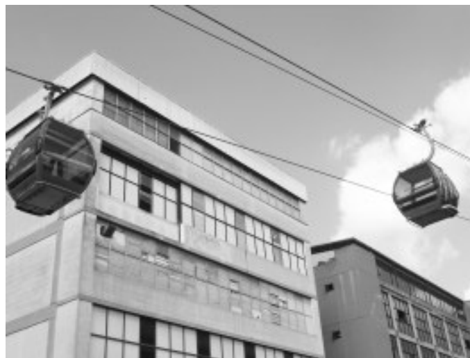
Vagones del Metro Cable sector Palo Verde,

Estas obras traen todo un plan de reordenamiento de Petare a corto, mediano y largo plazo, que mejoraran la calidad de vida de los ciudadanos de esta populosa parroquia que tanto lo necesita.