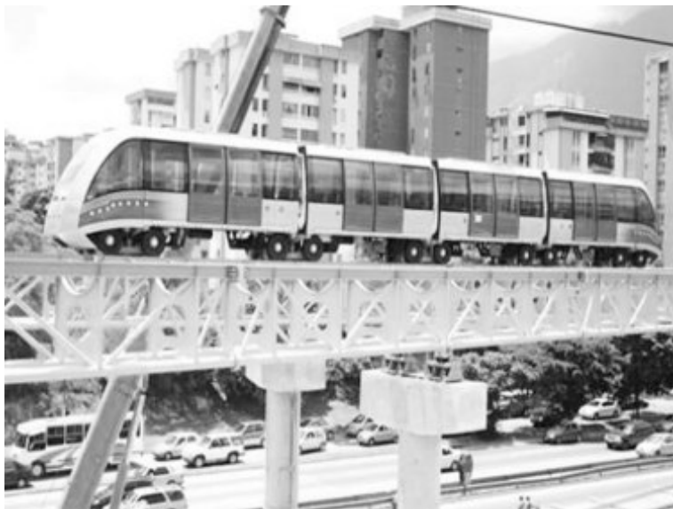
Cable tren Bolivariano