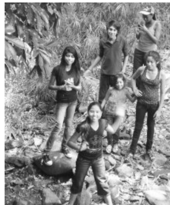
Grupo ambientalista de EL Petarazo recorren el parque