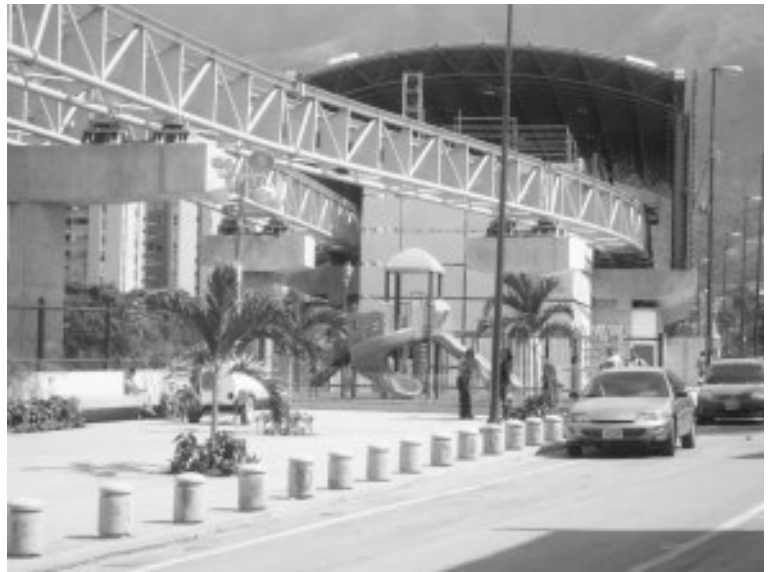
Vecinos ya pueden transitar por el paseo en las adyacencias del Cable Tren Bolivariano

Dos obras que en Petare que no solo beneficiaran a los vecinos de ese sector sino tambien a los de zonas aledañas como La Dolorita Y Mariches.