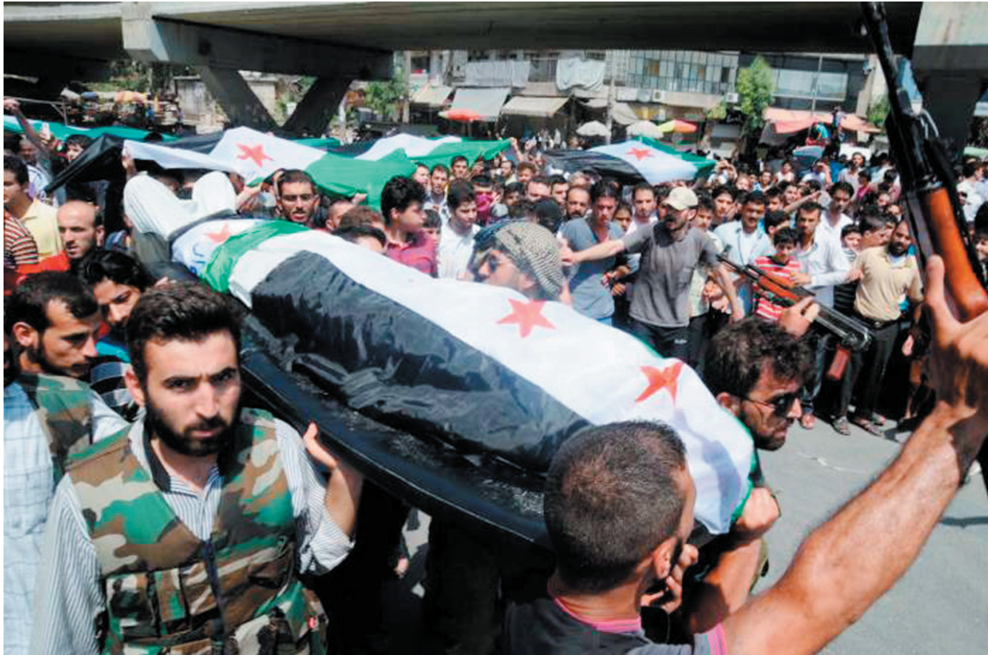
Las bajas en la población civil siguen incrementándose día a día

El mundo sabe que Siria en sí misma no molesta ya que su influencia regional cada vez está más encajonada, lo que molesta es su lugar en el mapa, lo que la convierte es una estación más del camino que ha tomado Estados Unidos para llegar finalmente a Teherán y que la caída de al-Assad es clave para seguir aislando a Irán