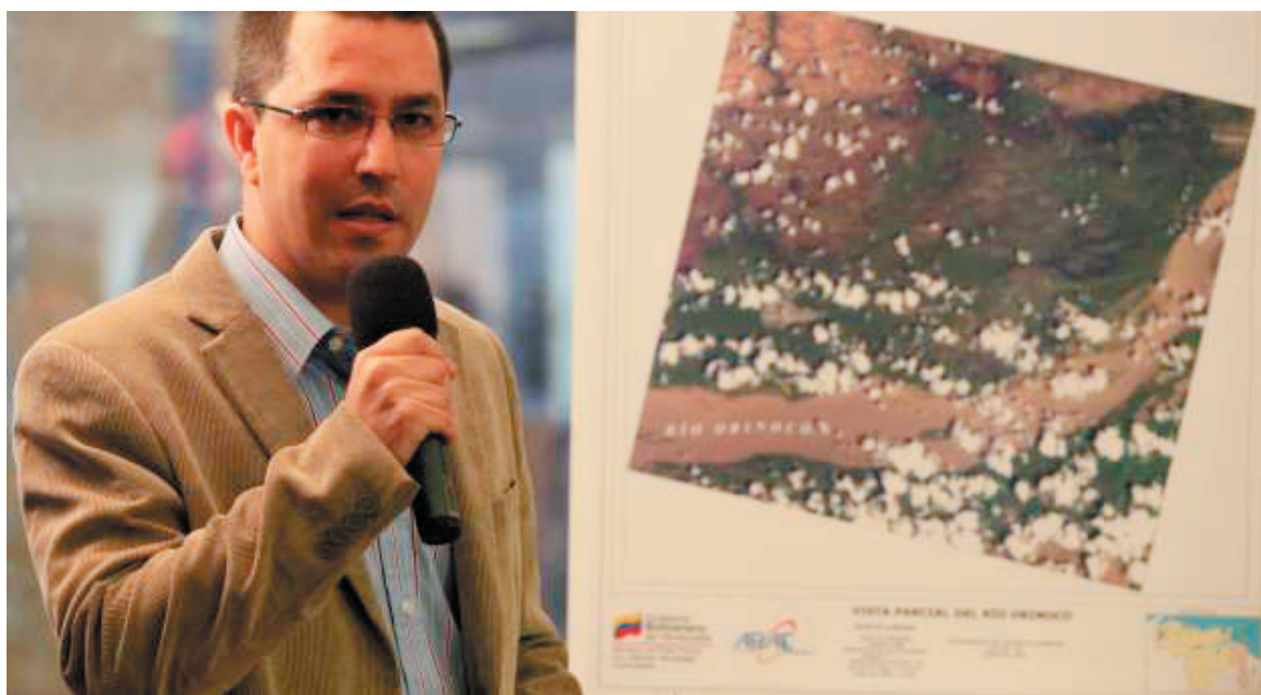
The Minister Jorge Arreaza said that this is technological sovereignty for Venezuela to make peaceful use of the outer space and give many benefits to the population

the behavior of vegetation, seas and rivers, to make researches aimed at locating communities and find, for instance, the most suitable areas to construct industries, bridges and houses.