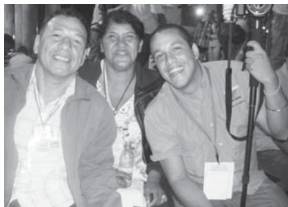
Cabeza de mango el Petarazo y El Capurro esperando el primer boletín en el CNE