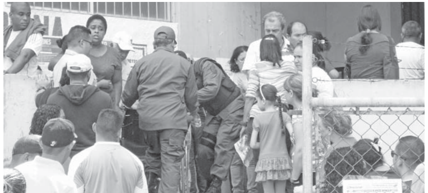
Guardias ayudando a personas de la tercera edad.