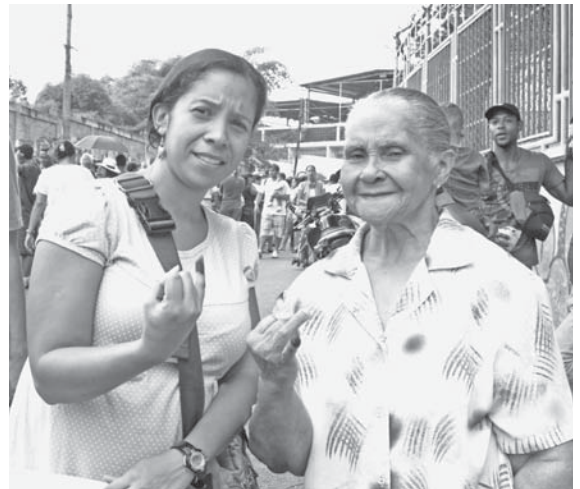
Las personas embarazadas y de la tercera edad ejercieron su voto sin contratiempo