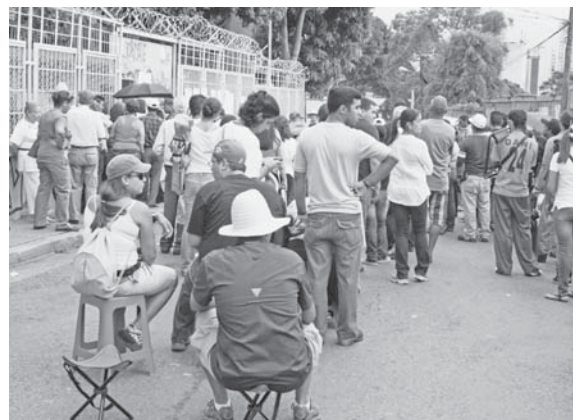
La comodidad no se hizo esperar