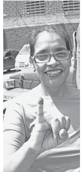
Esta señora dijo ya voté y fue rapidito

seguridad de los comicios fueron desplegados en toda la parroquia al igual que la Policía Nacional Bolivariana, en resguardo de la seguridad de toda la comunidad vállense.