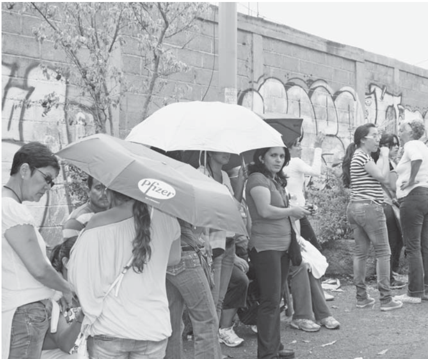
Los paraguas sirvieron de sombrilla