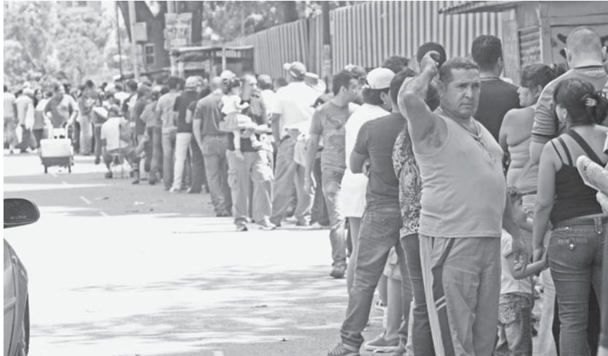
La asistencia fue masiva

Desde tempranas horas de la mañana se observaron largas colas en los centros de votación de personas de diferentes edades, imperando el orden y la paciencia. El caluroso día fue propicio para que los vendedores de agua y helados hicieran su agosto,