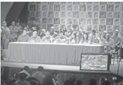
Rueda de prensa comando Carabobo todos alegre y confiado del triunfo