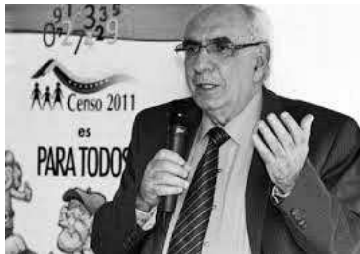
Eliás El Jury, Presidente del INE.

Este es un Instituto de la administración central que, como es lógico, funciona aquí en Guayana, que además está decir prestó un invaluable servicio en el pasado censo nacional; su presidente a nivel nacional es Eliás Eljuri un destacado profesional de la docencia universitaria y dirigente político de izquierda; pero aquí en Guayana hay un pero, no se sabe con la anuencia de quién, el organismo está secuestrado por el escualidismo; hasta el extremo que cualquier respiro por la candidatura chavista es perseguido y extrañado del organismo; lo mismo sucede con el personal contratado y todo aquel que desee ingresar. Otro organismo que también se deja llevar por las olas del escualidismo es el Instituto de Geografía Nacional; allí no le dan respiro al que muestre simpatía por el presidente Chávez.