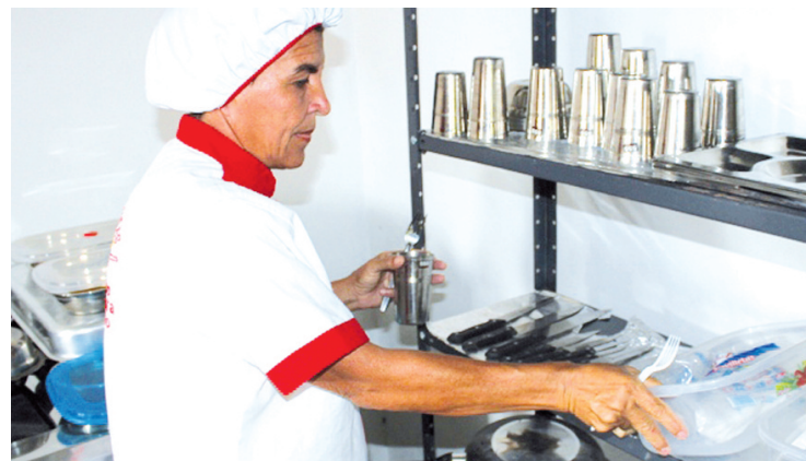
El programa social contará con personal calificado y dedicado a darle atención de calidad a los adultos y adultas mayores