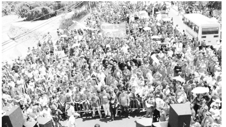
La caminata culminó en la recién reconstruida Av. Laudelino Mejías