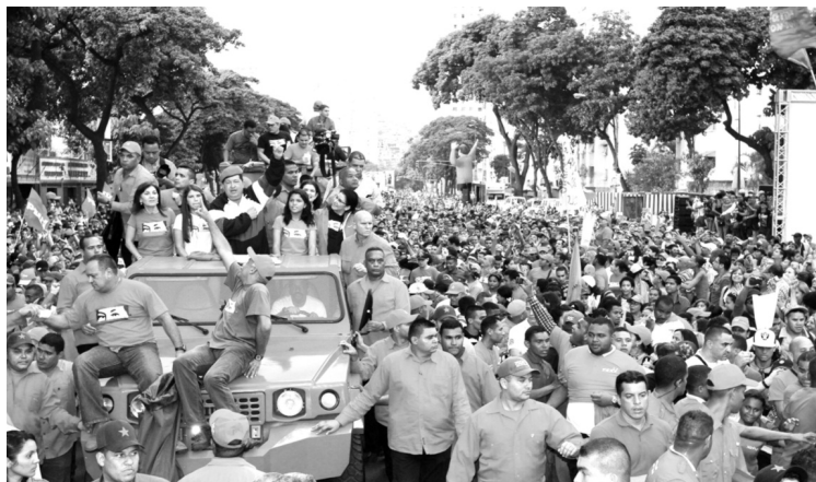
Hugo Chávez busca reelegirse con 10 millones de votos

En este sentido comentó, que en los últimos días reconocidas encuestadoras a nivel mundial han mostrado el favorable ascenso del Presidente Chávez, "La brecha a favor del candidato socialista es insuperable, a pocos días de las elecciones, según Datanálisis, Chávez