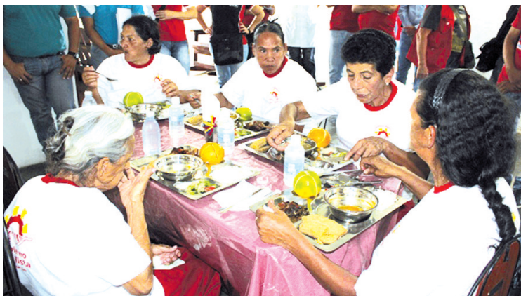
Los abuelos y abuelas satisfechos por los beneficios otorgados de la mano de la Revolución