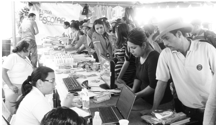
Feria Escolar de MinComercio benefició a la población de Santiago

El despliegue se realizó desde el jueves 13 de septiembre cuando los entes participantes como la Fuerza Armada Nacional Bolivariana (a través del Ministerio del Poder Popular para la Defensa y la Contraloría General de