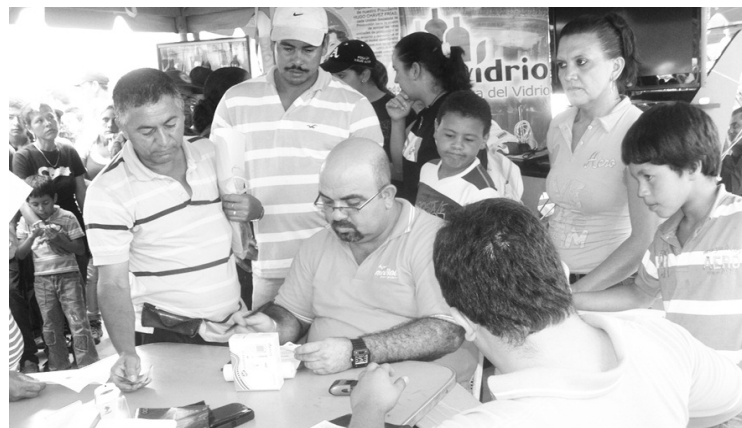
Celulares Movilnet fueron vendidos en la acción cívico- militar