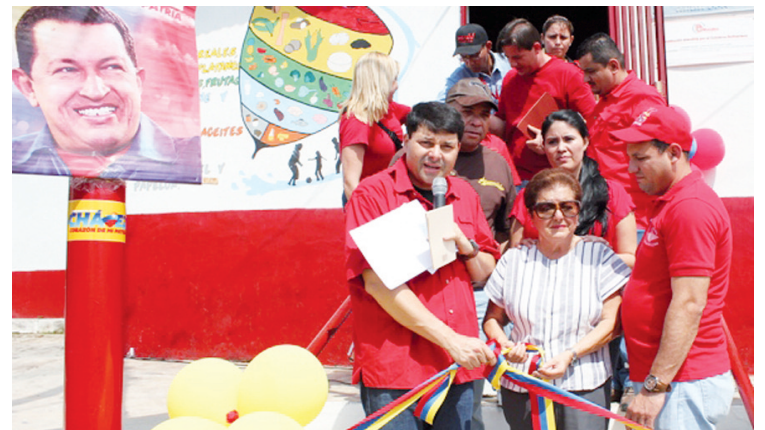
El mandatario regional inauguró la primera Guardería Geriátrica en el estado