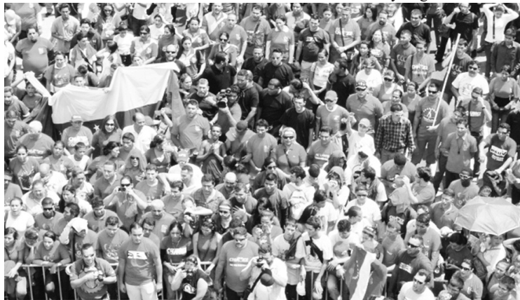
La juventud trujillana dijo: “¡Mi primer voto es pa' Chávez!”

Es de destacar que el cierre de Campaña del CCC a nivel nacional se realizará en la ciudad de Caracas el día miércoles. Por su parte la entidad trujillana cerraba con esta caminata llena de emociones y agradecimientos.