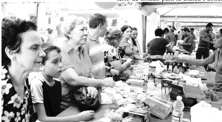
36 toneladas de alimentos fueron vendidos durante viernes y sábado.

La Oficina Regional Electoral dispuso un punto de la Feria Electoral con el fin de familiarizar a los electores con el Sistema de Autenticación integrado que ha dispuesto el Consejo Nacional Electoral para el próximo 7 de Octubre, garantizando de esta manera que las personas conozcan a detalle los pasos que deben cumplirse para ejercer el derecho al sufragio.