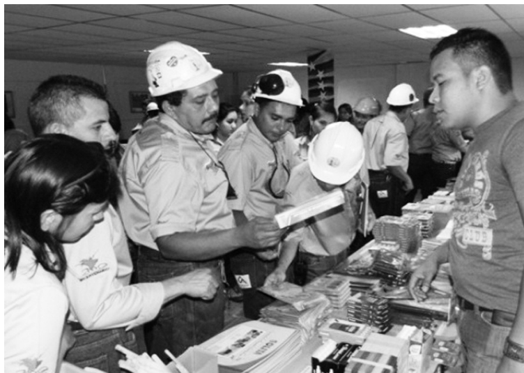
Personal de Cemento Andino participando en la Feria Escolar

Esta jornada cuenta con la participación de la Industria Venezolana Endógena del Papel (Invepal) del estado Carabobo y la cooperativa Nube Azul de Lara, quienes mantienen en sus mostradores más de 90 tipos de los ar-