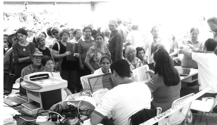
"Mi Casa Bien Equipada" presente en la Jornada Socio Cultural

La FANB garantiza la seguridad y soberanía de la nación; así mismo, cumple con la ejecución de Operaciones en Apoyo al Desarrollo Nacional a través de las jornadas cívico-militares de la mano con el Poder Popular organizado en consejos comunales; corresponsabilidad establecida en la Constitución Nacional de la República.