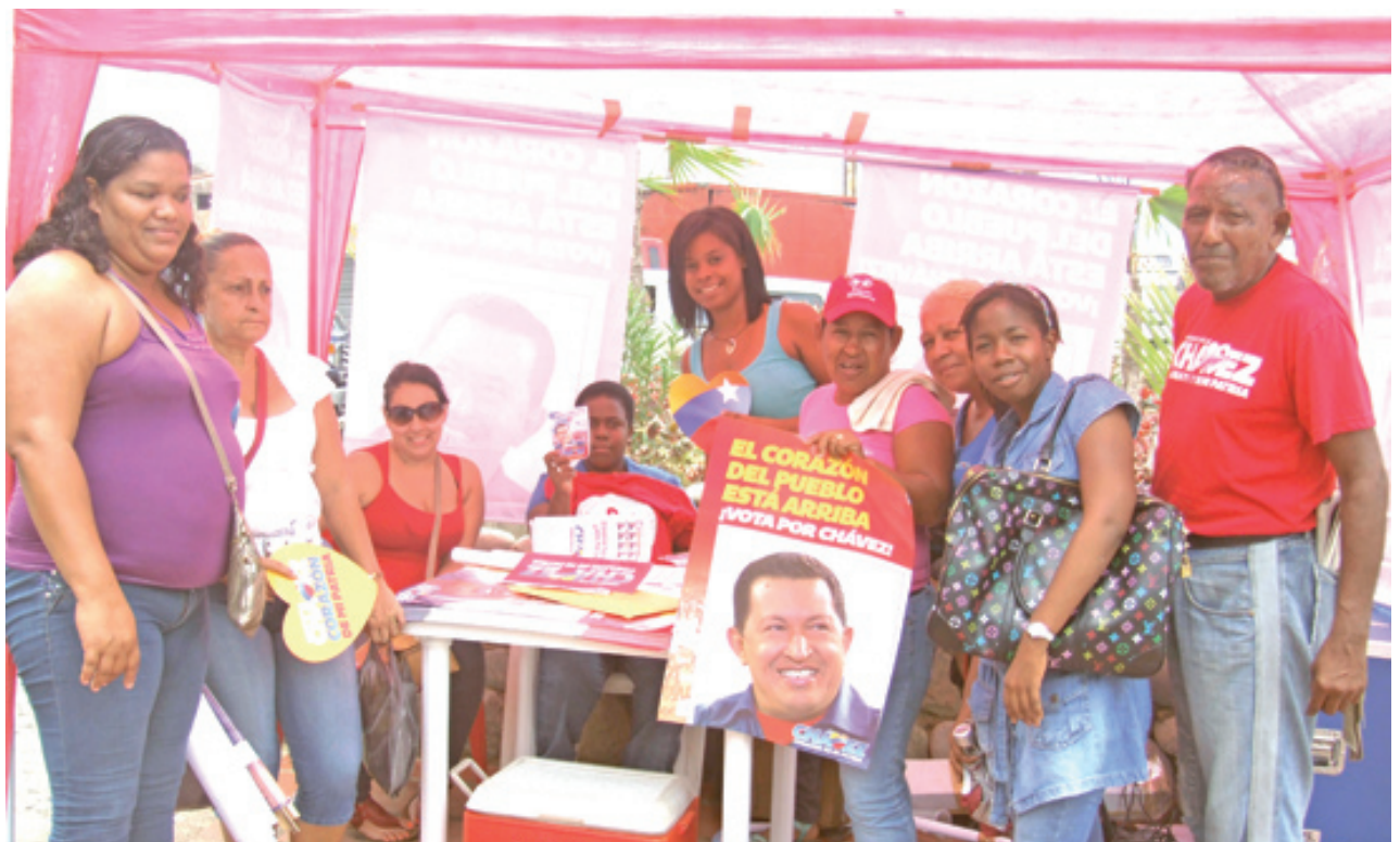
PUNTO ROJO PARADA LA GUAIRA (La Gu.)