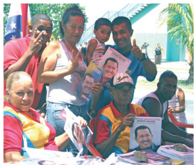
PUNTO ROJO SANTA EDUVIGIS (Urim.)