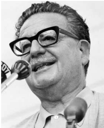
El Compañero Presidente Salvador Allende