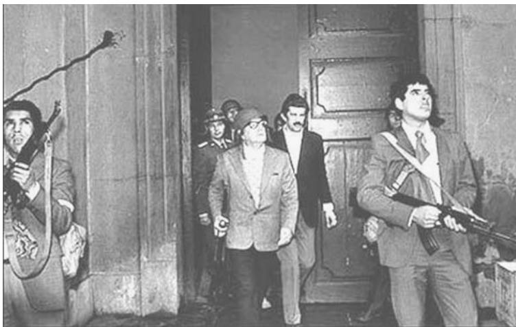
En diciembre del 1972 ya los fascistas se alzaron en un golpe que se conoció como "El Tankazo" de allí esta foto, que algunos atribuyen al 11 de septiembre del 1973, pero no es así, es del tankazo. Allende, valientemente salió con su fusil.

muchas veces el tema y estábamos convencidos a nivel de Dirección Local Cerdón Cerrillos en el MIR, que el golpe venía sí o sí, particularmente porque las salidas intermedias como el golpe blando no iban a detener el desarrollo del sector de masas que venía intentando construir Poder Popular. Sin embargo la Comisión Política pensaba que la convocatoria a plebiscito de Allende abriría un nuevo período y realineamientos de fuerzas, por lo que el golpe militar fue una sorpresa real. El MIR había denunciado a los golpistas, incluido a Frei, y sabía de los planes de la Marina (por el caso de los marineros detenidos por organizarse para frenar el golpe, pero se equivocaron al pensar que la maniobra de Allende del plebiscito detendría la ofensiva reaccionaria.)"