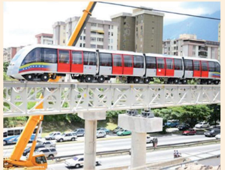
El Fantástico Cable Tren Bolivariano que servirá a Petare y a los venezolanos

y un recuerdo para nuestro Comandante Che que su ejemplo y pensamiento nos guía cada día de nuestras vidas de Revolucionarios y que este próximo 8 de octubre, un día después de la Batalla victoriosa, se cumplirán 45 años de su asesinato.