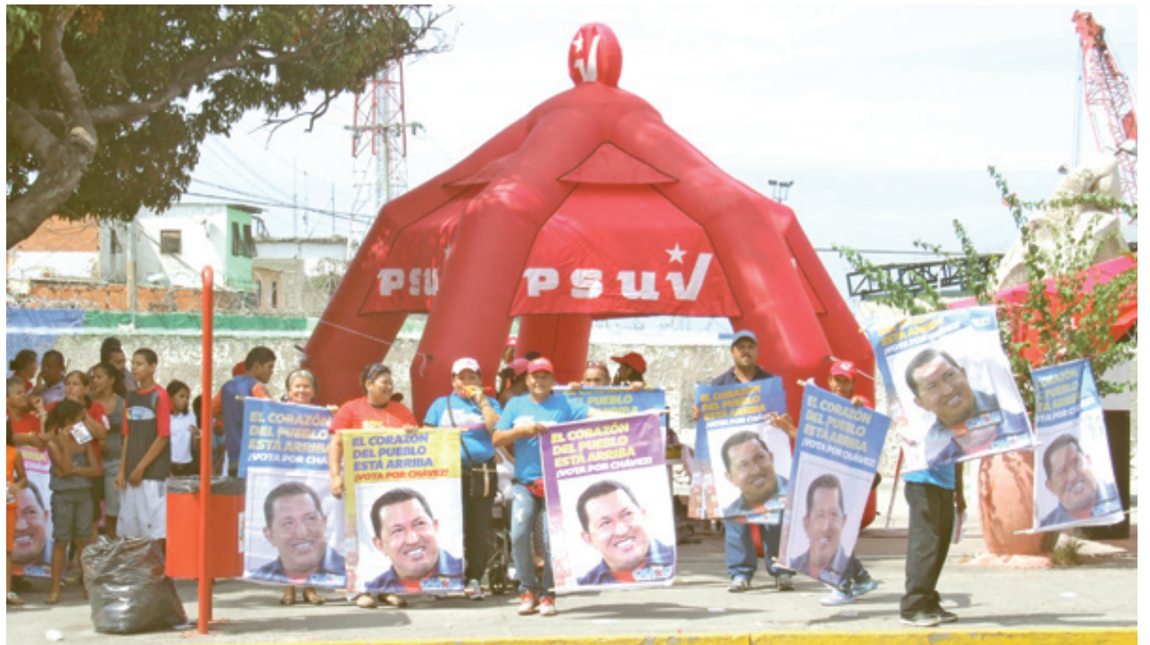
PUNTO ROJO CALLE LOS BAÑOS (Miq.)

Una de las acciones esenciales de esta campaña para el PSUV ha sido el accionar de los PUNTOS ROJOS, verdaderos bastiones o trincheras de lucha donde esforzados militantes mantuvieron posiciones adelantadas para el reparto de propaganda, información política de la palabra y programa del Presidente Chávez y agitación. Va a ser necesario, por parte de la dirigencia local del partido, otorgar reconocimientos, estímulos morales, como los llamaba el Ché a estos compañeros. En las gráficas: algunos de estos.