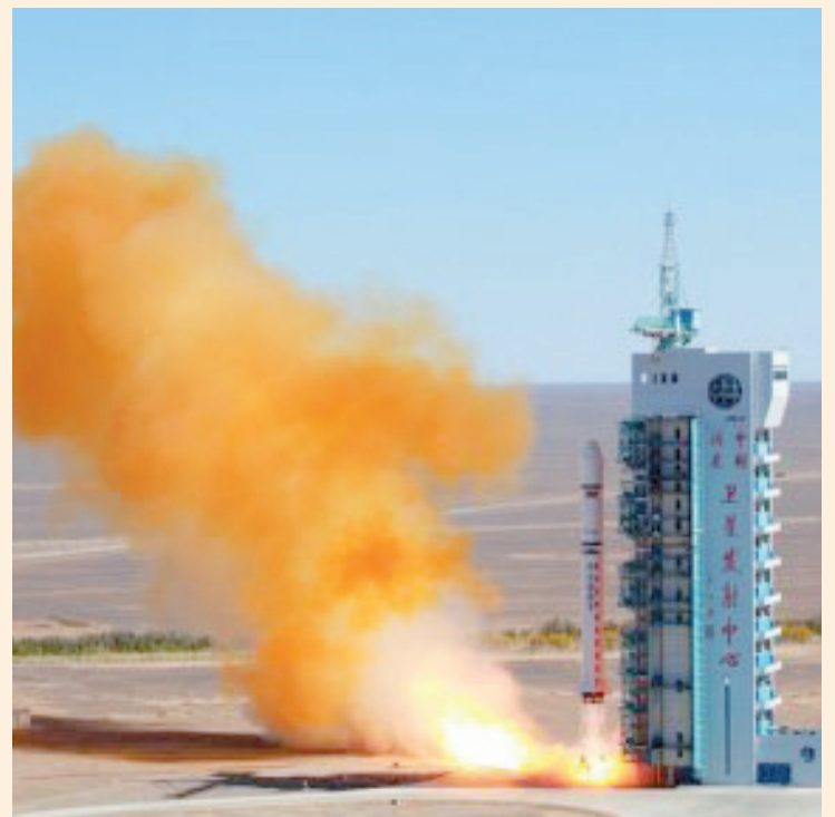
El Satélite Miranda que nos pone a la par de las naciones mas desarrolladas del mundo