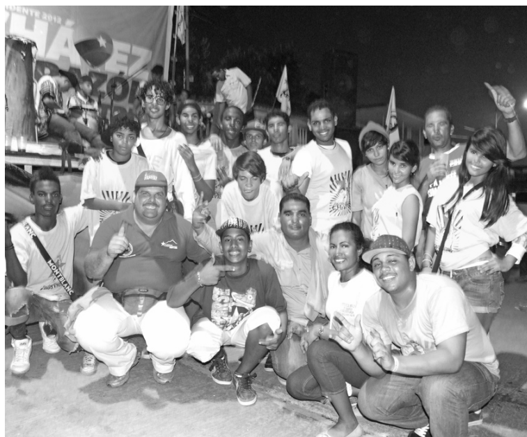
Colectivo: Raices Urbanas

al apoyo del camarada José Félix Valera, cuenta con una sala de serigrafía, una sala de conferencia, un salón de sala situacional, un estudio de grabación, y se van a hacer diferentes talleres que son: de serigrafía, audiovisual, imprenta y reproducción, como estampar y de agricultura y tierras, para lo cual nosotros hacemos un llamado a todos los jóvenes, porque nosotros hemos rescatado muchos jóvenes, que han dejado de tener una pistola, para tener un micrófono, han dejado