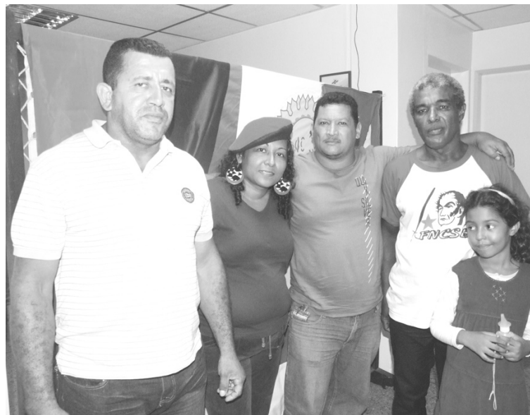
Parte de los integrantes del Equipo de Vanguardia Cultural Organizada de Valle del Pino que realizó el evento.

Con la participación sin igual de la comunidad y el gobierno Revolucionario, seguiremos