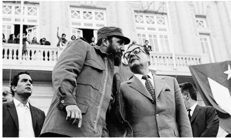
El Comandante Fidel Castro visitó al Compañero Presidente Allende.