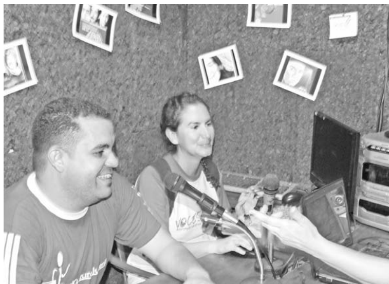
La Radio Comunitaria de La Casa del Poder Popular

un taller de serigrafía, una radio, estamos montando un estudio de grabación, una unidad de producción audiovisual, es decir; que estamos montando la artillería, para la batalla de las ideas, para que nuestro pueblo se apodere más, este es un espacio para la formación, un espacio también para la organización, un espacio también para activar la