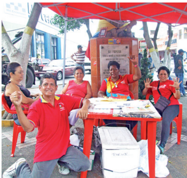
PUNTO ROJO ALI PRIMERA (C.Soub.)