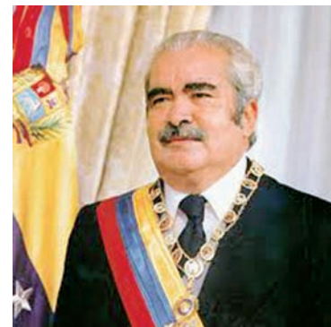
Luis Herrera Campins: Otro irresponsable y corrupto “Presidente” copeyano de la IV República. Dio la orden de ejecutar la masacre .Se murió sin pagar este crimen.