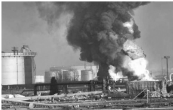
ión en la refinera Amuay ¿accidente o sabotaje?