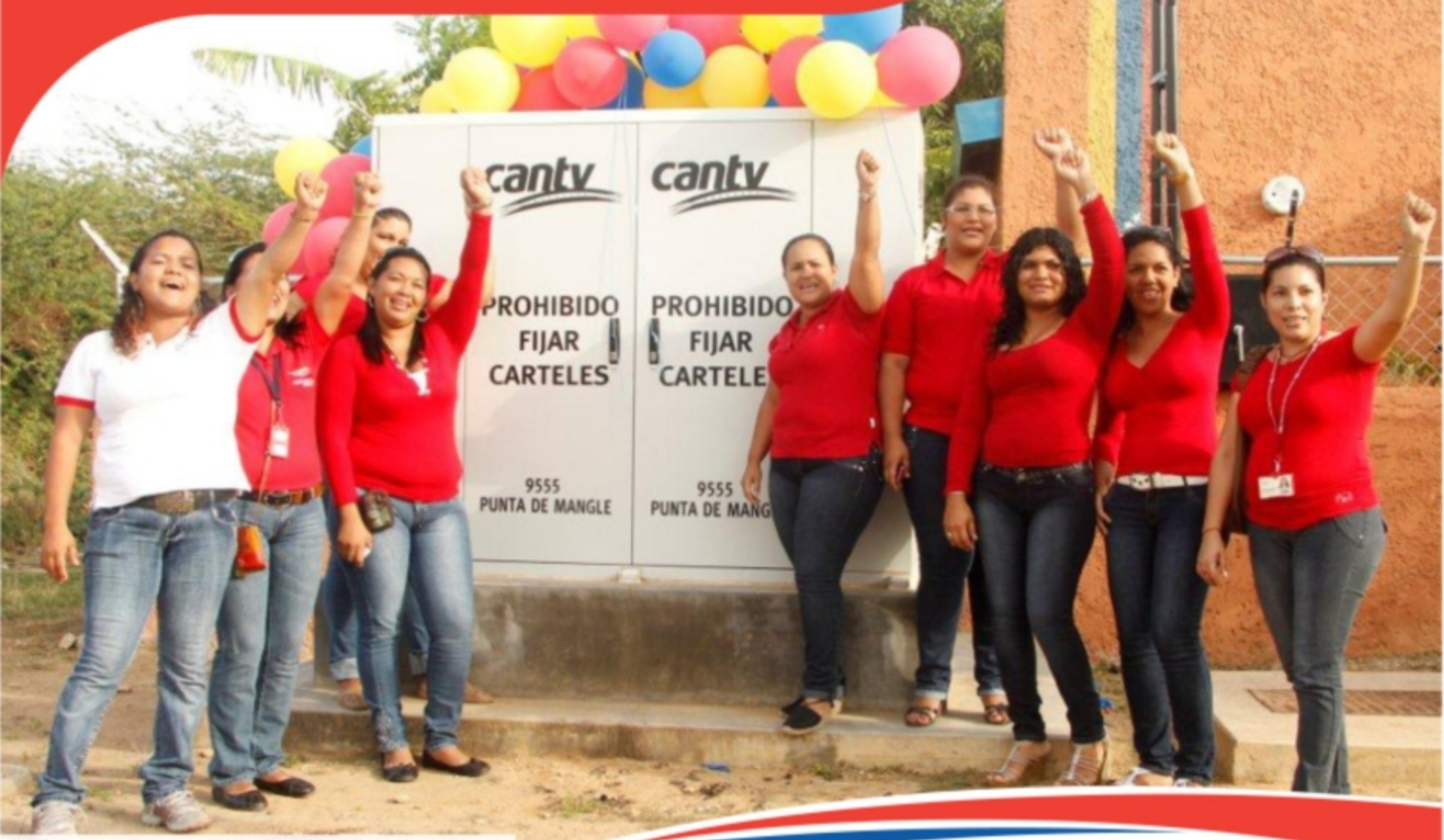
Sector Punta de Mangle, municipio Tubores estado Nueva Esparta

Punta de Mangle, en Nueva Esparta; Mesa Bolívar, en Mérida; Arrecife, en Vargas y El Cercado, en Lara, son sólo algunos de los poblados históricamente excluidos, que desde abril de este año cuentan con acceso a los servicios de Cantv gracias a la instalación de nodos de nueva generación y a la modernización de centrales telefónicas.