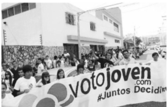
o y la (NED) han canalizado millones de dólares pos antichavistas, sectores juveniles, distas y medios privados. Según su último ne, una parte significativa de esos dólares fue gada a grupos como Voto Joven

asombrosa de las amplias libertades en esta "dictadura" y los extraordinarios avances y logros de este gobierno que "no sirve". De igual manera, la percepción negativa y amenazante de Venezuela es la que más circula en los medios mundiales.