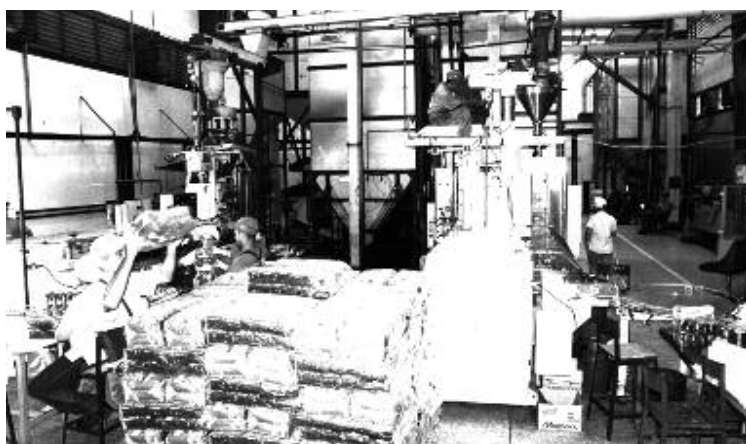
Producción acumulada del 2012 alcanza las 6.652,93 ton.

Durante su visita al estado Trujillo, el sábado 22 de septiembre, el Presidente de la República y "Candidato de la Patria", Hugo Chávez Frías, felicitó a los caficultores de la entidad andina, ya que en los últimos seis años los niveles de producción del café ha sido superior