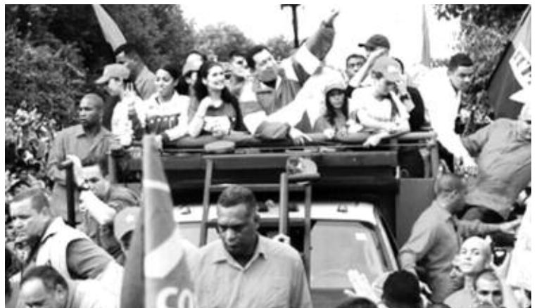
La Avenida Bolívar fue insuficiente para la concentración más grande de la historia de Trujillo

habitantes de los municipios Boconó, Trujillo, San Rafael de Carvajal, Valera, Motatán y Rafael Rangel. La inversión será de 350 millones de dólares aproximadamente.