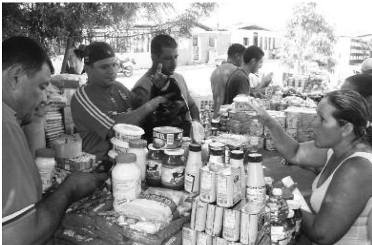
Venta de Alimentos beneficiaron al pueblo trujillano