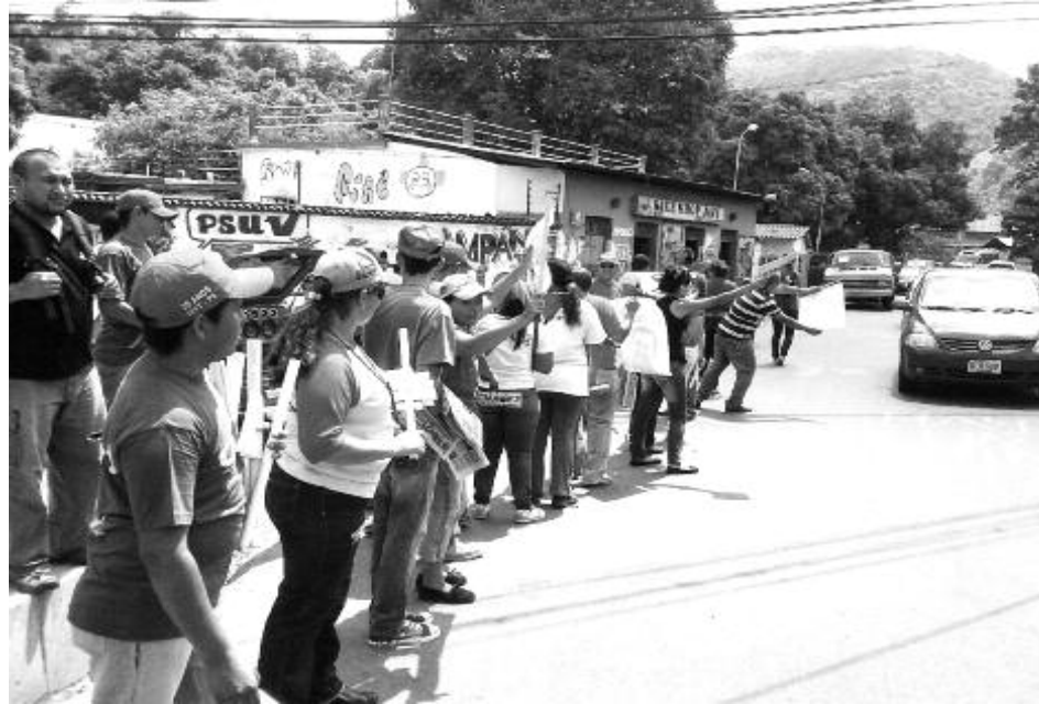
Agitación Política a favor de Chávez.