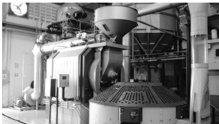
Inversión de Bs. 24.500.000,00 para aumentar los niveles de producción en Barquisimeto.

Actualmente, la UPS cuenta con dos líneas de producción, que generan cincuenta trabajos de manera directa beneficiando así al mismo número de familias larenses, a través de las cuales se envasan presentaciones de 500gr y 200gr que son distribuidas para los estados atendidos por la Región Centro Occidental, entre ellos Amazonas, Anzoátegui, Apure, Aragua,