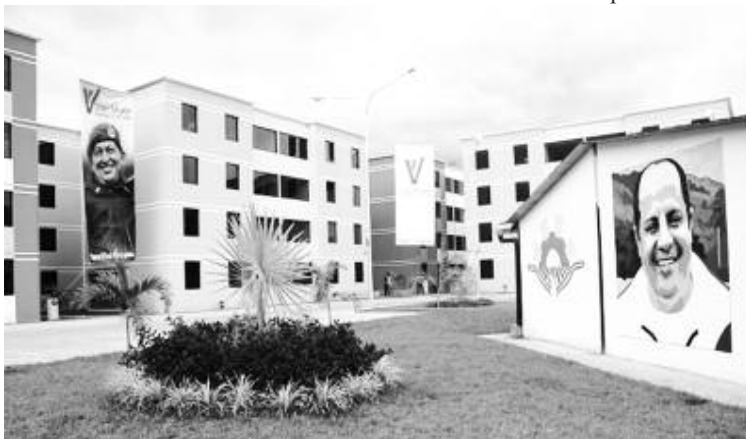
Áreas para la recreación y esparcimiento se ven a lo largo y ancho de la Comuna Luis Cabezas