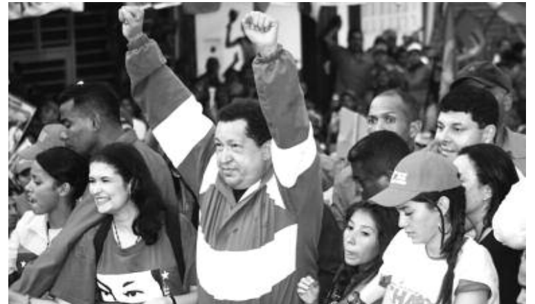
El Candidato de la Patria durante su recorrido por la Avenida Bolívar de Valera