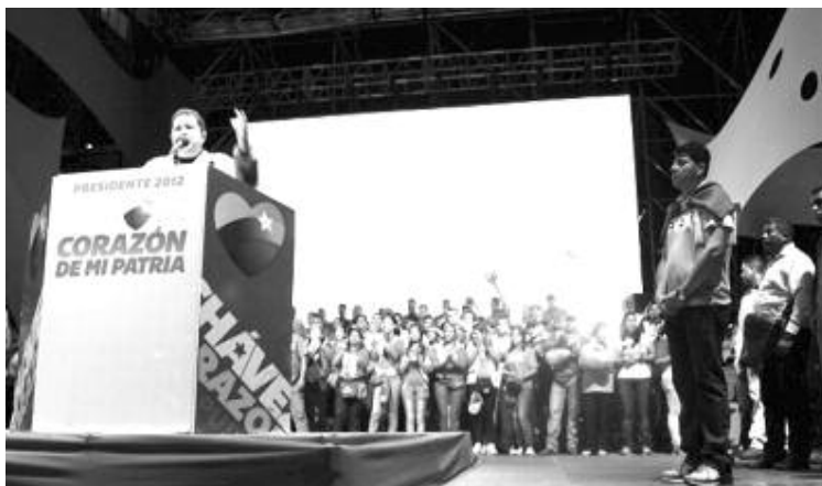
Hugo Cabezas acompañó al Comandante Chávez durante su visita al estado

Por su parte, el Candidato de la Patria Hugo Chávez manifestó estar muy feliz de visitar de nuevo nuestro estado. "Aquí en Trujillo vamos a barrer con la oligarquía. Por aquí paso Bolívar hace 200 años. Vamos todos a la batalla perfecta, volveré a Trujillo a celebrar la victoria del 7 de octubre y a seguir sintiendo este huracán de amor que ustedes me dan. Yo sé que Trujillo me ama y yo amo a Trujillo", resaltó.