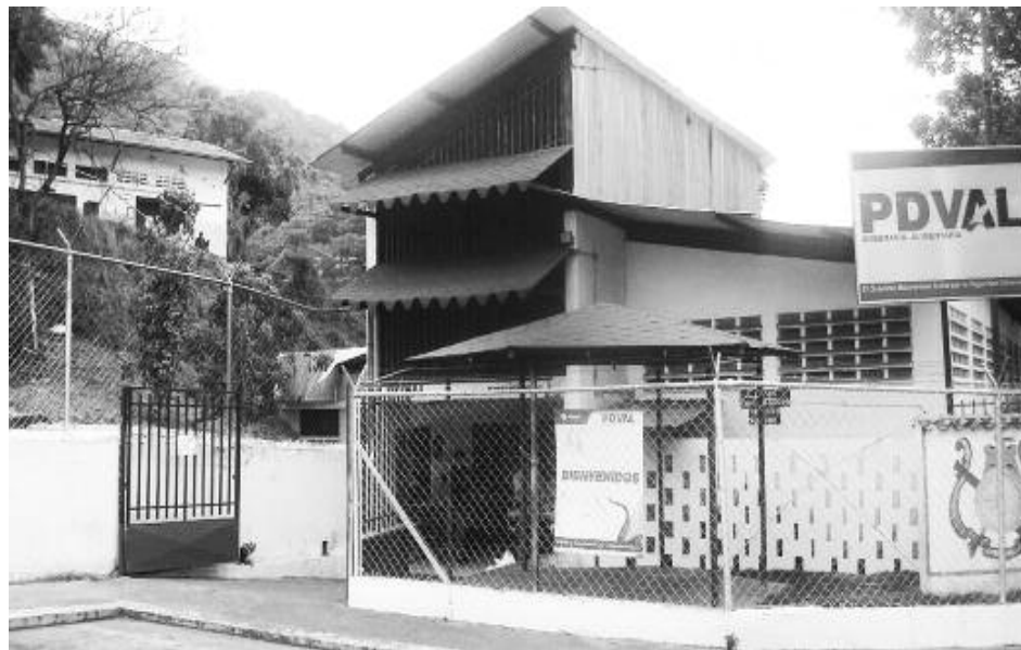
PDVAL Bird garantiza de calidad de alimentos al municipio Trujillo