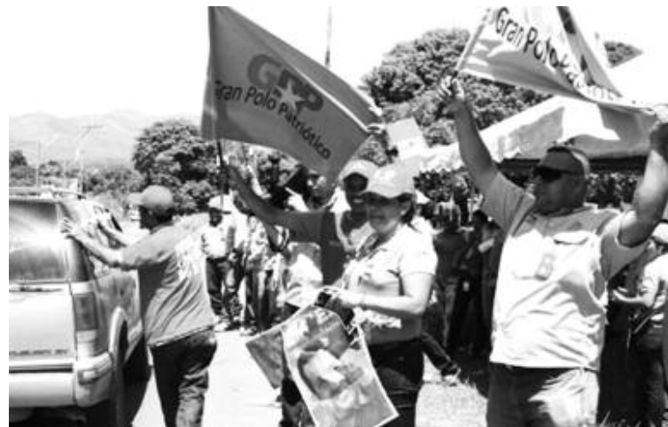
Acciones de calle promocional al candidato Chávez