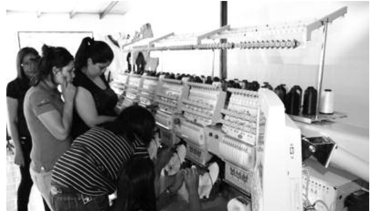
Pueblo organizado se beneficiará con la puesta en marcha de la Empresa Socio-productiva para la fabricación y confección de prendas de vestir para damas, caballeros y niños