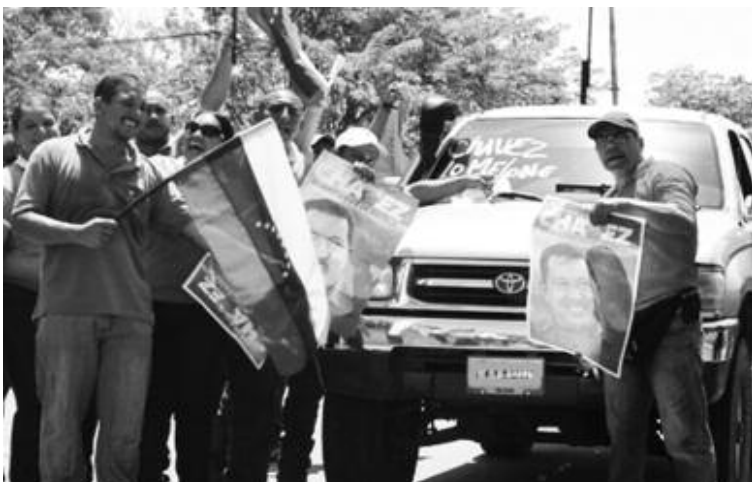
Miembros del GPP activados en la Carretera Trasandina en Candelaria

En la acción de agitación en la carretera Trasandina, específicamente en la entrada hacia la planta, se proporcionó información en relación a la campaña: entrega de volantes, música, pega de calcomanías y rayado a los vehículos que transitaban por la zona, con mensajes en apoyo al candidato rojo rojito, como forma de demostrar que trabajadores y trabajadoras de la