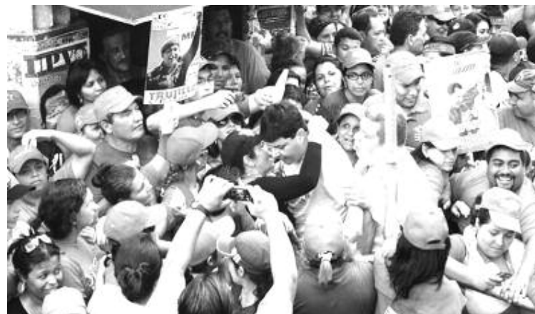
Gran recibimiento tuvo el Gobernador del estado en la avenida Bolívar de Valera

Lo más importante para nosotros –continúo- es la reafirmación del compromiso del pueblo chavista, esta actividad es algo sin precedentes. Estoy