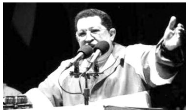
Presidente de la República afirmó incremento del café trujillano en más del 100%

Gracias a la inversión en la infraestructura y la transferencia de las torrefactoras (Argimiro Gabaldón, Tomás Montilla, Vencedores de Guapa, Nicolás Hurtado y Teresita Heredia) tras la liquidación y supresión de la CVA Café, el acumulado de producción en Café Venezuela alcanza, desde enero 2012 a la presente fecha, 6.822,29 toneladas del rubro procesado, el cual se dirige para el beneficio del pueblo ve-