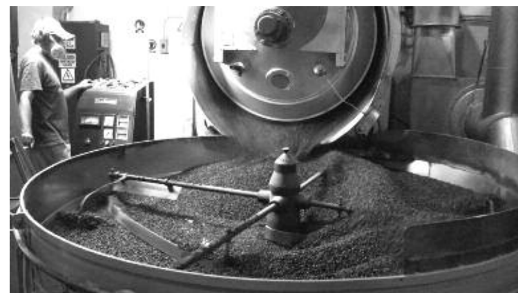
Actualmente el promedio empacado es de 260 ton.

La línea de producción está constituida por los siguientes equipos: un tostador, un molino, una empaquetadora y una enfardadora que tienen una capaci-