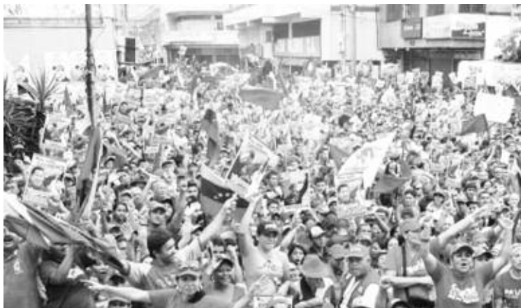
El pueblo trujillano desbordó la avenida Bolívar de Valera

Para el Gobernador del estado no hubo mejor manera de celebrar su cumpleaños número 40, que con la visita a Trujillo del Candidato de la Patria, Hugo Chávez, "estoy contento de ver toda esa alegría y amor que le demuestra el pueblo de Trujillo al Comandante, aquí está el pueblo organizado, esta es la muestra de lo será la gran victoria del 7 de octubre", reiteró.