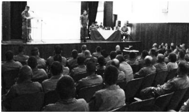
MG Padrino López en conversatorio con el personal castrense de la ZODI Trujillo.

El 2do Comandante y Jefe del Estado Mayor del Ejército Bolivariano hizo alusión durante su intervención al fortalecimiento del poderío militar y la atención integral a los efectivos activos y retirados de la FANB, como prioridad del Comandante en Jefe Hugo Chávez Frías.