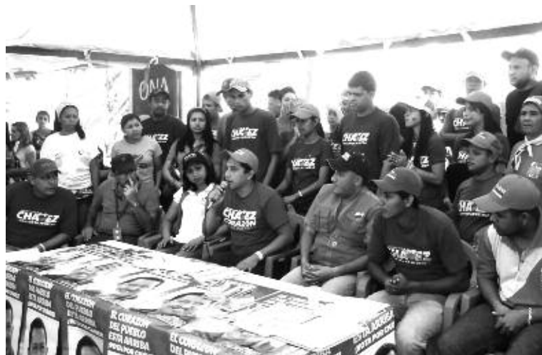
Juventud del PSUV Pampán en jornada social flor de Patria