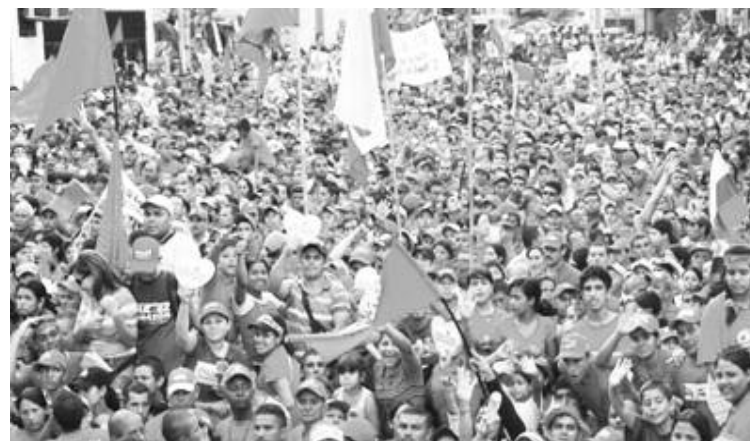
La concentración más grande en la historia de la entidad

seguro que vamos a lograr la victoria con 20 puntos, porque aquí ganaremos con 10 millones de votos y en Trujillo le vamos a ofrendar a la causa patriótica 300 mil conciencias de este pueblo campesino, humilde, trabajador, luchador incansable, de las mujeres, de los jóvenes, en fin de todos los que hacemos vida pública en este estado y que por supuesto vamos a reafirmar al Comandante Chávez el próximo 7 de oc-