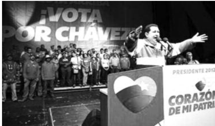
El Comandante Presidente realizó importantes anuncios para el estado Trujillo

También especificó que el mismo nacerá en el río Negro, en el Parque Nacional Dinira para beneficiar a los