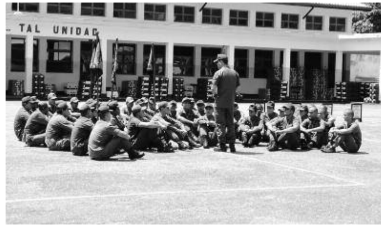
A partir de la Constitución Bolivariana cambió la filosofía de la FANB.

PRENSA 222 BIRD Orlando J. Quevedo M./ ECS