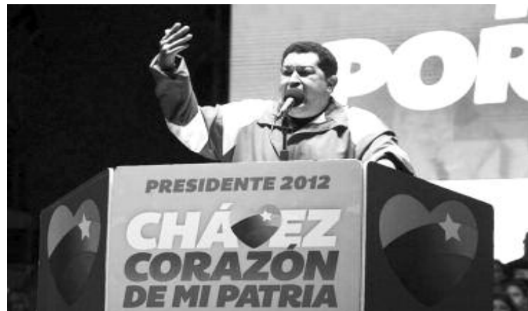
El Presidente Hugo Chávez recibió el gran amor de los trujillanos