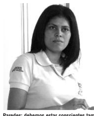
Paredes: debemos estar conscientes también de nuestros deberes y no solo de nuestros derechos.

trabajador abandona su puesto de trabajo durante el horario establecido por causa injustificada y/o sin permiso está faltando a sus deberes y queda sujeto a llamados de atención por escrito, lo que permitiría la apertura de un expediente administrativo y el despido justificado por el patrono en los casos que la situación sea recurrente.