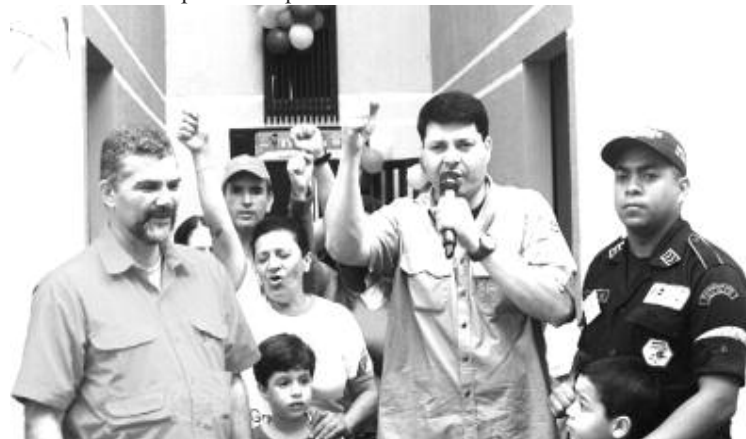
El Gobernador se mostró satisfecho por la construcción en tiempo record de esta Comuna Socialista