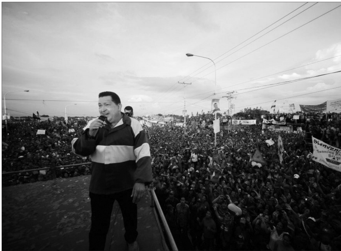
Hugo Chávez: "De verdad tú quieres paz. pues el 7 de octubre vota por la paz. No te equivoques".

HCH: Bueno, porque basta conocerme a mí, cuál es mi espíritu.Cuál es mi personalidad. Cuáles son mis valores. A mí