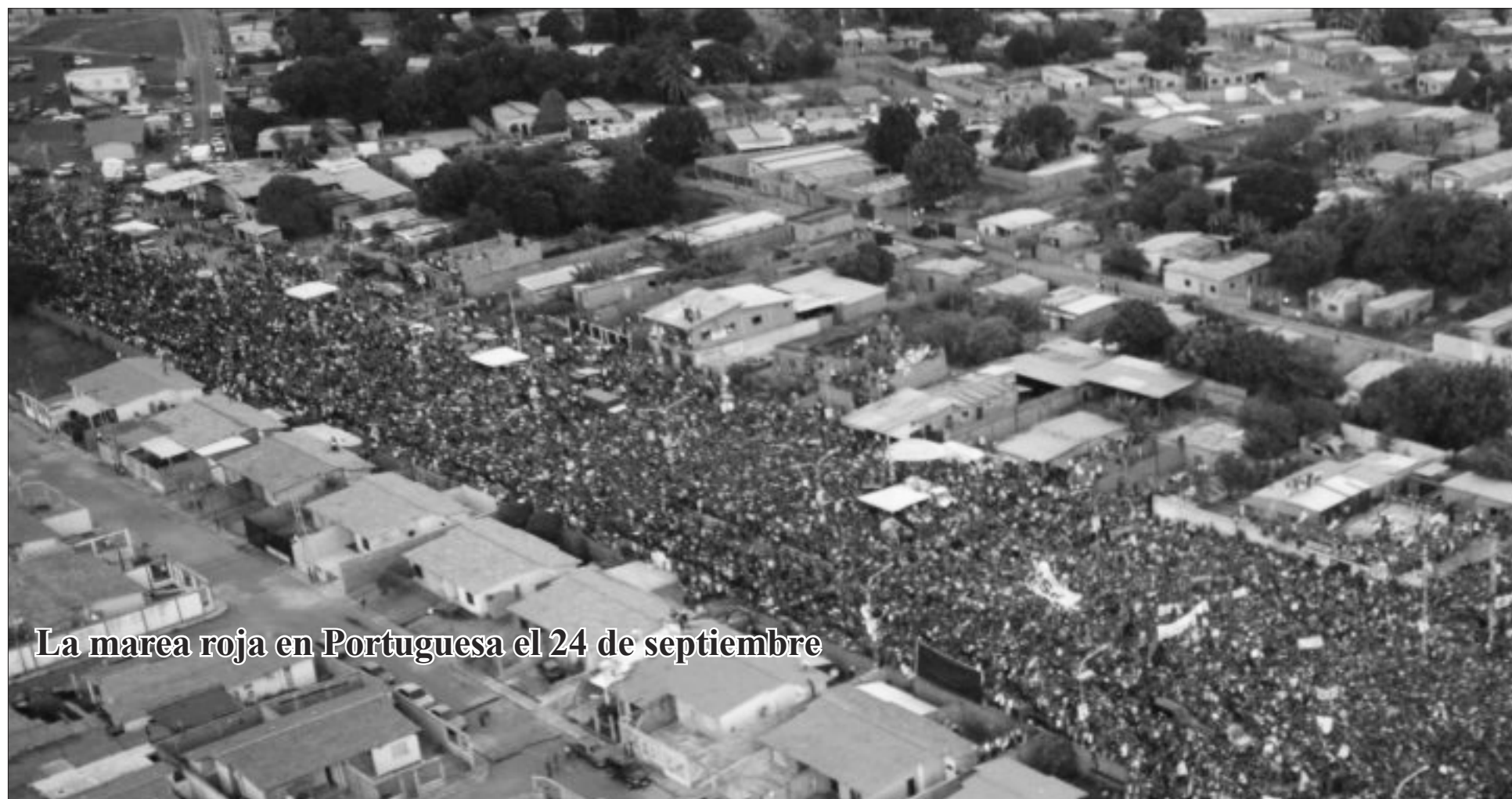
La marea roja en Portuguesa el 24 de septiembre

Que esta atmósfera electoral que hoy predomina en Venezuela varíe en los pocos días que faltan para el evento electoral, es muy poco probable; más aún si como se percibe en el ambiente, las y los venezolanos tomarán las calles en defensa de la institucionalidad democrática y participativa alcanzada en estos últimos años, al menor asomo de algunos equivocados que aspiran torcer con acciones violentas su voluntad mayoritaria.