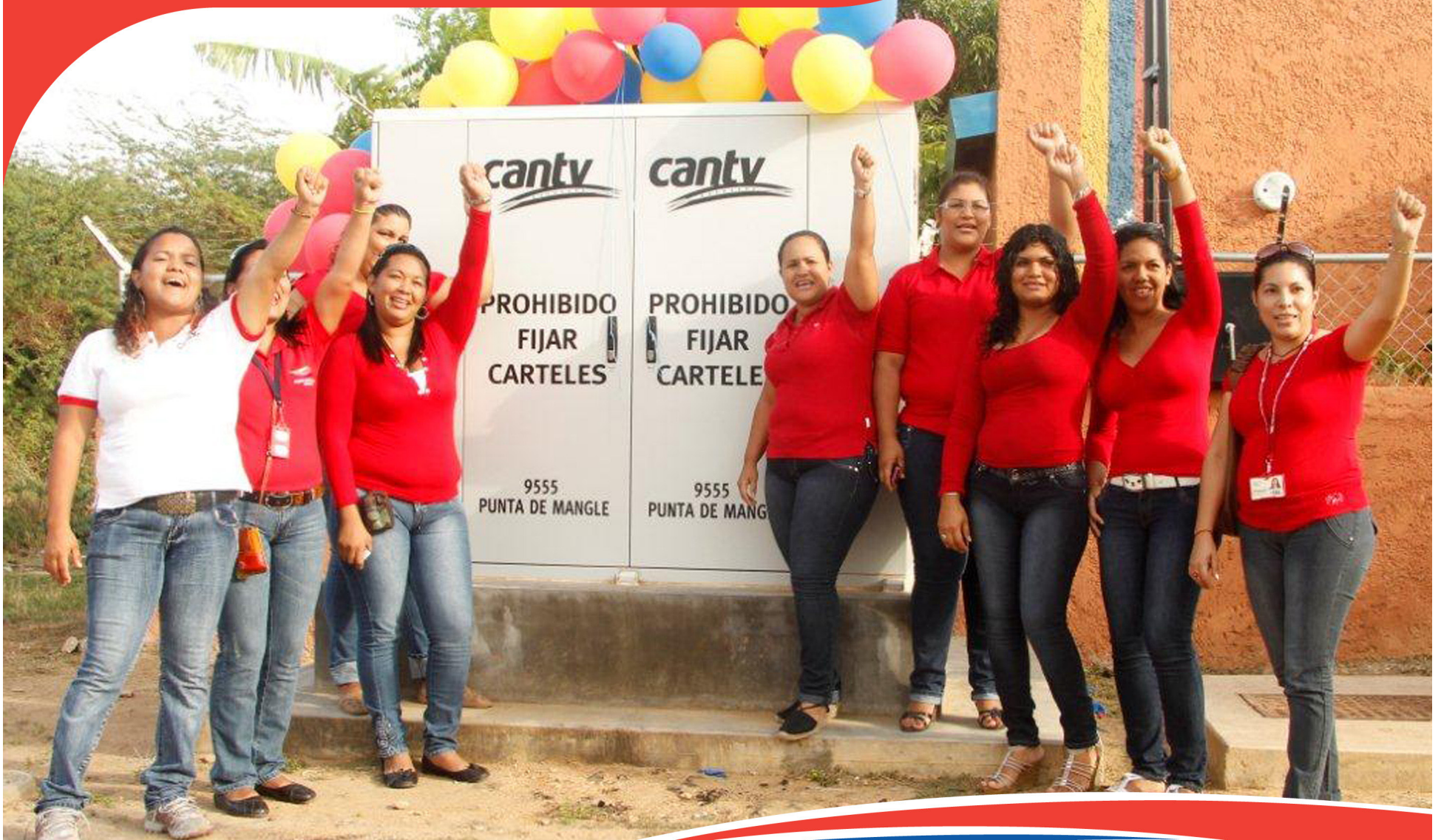
Sector Punta de Mangle, municipio Tubores estado Nueva Esparta

Punta de Mangle, en Nueva Esparta; Mesa Bolívar, en Mérida; Arrecife, en Vargas y El Cercado, en Lara, son sólo algunos de los poblados históricamente excluidos, que desde abril de este año cuentan con acceso a los servicios de Cantv gracias a la instalación de nodos de nueva generación y a la modernización de centrales telefónicas.