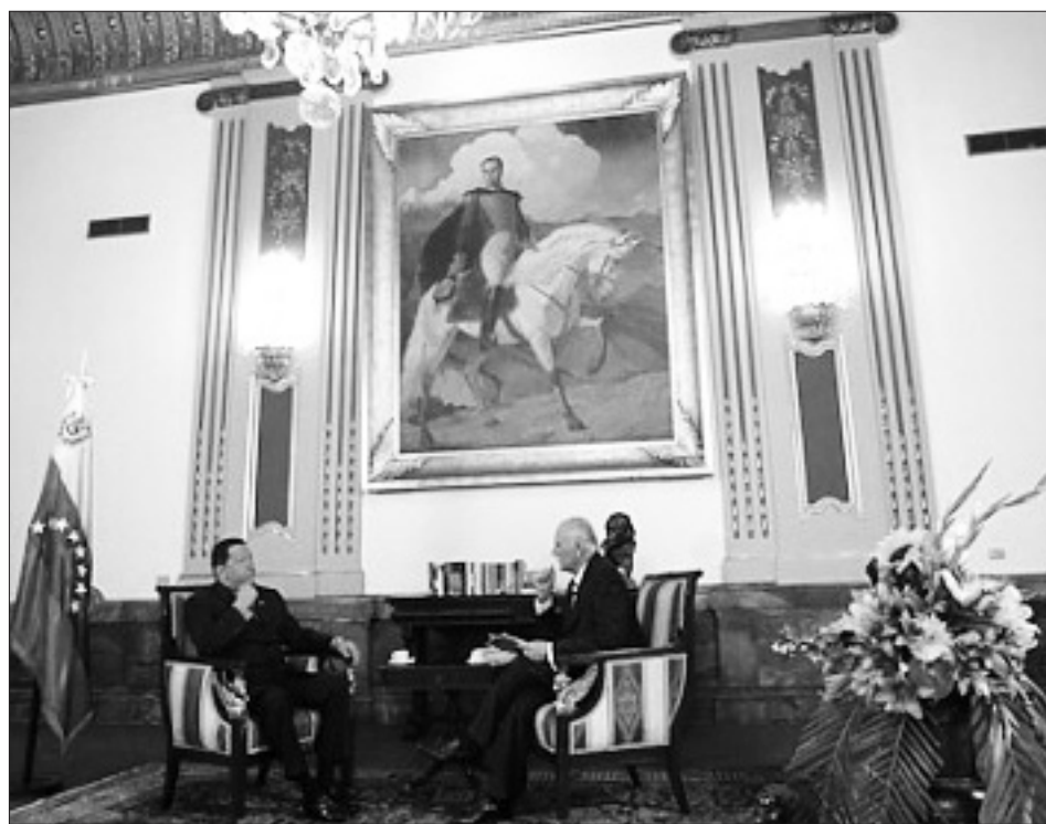
Candidato-presidente Hugo Chávez: “El sujeto del poder es el pueblo”.

HCH: La política se teje siempre en torno al tema del poder. Y de ahí os grandes conflictos políticos, nacionales, internacionales. Ahora si aterrizamos aquí (...), estamos en campaña electoral a pocos días del 7de octubre: el poder es del pueblo. La mayor parte del pueblo venezolano me ha dado parte de su poder. Porque el pueblo es el dueño del poder político. De allí la te-