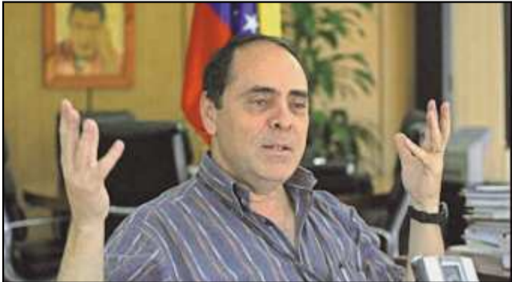
Min. Héctor Navarro: Sabotaje eléctrico "puede ser parte de una agenda de desestabilización".

Navarro dio sus impresiones en ocasión de asistir como invitado al bautizo del libro "Salud: ¿Derecho o mercancía?", editado por la Alianza Interinstitucional por la Salud (AIS) en el Teatro Catia, donde la comunidad organizada participó en el debate sobre el tema, así como en el aporte de propuestas para enriquecer en materia de salud el llamado "programa de la Patria" del candidato presidencial Hugo Chávez.