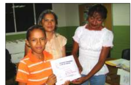
Capacitación a la generación de relevo

Ya estamos encima del burro, solo falta arrearlo, por lo que espero y le deseo éxitos al nuevo Equipo Coordinador que le toca la tarea de continuar con esta labor comunitaria que no es fácil, pero esencial en la formación de un estado en camino al desarrollo socialista.