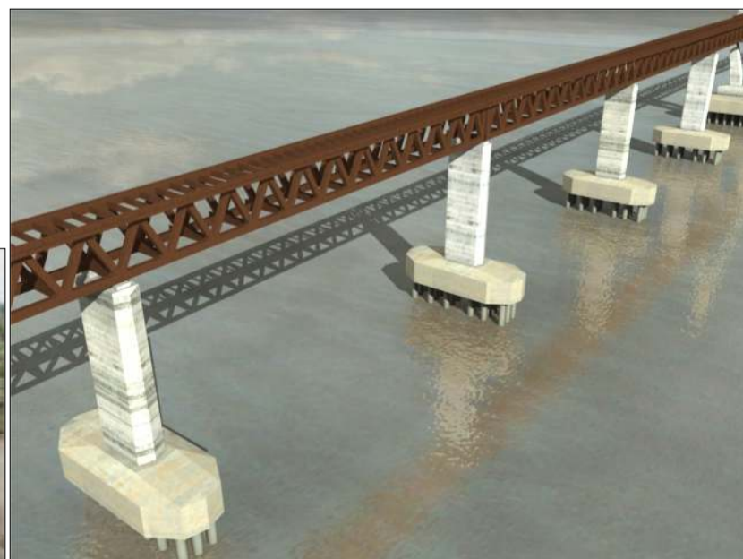
Vista general en 3d de la estructura metálica