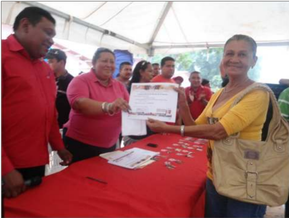
Los consejos comunales se comprometieron a cumplir con el buen manejo de los recursos.

El alcalde Marcos Herrera resaltó una vez más que este logro solo es posible gracias a la revolución liderada por el comandante Chávez