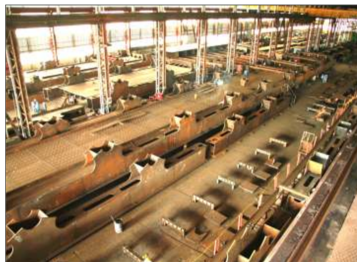
Fabricación de tableros inferiores en los talleres de VHICOA

Como se ha venido informando el III Puente sobre el Río Orinoco llevará un ferrocarril de una vía y una carretera de dos canales de circulación por sentido, que en la práctica consiste en unas estructuras metálicas, fabricadas con acero ASTM 709M grado 345W, la sección más pesada esta por el orden de las 780 toneladas, la mayor longitud por sección es de unos 70 metros a-