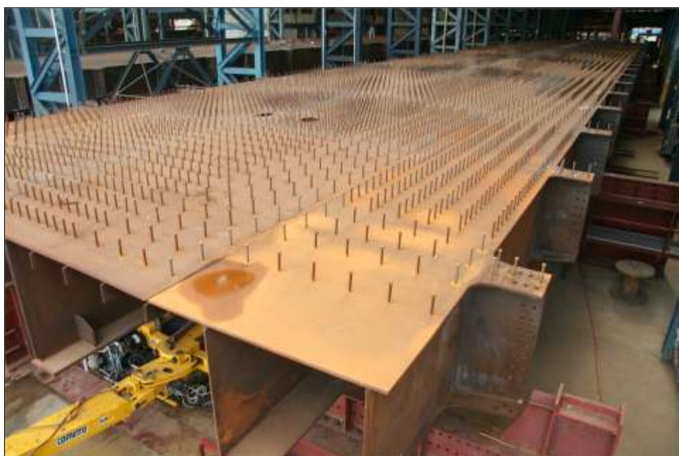
Fabricación de Tableros Superiores en el Taller MDO

proximados y con un ancho de 10.6 metros, con una altura de 3.0 metros aproximadamente.