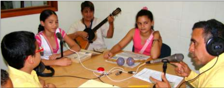
Programas con participación de niñas y niños