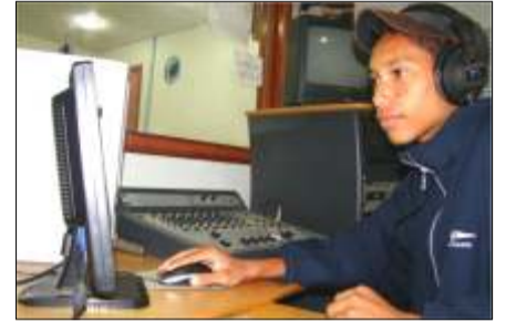
El Fraco de Oro en los controles

Hasta el día de hoy la emisora se ha basado en el Reglamento de Radiodifusión Sonora y Televisión Abierta Comunitarias de Servicio Público sin Fines de Lucro y en reuniones mensuales ordinarias se decide como debe ser la programación,