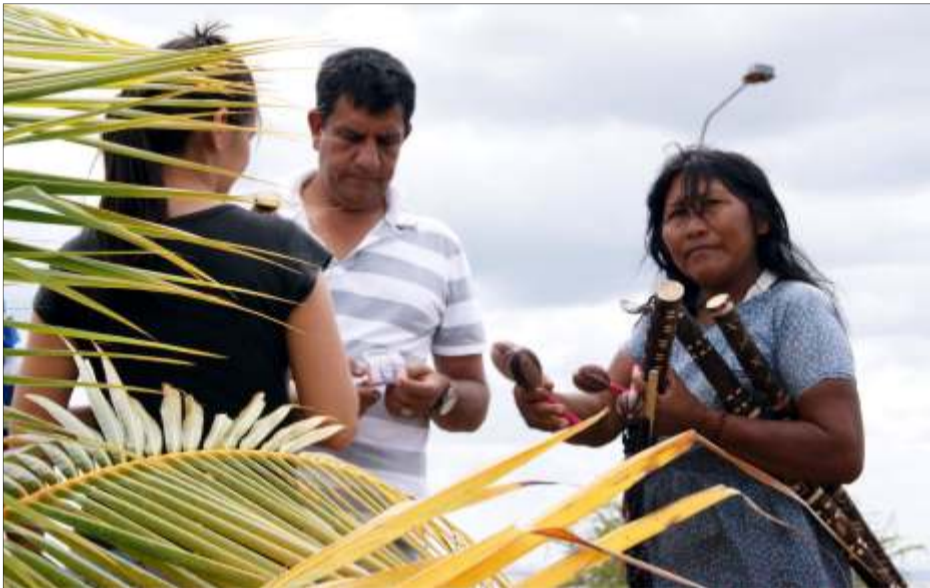
La artesanía indígena como medio de subsistencia

Apure, 09 de agosto de 2012. Prensa PIA-GPV.-