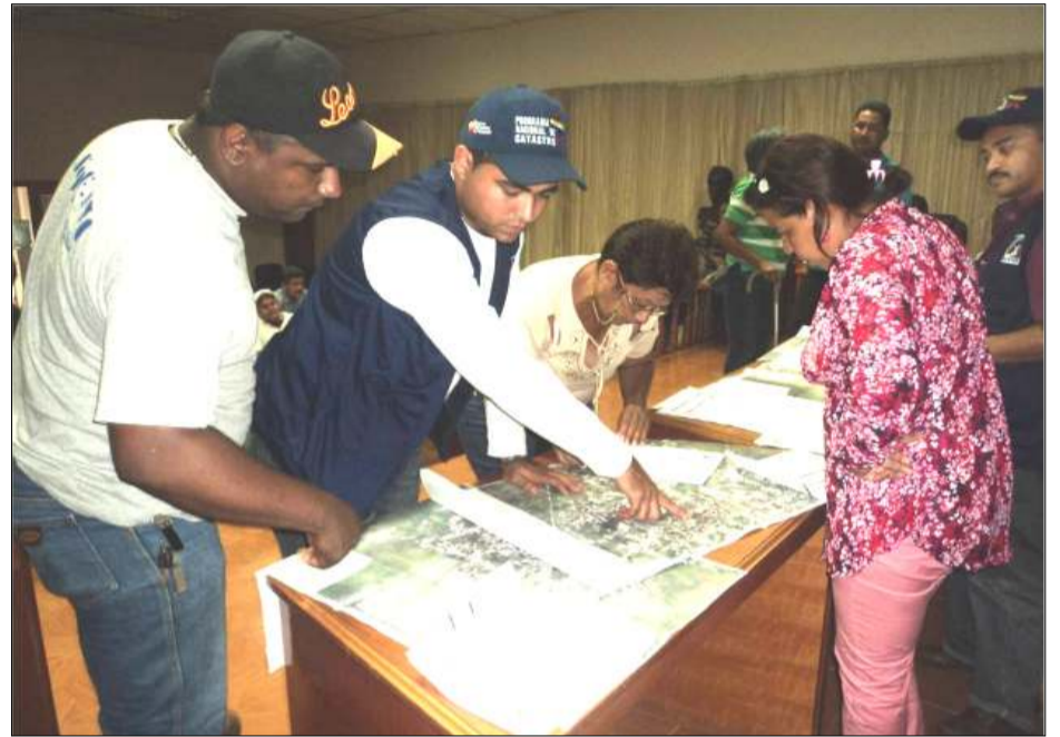
Los Consejos Comunales trabajando de la mano con el Instituto Geográfico de Venezuela “Simón Bolívar”.