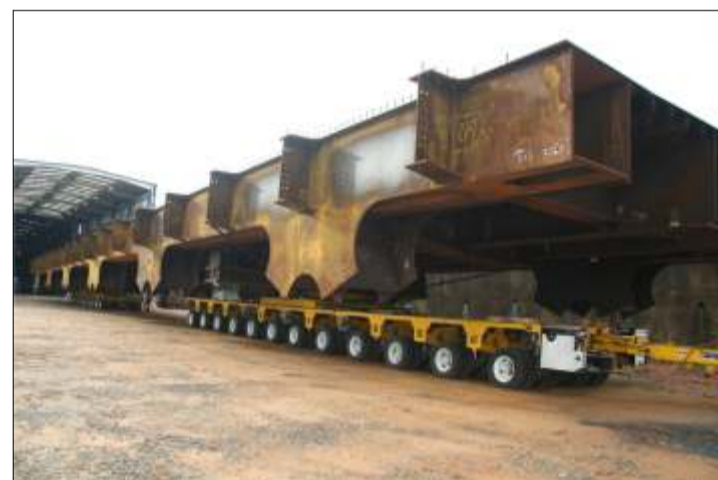
Sistema de transportes cometo en traslado de tableros

-Acceso A2M: : Lado Sur (2 tramos de 480 y 360m) y Lado Norte (2 tramos de 480 y 360m), compuesta en los siguientes módulos: 26x60m, 4x44m, 2x32m, 2x16m y 2x24m.