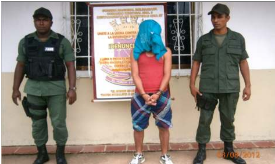
Sujeto detenido solicitado, 05 agosto 12

Efectivos adscritos al segundo pelotón de la primera compañía del destacamento de fronteras Nro. 97 del comando regional Nro. 9 de la Guardia Nacional Bolivariana, con sede en la población de Cabruta, municipio Las Mercedes del Llano del