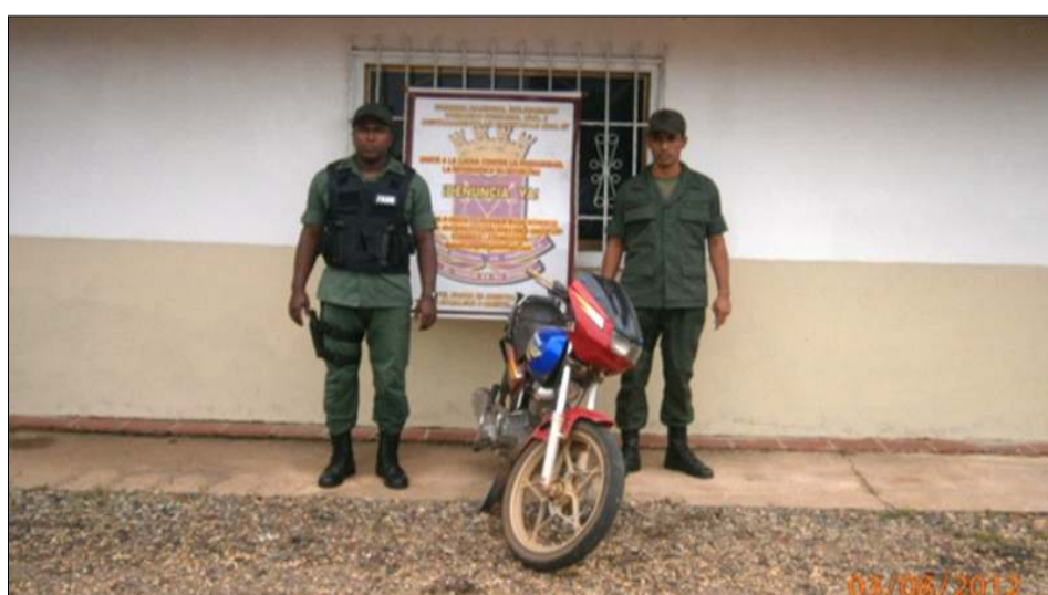
Motocicleta serial del chasis devastado 03 agosto 2012

Efectivos adscritos al segundo pelotón de la primera compañía del destacamento de fronteras Nro. 97 del comando regional Nro. 9 de la Guardia Nacional Bolivariana, con sede en la población de Cabruta, municipio Las Mercedes