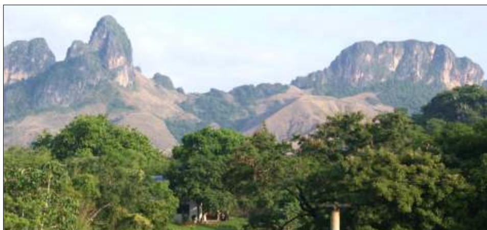
Morros de San Juan

Ahora necesitamos comprender el modo en que las acciones humanas afectan los sistemas. ¡Debemos comprender el modo en que nuestros actos afectan al ambiente que nos sostiene!