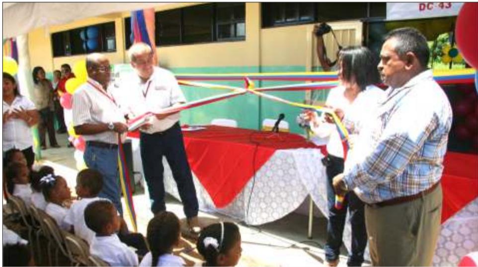
Acto de inauguración por parte de Odebrecht y directivos de la escuela de Terecay

Un total de 60 Niños y Niñas del Preescolar E.B. Estatal D.C. 43 Terecay, se incorporaran en el uso de sus Aulas totalmente Aptas para fortalecer su proceso de Enseñanza-Aprendizaje.