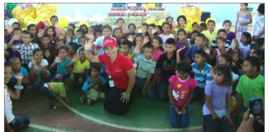
Niños y niñas de Cabruta y comunidades circunvecinas del estado Guárico en celebración de su día

niños y niñas, quienes compartieron un suculento refrigerio, bailes, música, animación de payasitas y payasitos, inflables, juegos y un recorrido o paseo en trencito por toda la localidad, donde los niños disfrutaron un mundo quedando totalmente complacidos y agradecidos por tan divertida iniciativa.