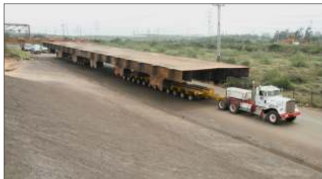
Traslado de tableros hasta muelle delta alianza

La construcción del Sistema vial III Puente sobre el Río Orinoco convertirá a Caicara y Cabruta, en una importante encrucijada de comunicación intermodal: (carretero, ferroviario y fluvial), donde permitirá el crecimiento del comercio e integración de los Estados Guárico y Bolívar.