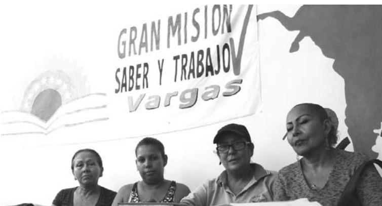
Participantes de la Misión Saber y Trabajo

¿Qué visión tienes de la actividad de Mesas de Trabajo realizada?