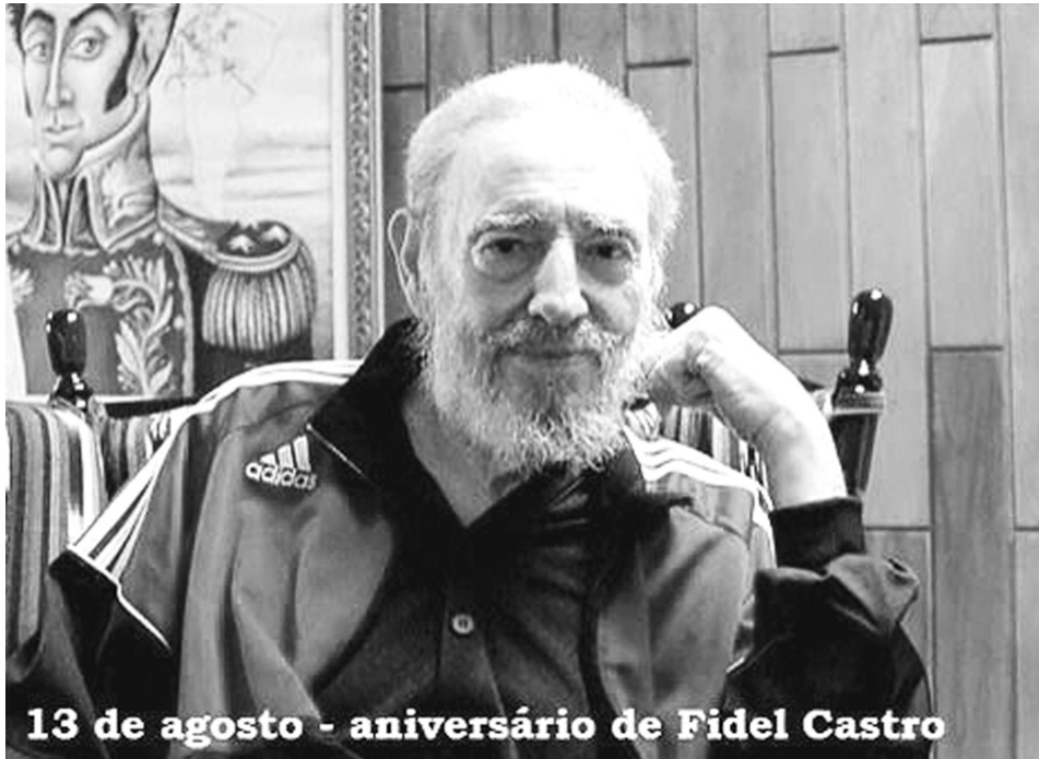
13 de agosto - aniversario de Fidel Castro

Fidel, Fidel.....¿qué tiene Fidel, que el Imperialismo no puede con él?