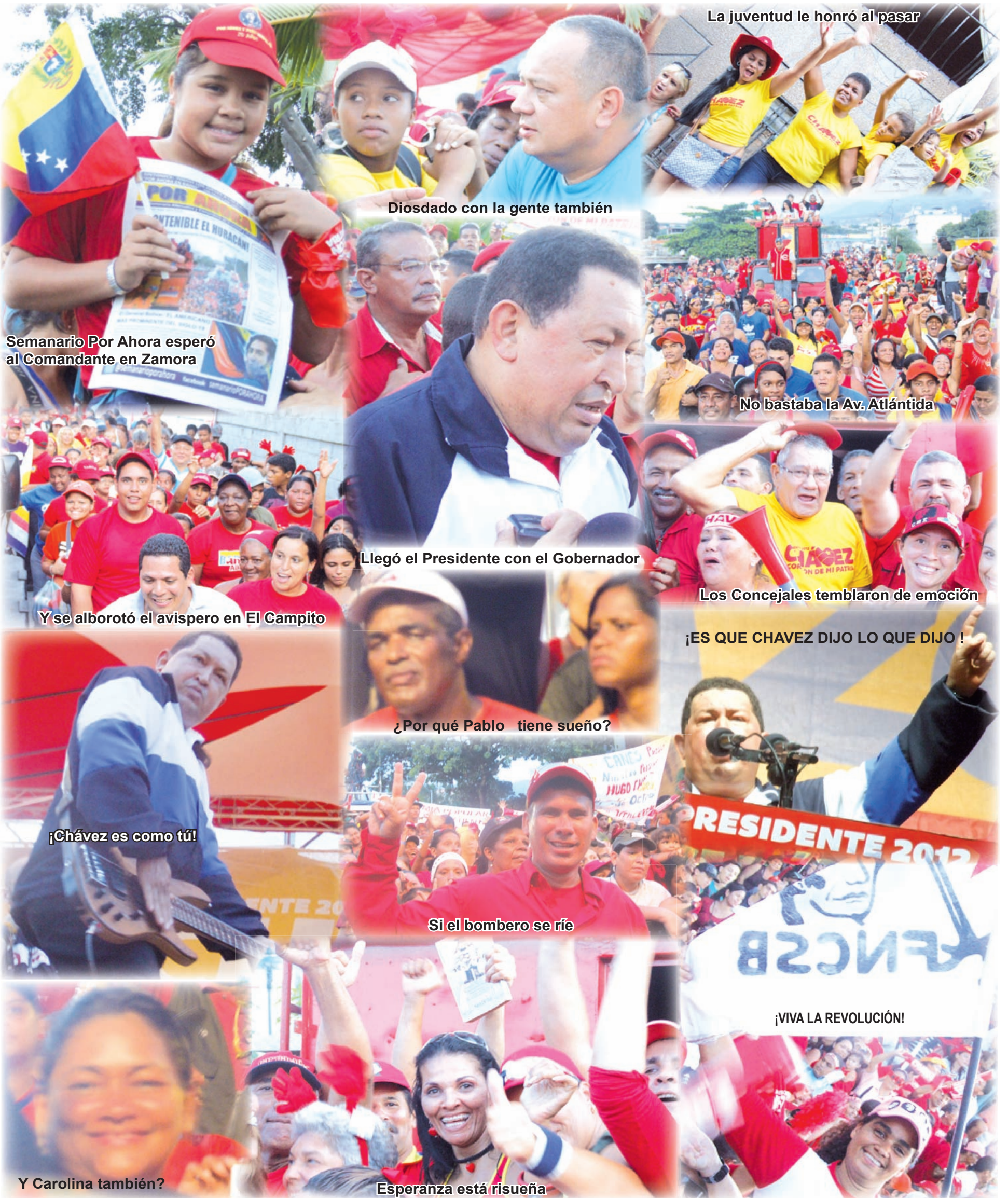
La juventud le honró al pasar