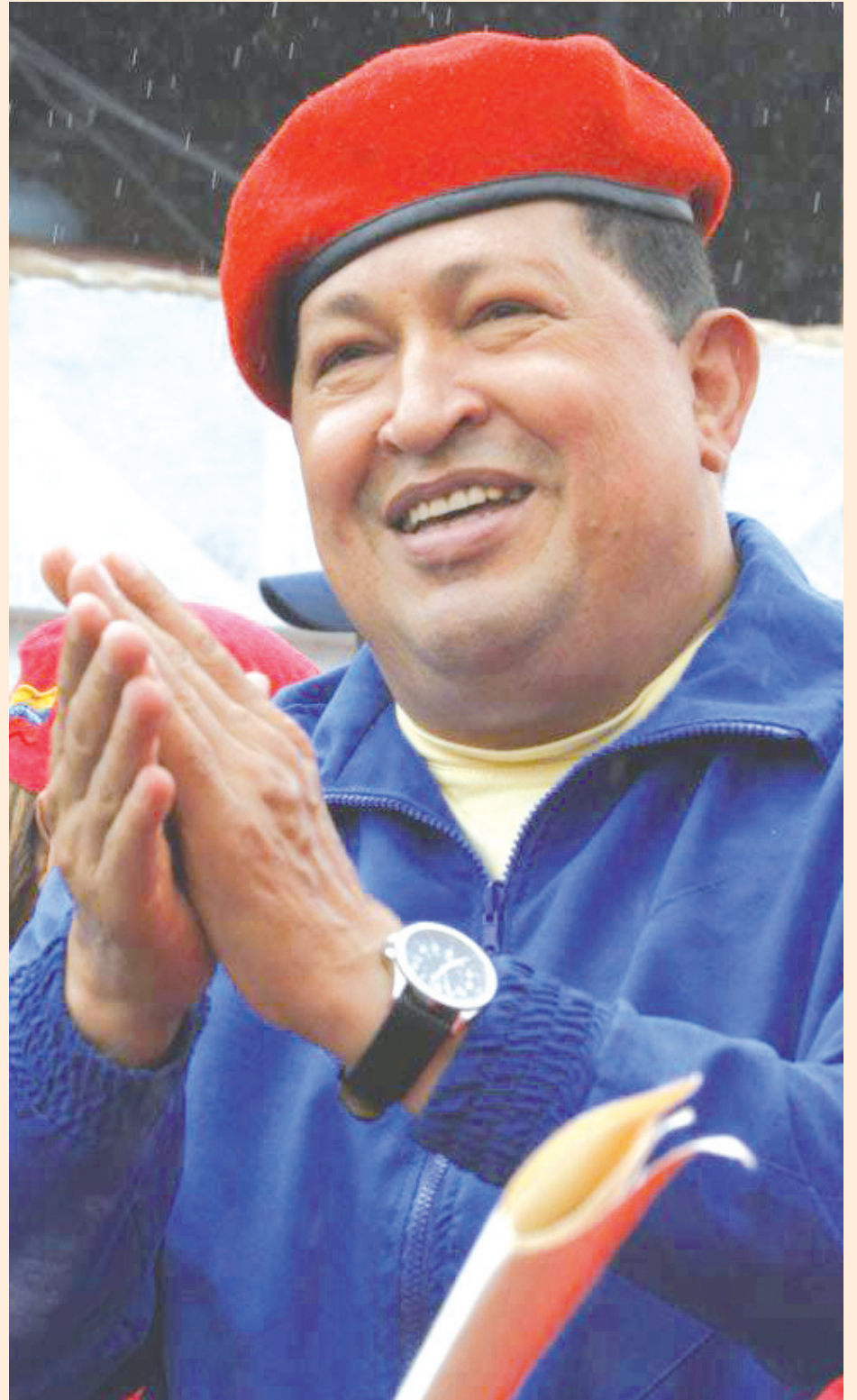
Presidente Hugo Chávez