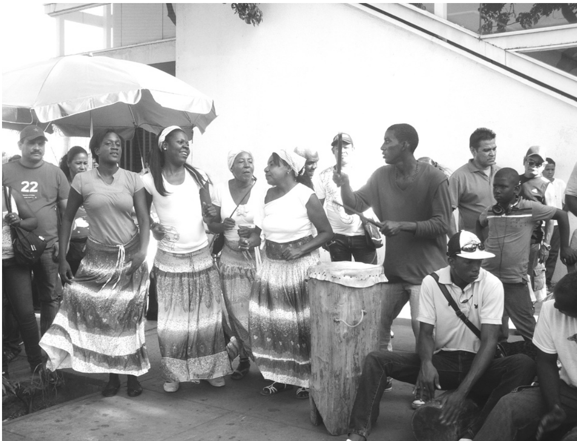
Imágenes de los grupos culturales participantes de la actividad

La actividad comenzó desde la Avenida La Atlántida con un desfile donde