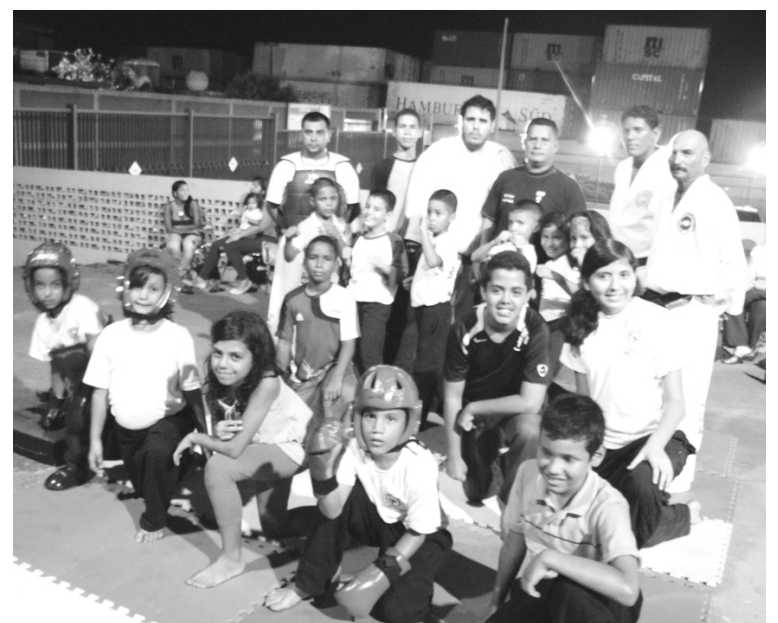
Los alumnos y profesores de la Escuela