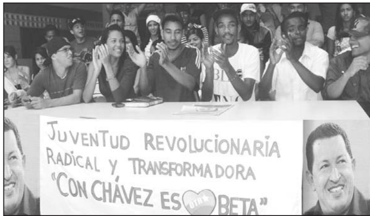
Un aspecto del colectivo de jóvenes en la instalación

"Estamos ampliando los espacios, abrazando los ideales bolivarianos, además de garantizar la constitución y el desarrollo de Vargas de la mano del Gobernador Jorge