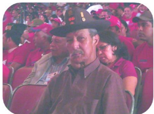
Reseña grafica de la concurrencia