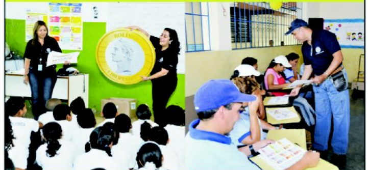
Escuela Nacional de Naiguatá, estado Vargas.