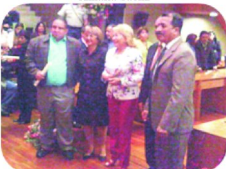
Lic: Humberto Ambrosino departamento de prensa del P.S.U.V