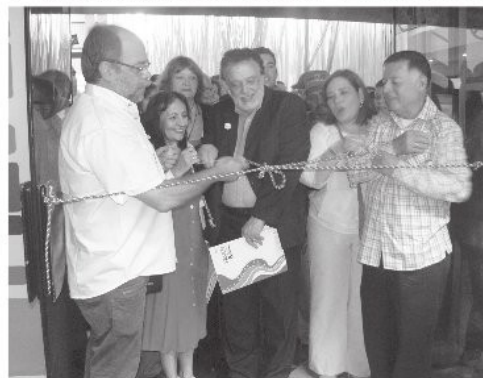
Min Pedro Calzadilla junto al Dip. Francisco Arias Cárdenas en el momento de la inauguración

Esta jornada, se hizo extensiva hasta el domingo 29 de Julio, sin embargo en propicio enfatizar que la FILVEN concentra unos días de promoción para realzar la intelectualidad de los ciudadanos, pero es propicio mantener ese interés en el tiempo sobre todo para las nuevas generaciones.