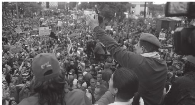
Chavez: Esta es la decima cuarta campaña que vive el pueblo heroico

Ellos tratan de esconder sus orígenes: «Él representa a los adecos y copeyanos. Todos los que apoyan al candidato de la derecha representan al Pacto de Punto Fijo, de ahí vienen», aseguró Chávez.