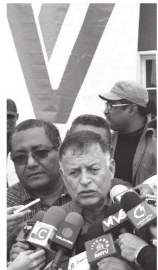
Comandante Francisco Javier Arias Cárdenas, continúa asegurando el buen vivir de los zulianos

de la parroquia Punta Gorda municipio Cabimas, y al sector Punto Fijo I del municipio Cabimas, obra ejecutada por PDVSA-Petrocabimas, Arias Cárdenas, entregó de 68 viviendas dignas en conjunto con el Poder Popular y la comunidad organizada