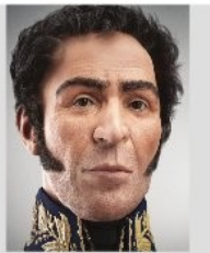
□ Pag. 2

Presidente Hugo Chávez: “Digo con Neruda.. Bolívar despierta cada cien años cuando despiertan los pueblos. Viva Bolívar!! He aquí su rostro!!!”