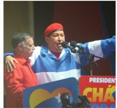
□ Pag. 6 y 7

Con la llegada del huracán bolivariano a la tierra del sol amada, el estado Zulia se llenó de júbilo para recibir al candidato de la patria, comandante presidente Hugo Rafael Chávez Frías.