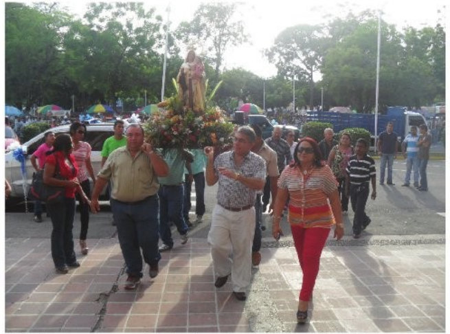
Todo el personal recorrió todas las calles y avenidas de la entidad