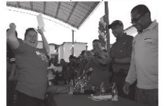
Autoridades hacen entrega de vivienda digna a una beneficiaria

Igualmente comentó que en la calle 100 Sabaneta, donde funciona la Línea 1 del Metro de Maracaibo, la empresa destinó terrenos de su propiedad para también impulsar en ellos la construcción de nuevas edificaciones que ya benefician a los vecinos de este sector del oeste de la capital zuliana, residenciados en el ámbito de influencia de este sistema de transporte superficial.