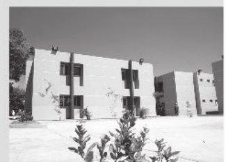
Apartamentos de excelente calidad