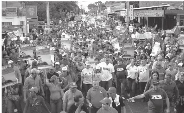
Las calles del municipio San Francisco fueron abarrotadas por todas las misiones