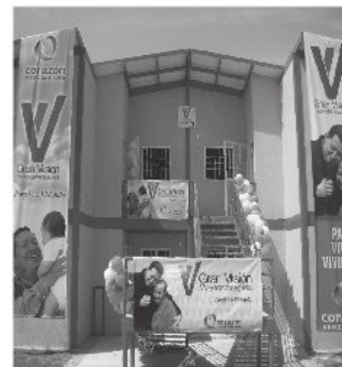
Entrega de Viviendas en Cabimas desarrollo habitacional brisas del lago.

El Coordinador del Órgano Superior para la Vivienda y Hábitat en el Zulia, Comandante Francisco Javier Arias Cárdenas, realizó la entrega de 44 nuevas viviendas que fueron ejecutadas por INAVI y Produza, ubicadas en el Desarrollo Habitacional Brisas del Lago.