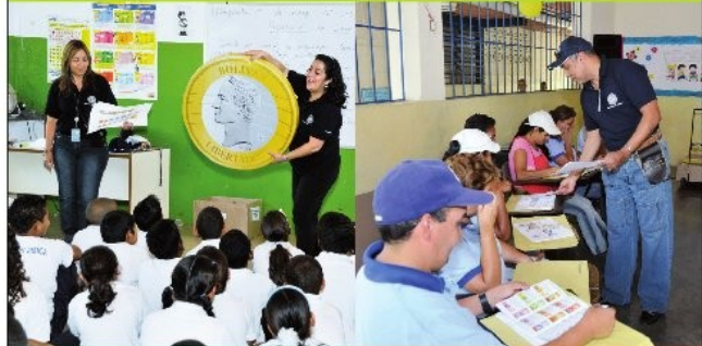
Escuela Nacional de Naiguatá, estado Vargas.