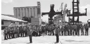
Personal Bolipuerto presentes en el acto inaugural

La rehabilitación de la vialidad interna del Puerto de Maracaibo está enmarcada en una eficiente política socialista del Ejecutivo Nacional, a través del MPPTAA.