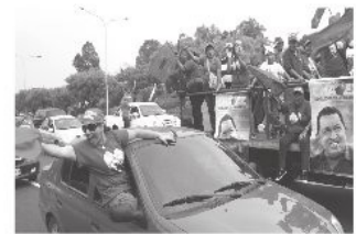
El pueblo tomó las calles marabinas