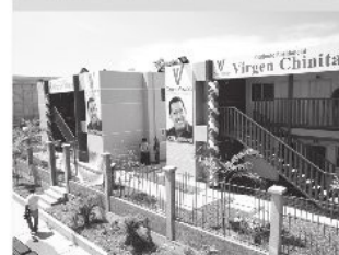
Conjunto residencial Virgen Chinita