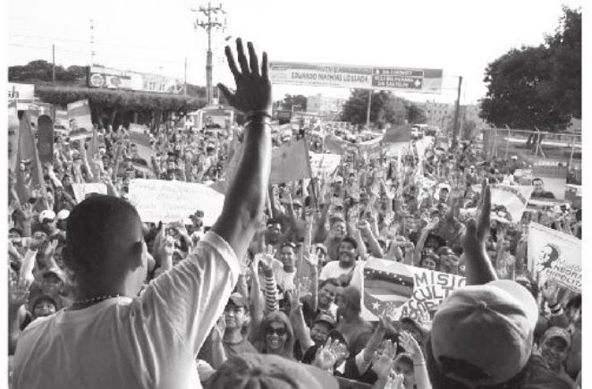
Sureños manifestaron su gran apoyo al comandante Chavez