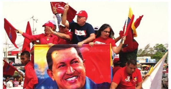
□ Pag. 9

La FILVEN Promueve la Expresión Cultural □ Pag. 2