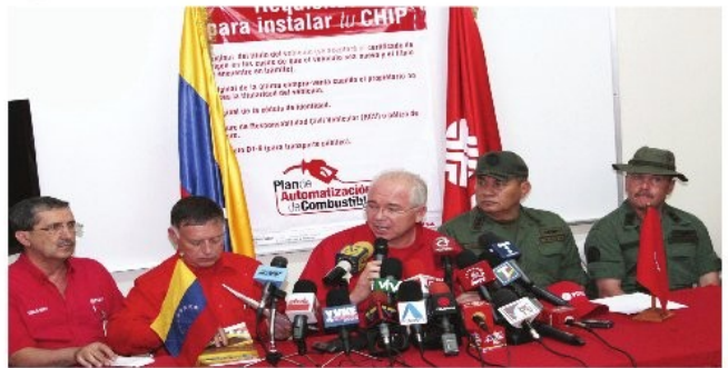
Durante las declaraciones, el Ministro del Poder Popular