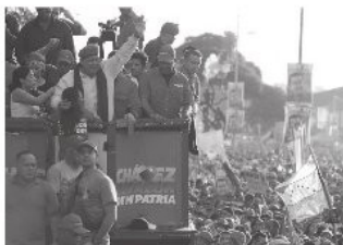
El comandante presidente Chávez a su llegada al estado Lara

Confesó el candidato que hasta el último día de su vida estará luchando por su pueblo y por la patria. «Aún después de esta vida, ya yo lo sé y le doy gracias a Dios y a esta historia, yo me quedaré por estas calles, por estos valles, bajo este cielo y por esta Venezuela bendita, porque Chávez es un pueblo».