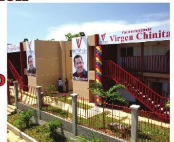
□ Pag. 11