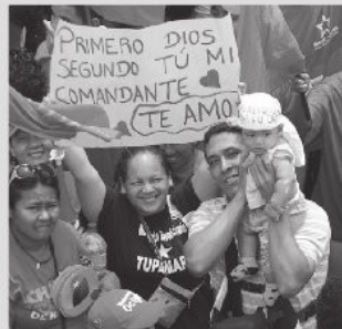
El pueblo da muestra de su amor al comandante presidente Hugo Chavez

Con la llegada del mes de julio llegó la hora de la Batalla de Carabobo. De aquí en adelante el pueblo tomará las calles del país para discutir el Plan de Gobierno 2013-2019, presentar y elaborar propuestas con miras a sellar la victoria el 7 de octubre.