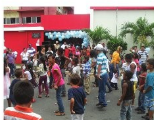
Niños disfrutaron su día en las instalaciones de la sede municipal.

De esta forma la alcaldía bolivariana de Machiques y el alcalde Vidal prieto rindieron tributos a todos los chiquilines del municipio en su día