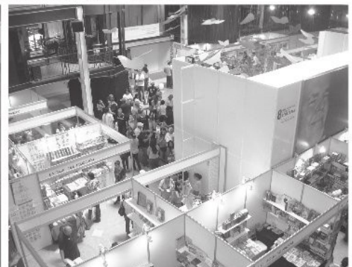
El CamLB uno de los espacios encargado de mostrar la FILVEN.