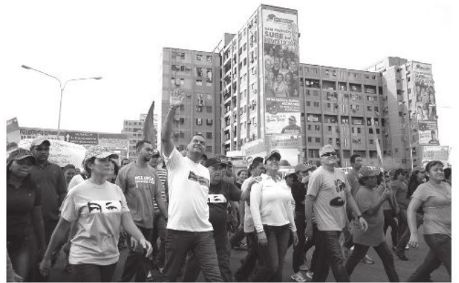
Alcalde Omar Prieto encabezando la caminata

Una vez más el compromiso del pueblo venezolano se hizo sentir en este recorrido por las calles del municipio San Francisco, retribuyendo todo su agradecimiento al presidente Chávez por las misiones que cada uno representa.