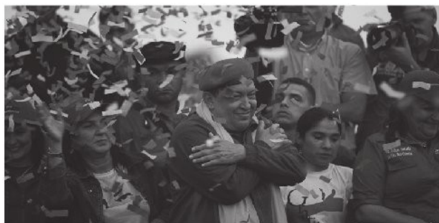
Comandante Presidente Hugo Chavez Recibido por el pueblo de Anzoátegui