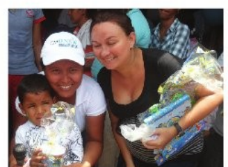
Alcaldía de Machiques de Perijá celebró el día del niño