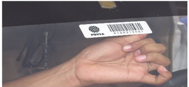
Registro de Automatización para Abastecimiento de Combustible

Gobierno Bolivariano a lo que produce un alto índice criminalidad en el país, es un desastre lo que ha sido la gestión policial y el ataque a la implementación del chip por parte del gobernador en la región zuliana".