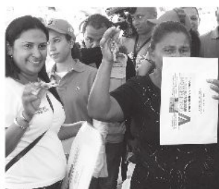
Dos Felices beneficiarias del municipio Colón

El Coordinador del Órgano Superior para la Vivienda y Hábitat, Francisco Javier Arias Cárdenas, en Compañía del Ministro para el Desarrollo y Organización de la Gran Caracas, Farruco Sesto, realizó la entrega oficial de 244 nuevas viviendas dignas en el estado Zulia, de las cuales 12 pertenecen al Conjunto Residencial Villa Gran Colombia del municipio Colón, obra que fue ejecutada por Corpouzulia, en un terreno donado por la Alcaldía de Colón, con el objetivo de brindar buen vivir a familias que se encontraban en calidad de refugiados.