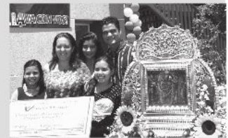
Beneficiarios de Sabaneta hacen honor a la Virgen Morena

la continuación de la Gran Misión Vivienda Venezuela, entregando estos 12 apartamentos de excelente calidad, para la vida mejor y, sumamos otro componente que se inicia en las próximas horas; como lo es el apoyo para la rehabilitación de viviendas".