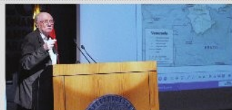
□ Pag. 4

Giordani Asegura que se Cumplirá Meta de Inflación