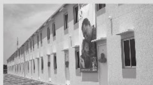
Parroquia Concepción de la Cañada cuenta con viviendas dignas

inversión de 77.318.840,15 millones de bolívares