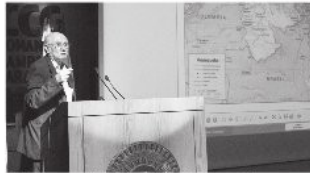
Ministro de Planificación y Finanzas, Jorge Giordani

Al ser consultado, sobre la baja en la cotización de la cesta petrolera nacional desestimó que la caída del precio de petróleo venezolano en las últimas siete semanas, vaya a afectar la economía. “El presupuesto no va a ser afectado, tenemos un buen margen aún, y si se diera el caso pues se tomará las medidas que el presidente Chávez indique”.