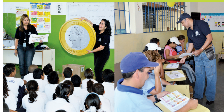
Escuela Nacional de Naguayatá, estado Vargas.