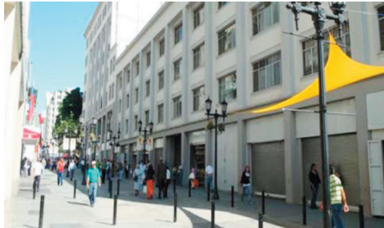
Among rescued spaces may be counted the city's main square Bolivar; Sabana Grande, the city's longest and most famous boulevard; as well as comprehensive renovation of buildings like the main post office Carmelitas, theater Teatro Principal, church Santa Capilla

In turn, citizen Maria Alvarado emphasized the significance of having these restored areas. "We used to walk