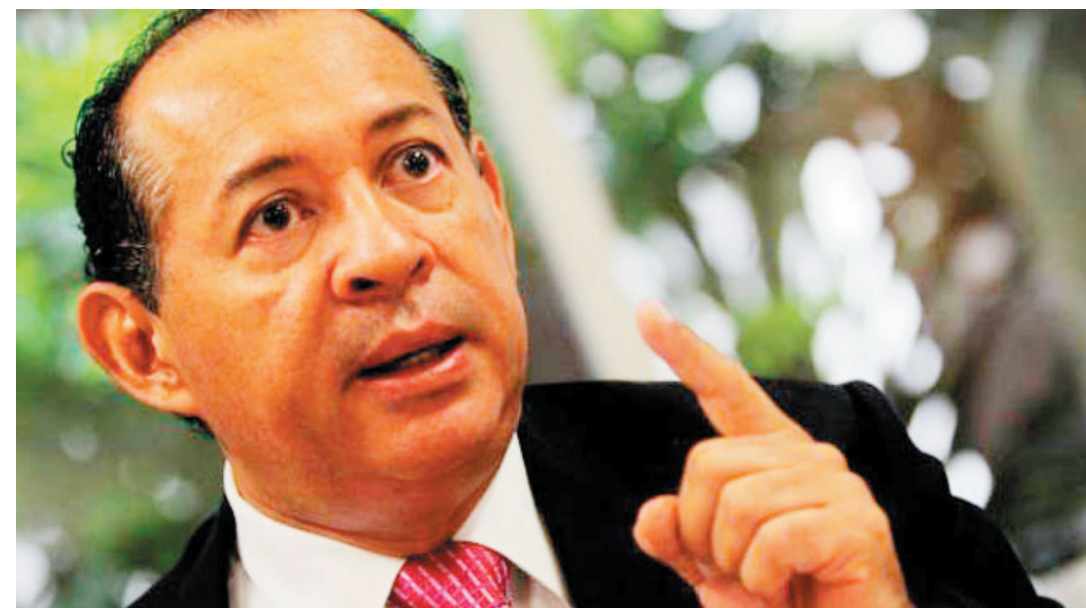
Tovar explica que la creciente confianza en torno al Sucre se debe a que el mecanismo es flexible y permite operaciones rápidas

financiera denominado Sucre nace en 2008 durante la III Cumbre Extraordinaria de Jefes de Estado y de Gobierno del ALBA-TCP realizada en Caracas.