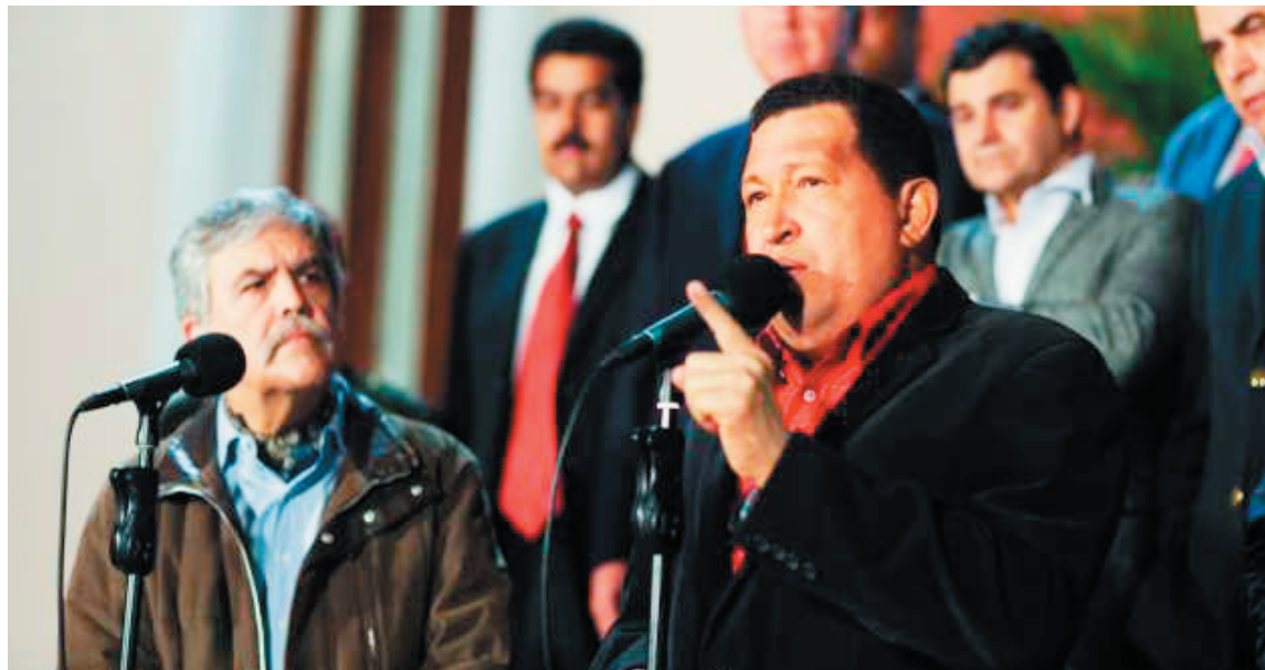
Chavez informed that Venezuela’s Executive will create a fund of at least $500 million for the rest of the year amid the country’s entrance as Mercosur full member

The nationalization of YPF “has encouraged us a lot because it will give us more capacity to assemble, coordinate, strengthen and continue developing