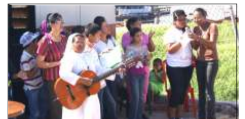
Con cánticos se celebró la Santa Misa