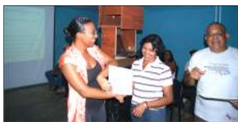
Entrega de certificados de curso de fotografía

El pasado 20 de junio se realizó el evento de elección de los nuevos ciudadanos y ciudadanas que formarán parte del Comité Coordinador y Comité de Contraloría interna de la Fundación Comunitaria la Voz de Cabruta. Personas que tendrán la tarea de conducir y dirigir a la Radio Comunitaria La Voz de Cabruta 104.1 FM, para el período 2012-2015. Todo esto basándose en las cláusulas vigésimo sexta y vigésimo séptima de los estatutos del Acta Constitutiva de FUNDAVOZ.