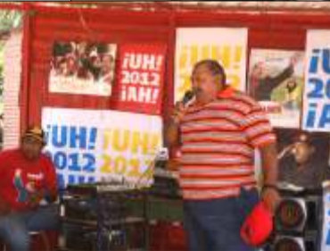
Intervención de los productores