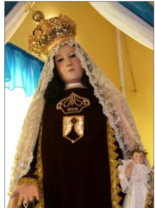
diseño gráfico: f. hernández

08:00 am -Cuadrangular de Softbol. Copa: Hugo Chávez Frías. Lugar: Estadiu Manuel Palma. Responsable: Víctor Rodríguez. 09:00 pm -Paseo de abuelas y abuelos del INASS por sectores de la población. Responsable: Sr. Alfredo. 10:00 am -Campeonato de Pico y Espuela. lugar: Gallera El Oásis. Responsable: Sr. Vicentico. 4:00 pm -Culminación de Toros Coleados Cat. Libre. Copa: Presidente de la República Bolivariana de Venezuela Hugo Chávez. Lugar: Manga Porfirio Lara. 08:00 pm -Presentación de artistas de música llanera y "Gran Amanecer Llanero". Responsable: Tomás (El Negro) Moreno.