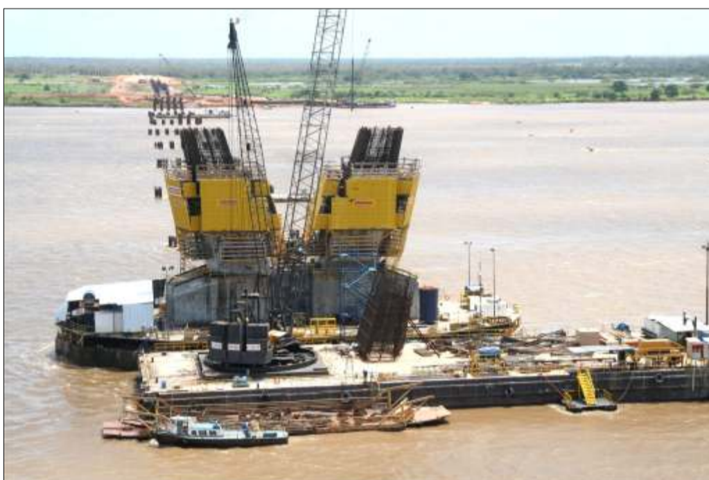
Vista general - torre 1 norte

Al mismo tiempo se impulsará el crecimiento de la región sur oriental y por ende del país como un todo, mediante el aprovechamiento de las potencialidades agrícolas, pecuarias, mineras y forestales de la zona.