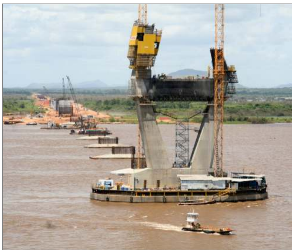
Vista general -torre 1 sur