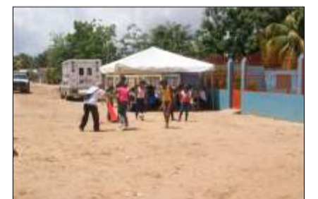
El Kikinbol estuvo muy competitivo

El pasado 8 de julio a partir de las 7:00 de la mañana, se dieron cita los Consejos Comunales de la parroquia Cabruta, para la activación de los Comités de Cultura y Deporte, en una armonía festiva en el sector Brisas del Sur, en donde disfrutaron de juegos deportivos, actividades folklóricas, operativo de mercal, medicina en general, oftalmología, entre otros; se contó con personas que se dedicaron a difundir los logros de la Revolución Bolivariana, en una sana paz.