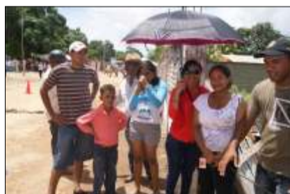
Mercal benefició a la comunidad