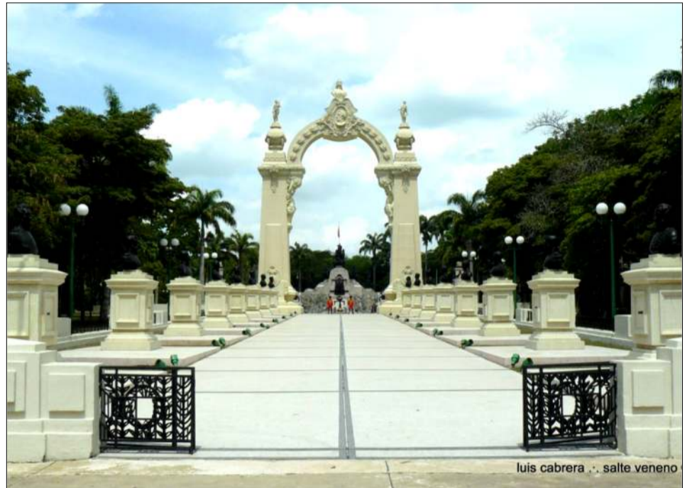
Campo de Carabobo