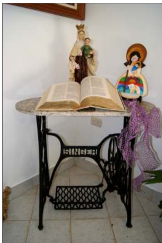
Máquina de coser del año 1924