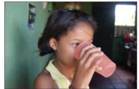
No sabemos si esta agua se encuentra contaminada

Vecinos temen por un brote de dengue o diarrea, debido a la posible contaminación de las aguas servidas. Por ese motivo solicitan a las autoridades competentes locales o regionales que supervisen para constatar el estado de las mismas.