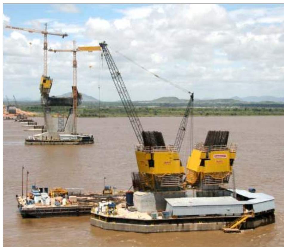
Vista general -torre principales 1 norte y 1 sur