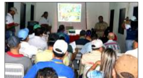
La asistencia de técnicos fué masiva

Por otro lado la presencia de la delegación de Cuba nos da garantía del rescate del cultivo en la zona alta ya que se construirá una guía para los productores con la finalidad de servir de apoyo en caso que lo amerite.