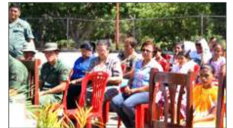
La presencia de la comunidad no pudo faltar