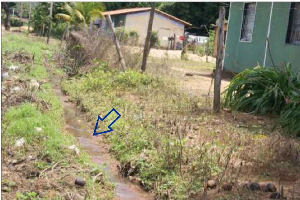
Las aguas de esta cloaca desbordada corren libremente por la calle principal del sector La Arenosa

Por la vía principal de la arenosa fluye un manantial, un manantial pestilente producto de cloaca colapsada.