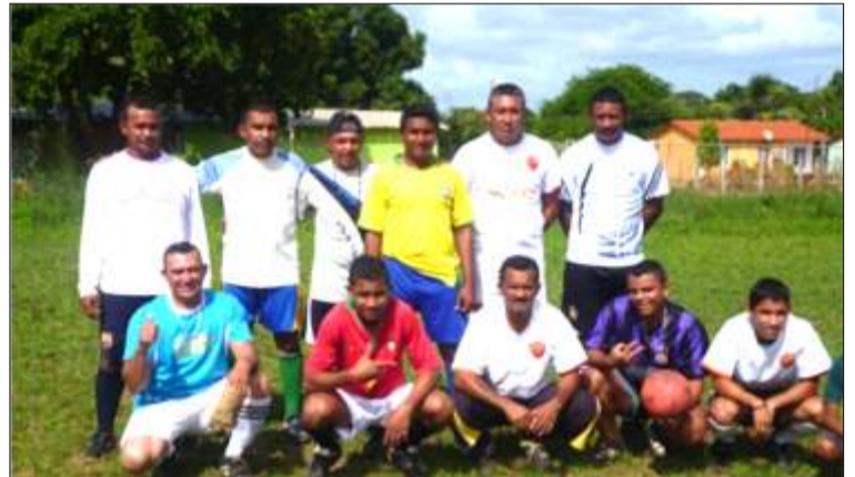
Cabruta siempre presta para enfrentarse a la mejor selección