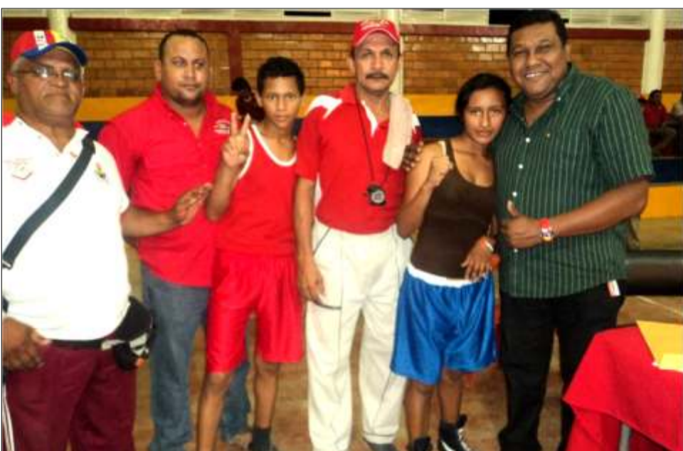
Alcalde Marcos Herrera impulsa constantemente el deporte en el municipio Las Mercedes del Llano

Una vez más el nombre del municipio traspasa las fronteras del estado Guárico gracias los profesionales del deporte, quienes se han encargado de dejar bien claro que en Las Mercedes del Llano hay talento de sobra