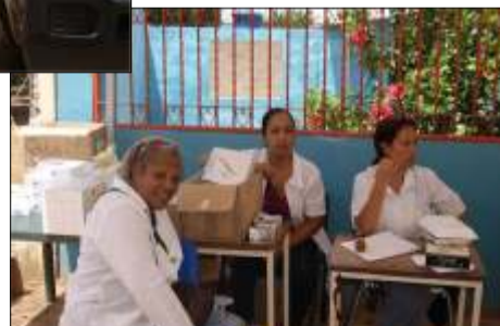
Con ahínco se desarrolló el operativo médico