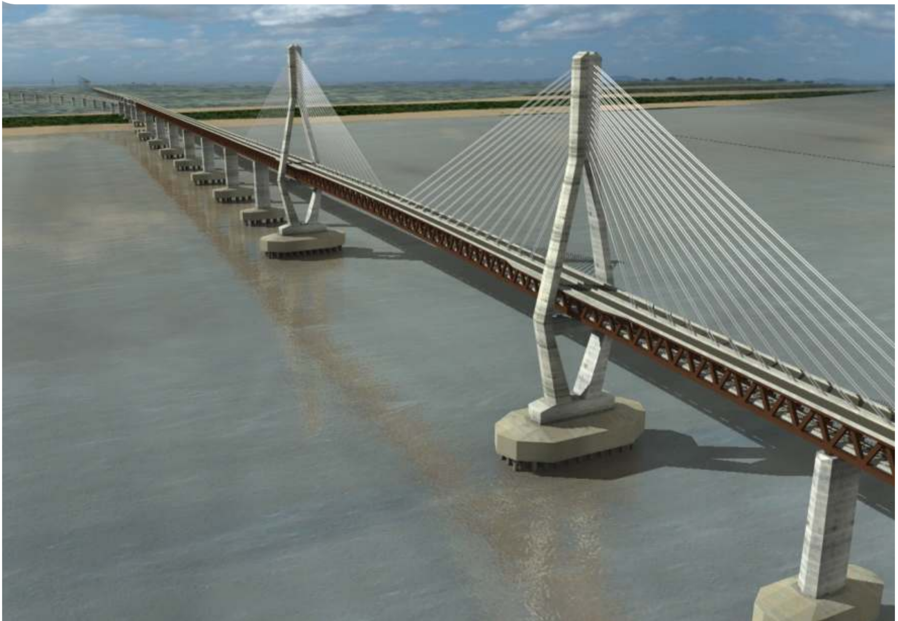
SISTEMA VIAL III PUENTE SOBRE EL RIO ORINOCO (CULMINADO)