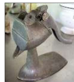
Sacador de jugo de 1800