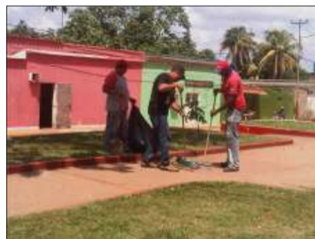
Representantes de instituciones se dieron cita en la plaza Bolívar de Cabruta, para acondicionarla

estatua del Libertador Simón Bolívar y la entonación del Himno Nacional. Seguidamente de parte de los niños y niñas mostraron el folklore con coloridos actos culturales por parte de los centros educativos, los cuales realizaron diversas representaciones artísticas como: poesías y bailes típicos.