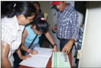
Momentos de la votación secreta y firma del acta, para elección de comité organizador de FUNDAVOZ

alternativa; posteriormente se hizo entrega de certificados de curso sobre fotografía, dictado por FUNDAVOZ y avalado por el MINCI el pasado mes de Mayo, se procedió a las postu-laciones de personas presentes para luego ir a la elección secreta y directa.