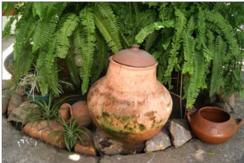
Tinaja para refrescar el agua potable, del año 1976

Les ofrezco una selección de las más importantes, que para mí son todas, pero os recomiendo una visita a la casa de este personaje real que estará exponiendo en su galería personal (su casa), todas estas originalidades para su querido público.