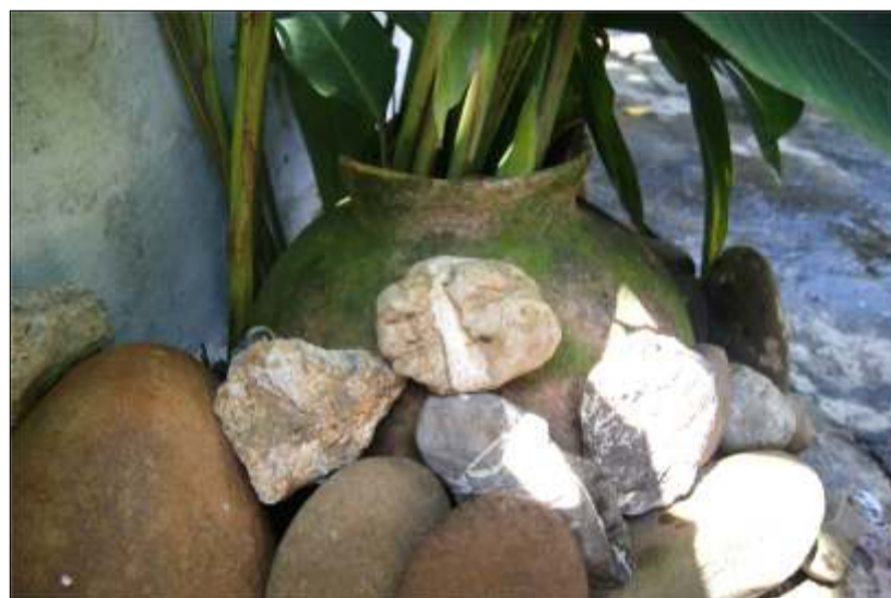
Tinaja encontrada en Cabruta en casa de la calle El Carmen, a casi tres metros de profundidad