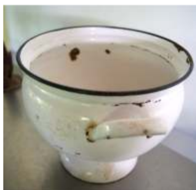
Sopera de peltre de los años '50