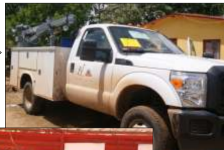
Vehículo para el servicio de la maquinaria agrícola