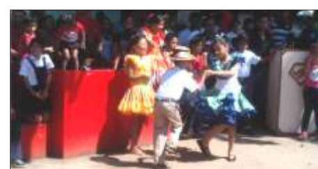
Las presentaciones culturales estuvieron presentes en el acto de los 201 años de independencia de la República Bolivariana de Venezuela