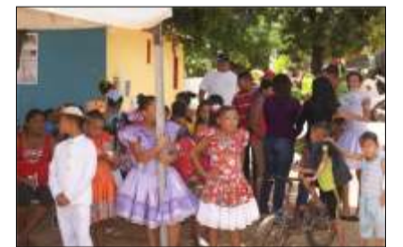
Bailes de Joropo con calidad