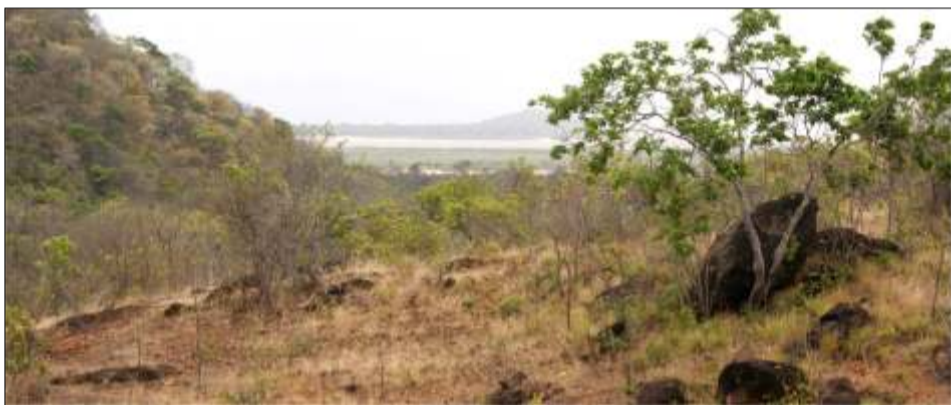
Vista de la entrada al río Orinoco por el Caribe, paso muy antiguo en Cabruta

El Día Mundial del Medio Ambiente, día establecido por las Naciones Unidas, hace un llamado a la comunidad mundial a tomar acciones precisas sobre el deterioro del medio ambiente.