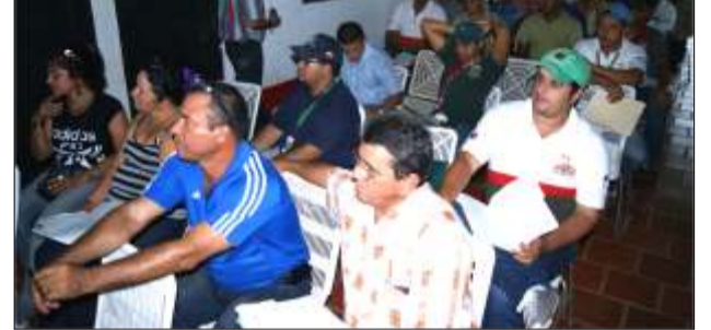
Asistentes al curso-taller, con presencia de la delegación Cubana

Así lo dio a conocer el Ing. Oldani Ochoa, coordinador de algodón (FONDAS-CARACAS), señalando "...que con este segundo curso-taller, se pretende capacitar no solo a técnicos, sino también a productores en la zona alta del municipio Las Mercedes del Llano, ofreciéndoles las nuevas tecnologías en el manejo del cultivo para así insertarlos al proceso productivo", finalizó diciendo.