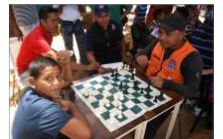
Muy apreciado fue el deporte ciencia