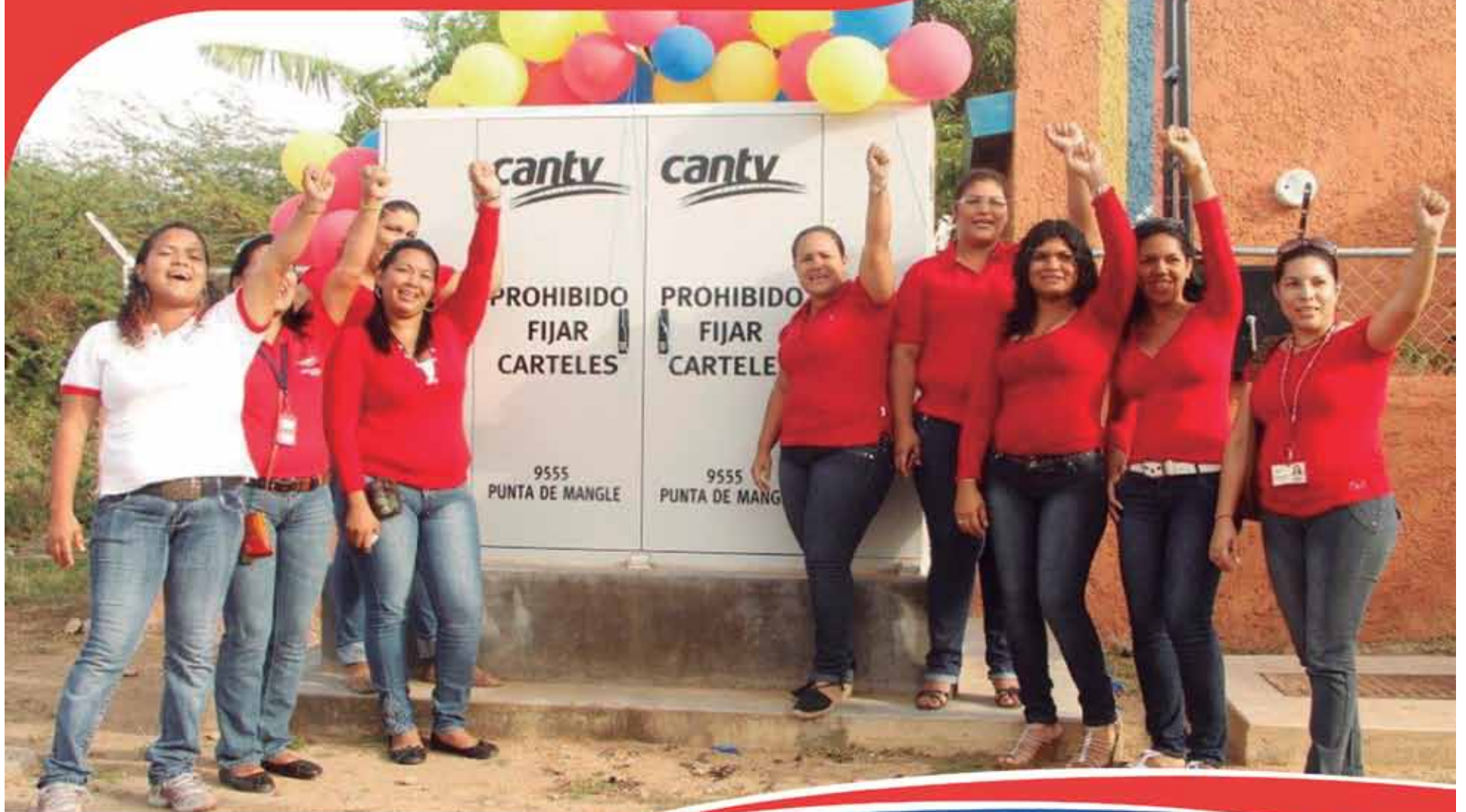
Sector Punta de Mangle, municipio Tubores estado Nueva Esparta

Punta de Mangle, en Nueva Esparta; Mesa Bolívar, en Mérida; Arrecife, en Vargas y El Cercado, en Lara, son sólo algunos de los poblados históricamente excluidos, que desde abril de este año cuentan con acceso a los servicios de Cantv gracias a la instalación de nodos de nueva generación y a la modernización de centrales telefónicas.